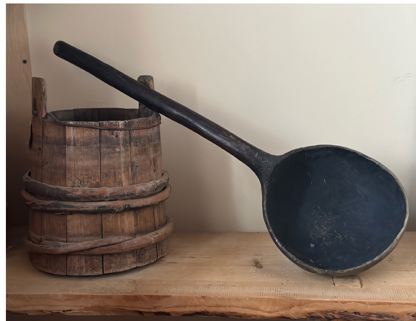
Кат. 112. Ковш. 1930-е. Королев А.С.

112. Ковш. 1930-е годы. Королев А.С. Дерево, долбление, резьба 84,0×16,5×27,0 см КБИАХМ КП-9378 Д-828 №ГК- 12931986