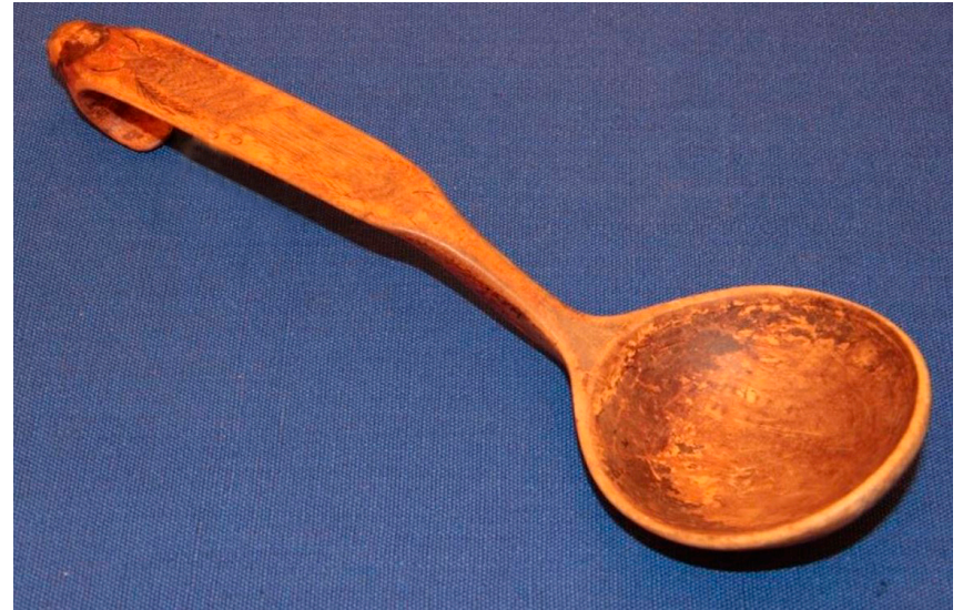
Кат. 24. Черпак-ложка. Конец XIX века – начало XX века