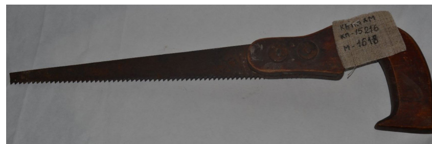
81. Пила-ножовка. Середина XX века