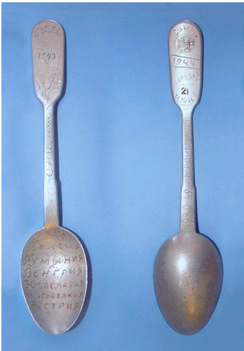
Кат. 5. Ложка. 1940-е

1. Ложка. XIX век Металл, штамповка 15,0×2,5×1,5 см КБИАХМ КП-2961 М-808 №ГК- 5843141