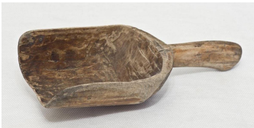
Кат. 115. Сок для муки. XX век

113. Сок (модель). 1950 год Кирилловская артель «Древкустарь» Дерево, резьба КБИАХМ НВ-7