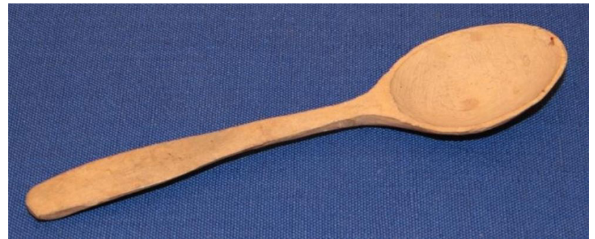
Кат. 38. Ложка. Начало XX века