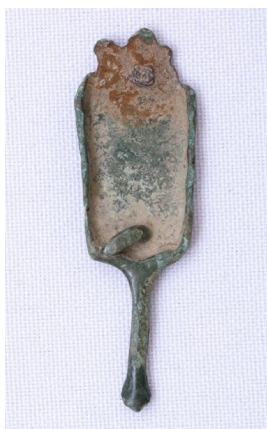
Кат. 53. Копоушка. XVII век

67. Ковш «Лебедь». 1980-е годы Дерево, краска, работа токарная, роспись 35,0×28,0×19,5 см КБИАХМ КП-26753 Д-2761 №ГК- 7954981