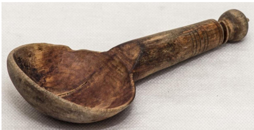
Кат. 40. Ложка. Первая половина XX века

46. Чайная ложка с тонким черешком Первая половина XX века Западная Европа Металл, отливка