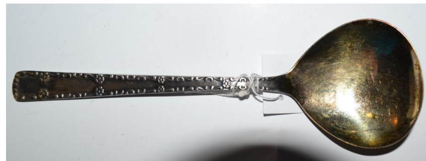
Кат. 16. Ложка десертная. 1970-е