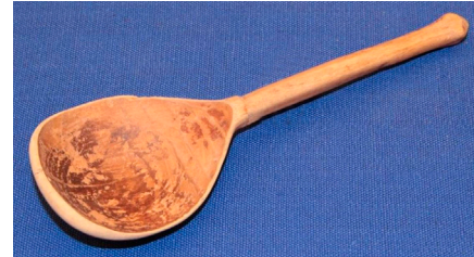
Кат. 31. Ложка. Начало XX века