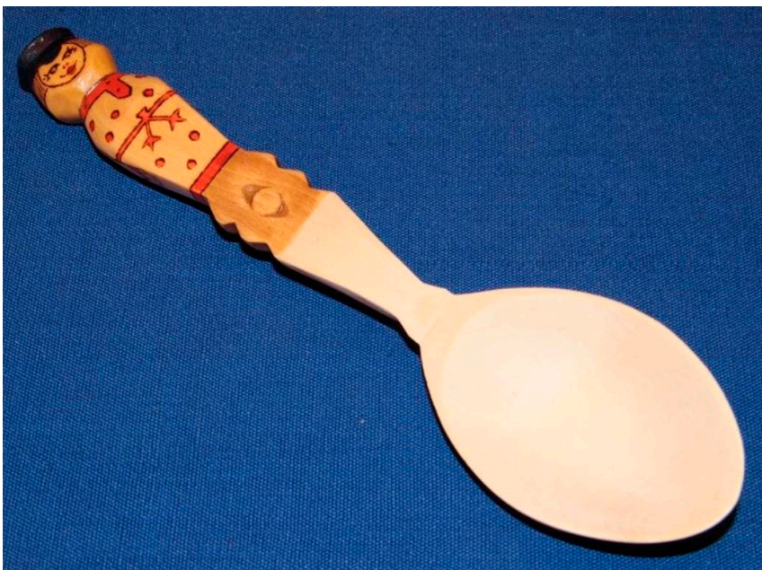
Кат. 62. Ложка сувенирная «Иван». 1980-е. Малый Ю.М.

68. Ковш-скобкарь. XIX век Дерево, левкас, краска, резьба, долбление, роспись 25,6×54,0×35,0 см КБИАХМ КП-23806 Д-1724 №ГК- 8394749 К.о. 6