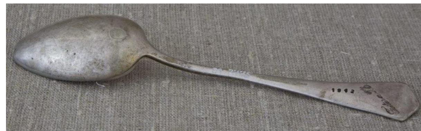
Кат. 6. Ложка столовая. 1942

26. Ложка. Конец XIX века. Степанов Д.С. Дерево, резьба 20,5×5,0×2,3 см КБИАХМ КП-10662 Д-1022 №ГК- 5543309