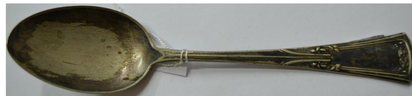
Кат. 9. Ложка столовая. 1918–1930-е