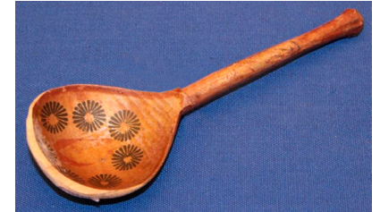
Кат. 36. Ложка. Начало XX век