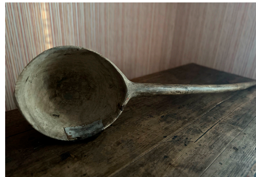
Кат. 96. Ковш. Начало XX века

101. Ковш. Первая половина XX века Дерево, долбление, резьба 7,0×39,0×9,5 см КБИАХМ КП-7867 Д-699 №ГК- 6035098