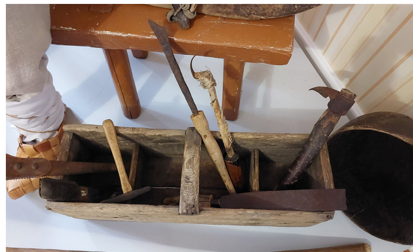
80. Ящик. Конец XIX – начало XX века

90. Заготовка для изготовления деревянной ложки Первая половина XX века Дерево, долбление, резьба