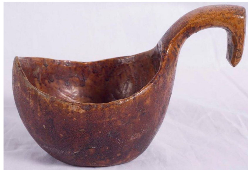
Кат. 70. Ковш. Конец XIX века – начало XX века

79. Токарный лучковый ложкарный станок. Конец XIX века Дерево, металл, кожа, долбление, столярная работа, сборка 75,0×52,0×16,0 см КБИАХМ КП-3059/1 Д-228 №ГК- 17920202