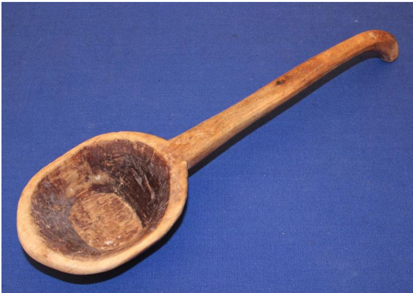
Кат. 21. Черпак-поварешка. Начало XX века