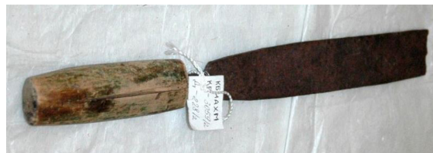
84. Терпуг. Первая половина XX века