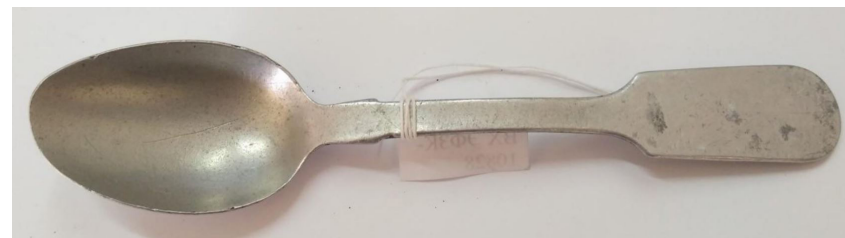
Кат. 13. Ложка чайная с прямым плоским стеблем. 1950–1960-е