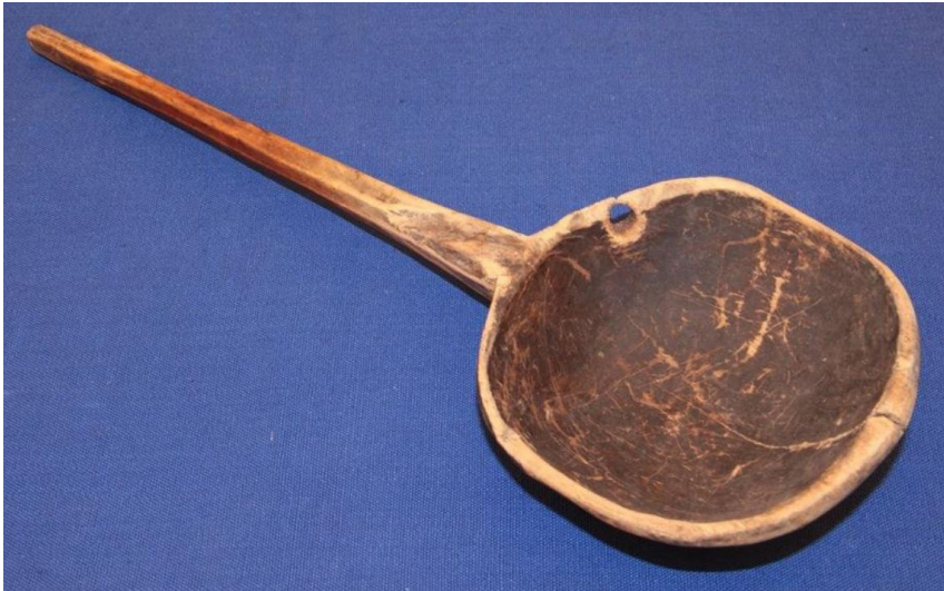
Кат. 20. Поварёшка. Конец XIX века – начало XX века