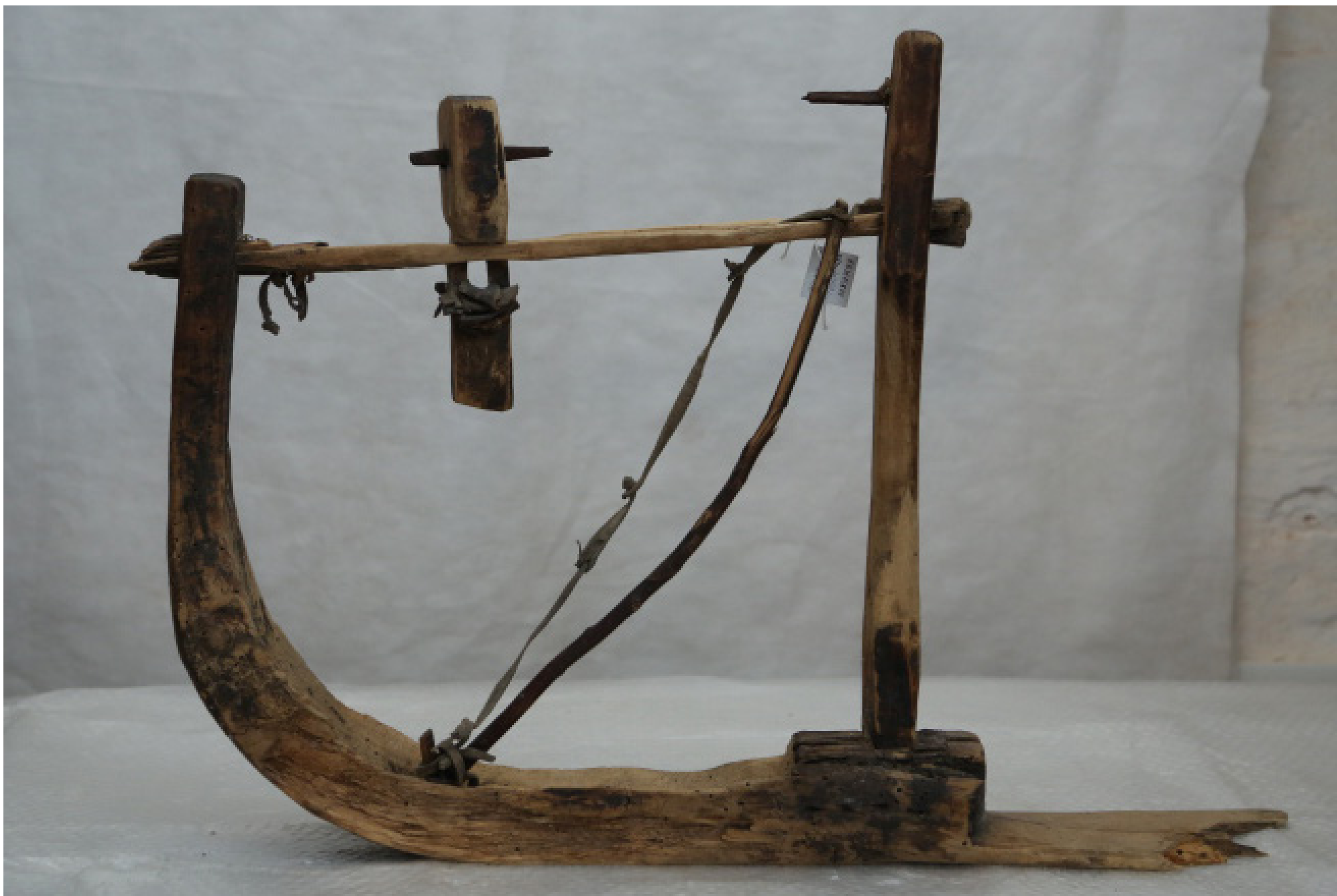
Кат. 79. Токарный лучковый ложкарный станок. Конец XIX века