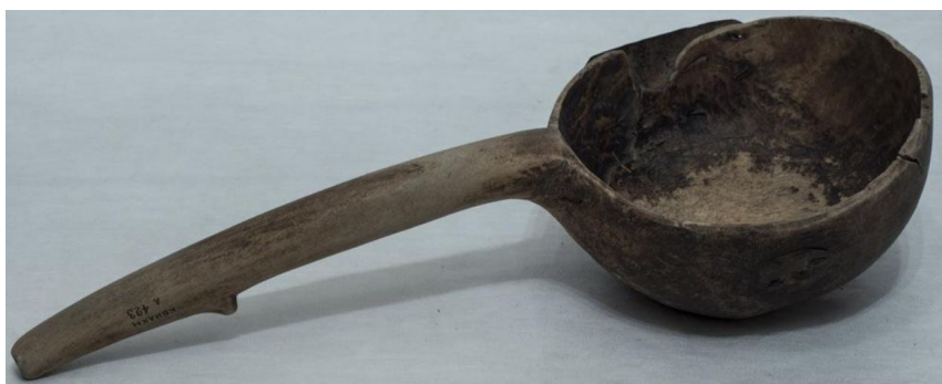
Кат. 105. Ковш. Первая половина XX века

102. Ковш. Начало XX века Дерево, резьба 13,6×31,5×15,5 см КБИАХМ КП-14911 Д-1269 №ГК- 6278450