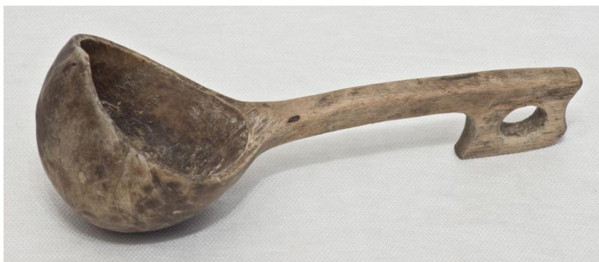
Кат. 99. Ковшик. Конец XIX века