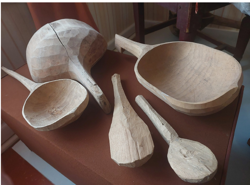
Ковши и заготовки для изготовления деревянной ложки

19,5×6,0×3,0 см КБИАХМ КП-3059/8 Д-3318 №ГК- 17920165