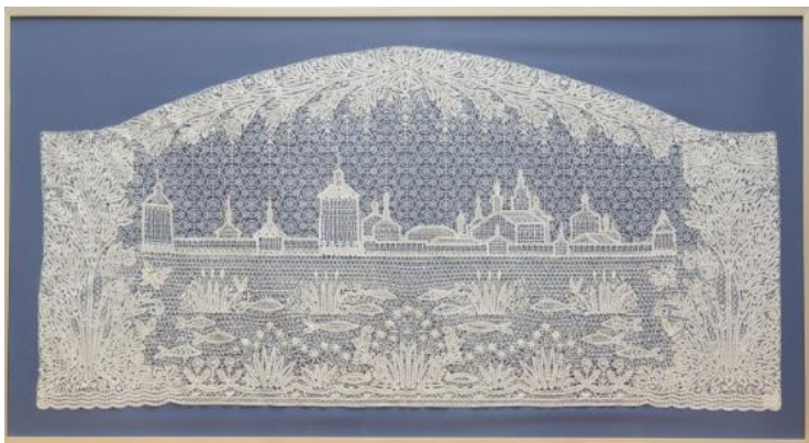
Фото 8. Панно «Благословенный день». Г.Н. Мамровская. 2016 год

Это панно «Спасительное пристанище для душ», «Мелодия вечности» и «Благословенный день». Они были выполнены по рисункам Г.Н. Мамровской группой талантливых мастериц фирмы «Снежинка» в единственном экземпляре и являются гордостью коллекции кружева Кирилло-Белозерского музея-заповедника.