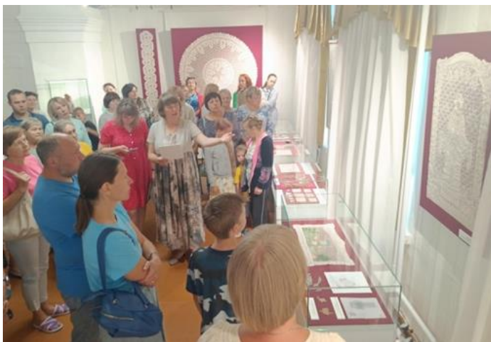
Фото 5. На открытии выставки «Кружевное узорочье» в Сольвычегодском музее-заповеднике

С марта по июнь 2024 года вологодские кружева были показаны в стенах Сергиево-Посадского музея-заповедника. На выставке «Кружево Русского Севера. Из собрания Кирилло-Белозерского музея-заповедника» посетители были приятно удивлены, что проект показывает не только произведения вологодского кружевного промысла, но и инструменты мастериц, без которых невозможно появление плетеного шедевра: технические рисунки (сколки), коклюшки, подушку.