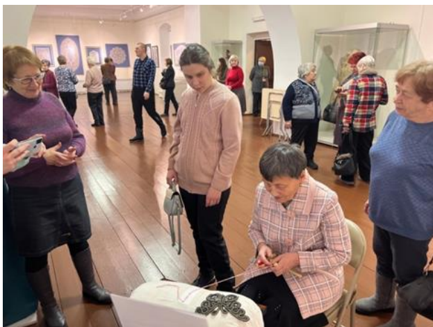
Фото 4. На мастер-классе в Вельском краеведческом музее имени В.Ф. Кулакова

кружевоплетения, показывает богатое разнообразие выразительных средств и художественных образов в кружеве.