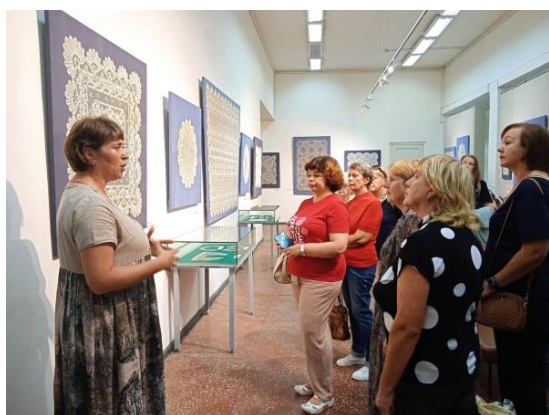
Фото 7. На открытии выставки «Кружево Русского Севера» в Тульском музейном объединении