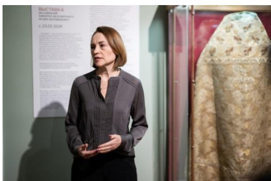
Фото 3. На открытии выставки «Кружево Русского Севера» в Сергиево-Посадском музее-заповеднике

Межрегиональная выставка представляет коллекцию кружевных изделий из фондов Кирилло-Белозерского музея-заповедника, насчитывающей около 600 предметов. Более 100 из них экспонируются в рамках данного проекта. Это большой ряд изделий XVIII–XXI