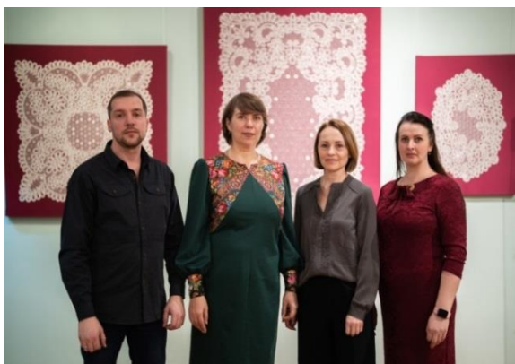
Фото 1. Сотрудники музея на открытии выставки «Кружево Русского Севера» в Сергиево-Посадском музее-заповеднике

В 2024 году Кирилло-Белозерский музей-заповедник отметил свой 100-летний юбилей. В честь этого события в музее были открыты новые экспозиции и выставки не только на своих площадках, но и в залах партнеров. Одним из самых крупных проектов этого года стала межрегиональная выставка «Кружево Русского Севера». Она была представлена в Вельском краеведческом музее имени В.Ф. Кулакова, Белозерском областном краеведческом музее,