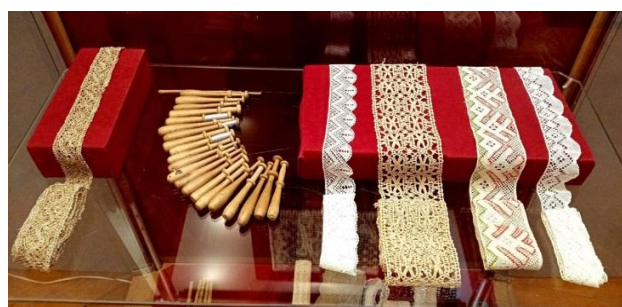
Фото 2. Презентация кружених изделий на выставке «Кружево Русского Севера» в Сергиево-Посадском музее-заповеднике

Выставочный проект посвящен знаменитому, давно заслужившему мировую славу вологодскому кружеву. Вклад в развитие коклюшечного искусства мастериц Вологодчины был настолько значителен, что под названием «вологодское» часто подразумевалось русское кружево вообще.