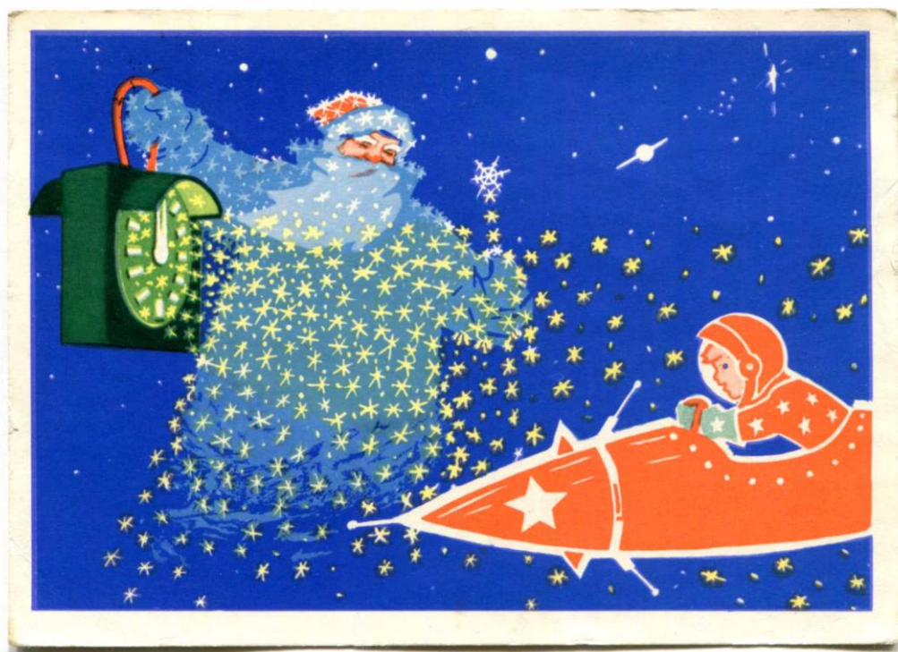
Рис. 2. КП-39602-109 Открытка «С Новым Годом!» 1963 год