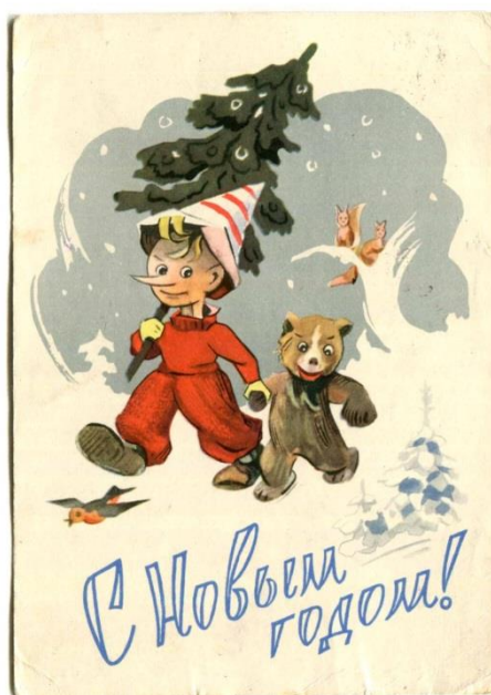
Рис. 7 КП-39602-120 Открытка «С Новым годом!» 1960 год

Появляются разнообразные детские открытки со сказочными персонажами, лесными зверями (Рис. 7). Большое распространение получили открытки с репродукциями картин мастеров живописи, с иллюстрациями художников детских книжек.