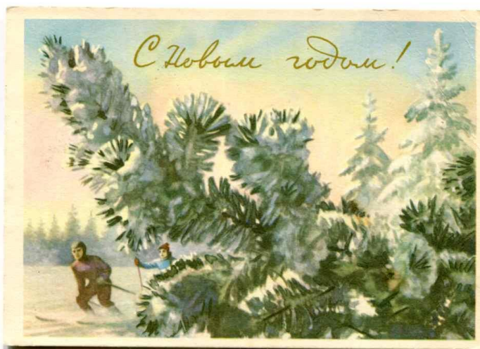
Рис. 4 КП-39602-196 Открытка «С Новым годом» 1960 год

В период 60-х годов появляется тема спорта в открытках. В качестве пропаганды здорового образа жизни на открытках изображается молодежь в спортивной одежде на лыжных прогулках или отдыхающая на природе в лесу (Рис. 4).