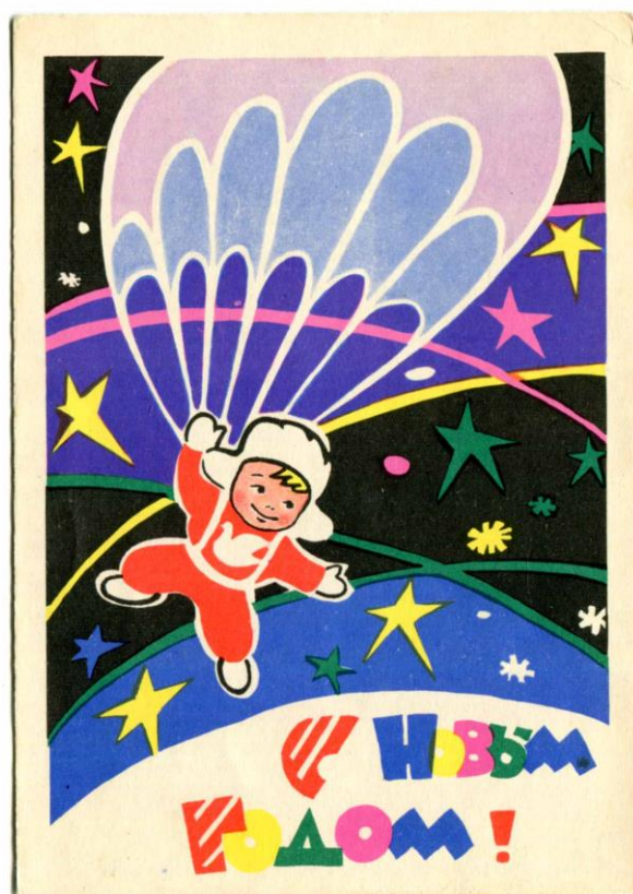
Рис. 3. КП-39602-49 Открытка «С Новым годом!» 1963 год