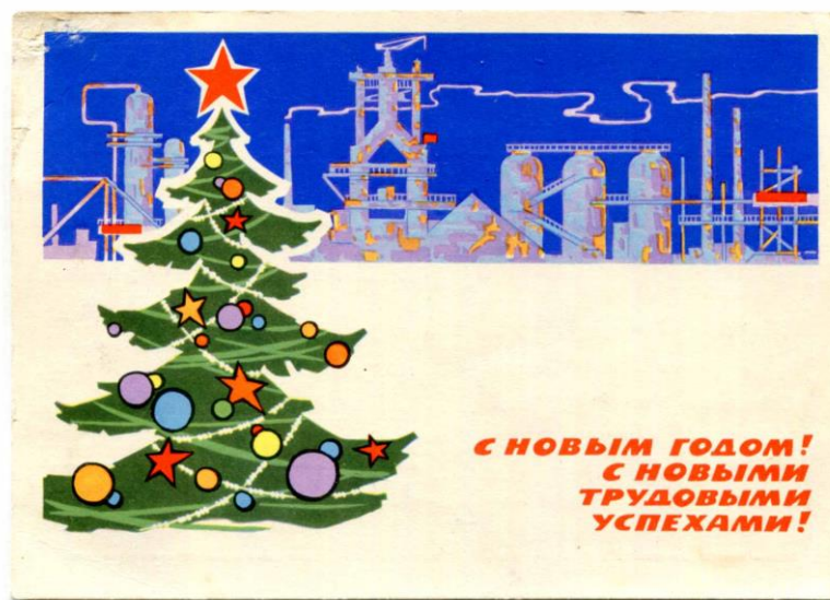
Рис. 6 КП-39602-129 Открытка «С Новым годом! С Новыми трудовыми успехами!» 1962 год

Встречаются сюжеты со стройкой, многоквартирными домами для «счастливых советских семей», также пропагандируются достижения научно-технического прогресса (Рис. 6).