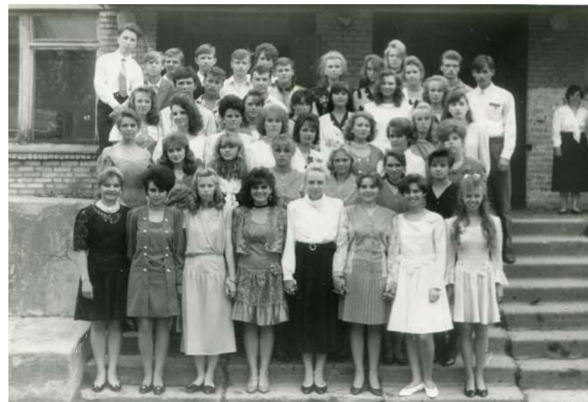
Выпускники Кирилловской средней школы, 1995 год