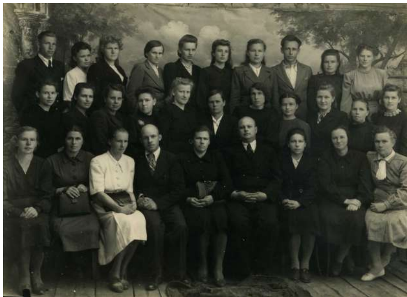
Учителя Кирилловской средней школы, 1947 год