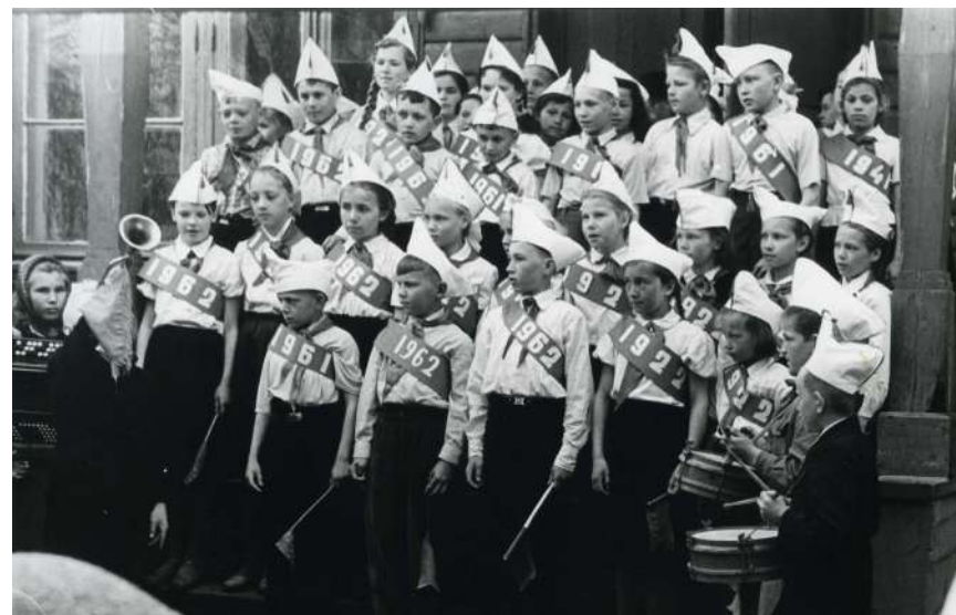
Сорокалетие пионерской организации в г. Кириллове. 19 мая 1962 года