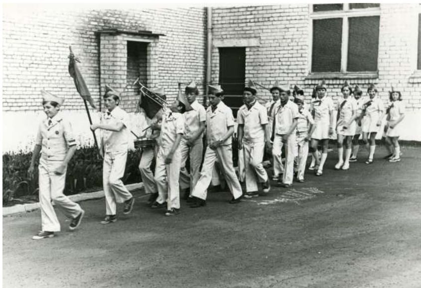
Юнармейцы Кирилловской средней школы – победители районного финала «Зарница», май 1982 года

Кадетское движение продолжает традиции, которые складывались столетиями. В современной России появилось такое нововведение не так давно – в 2014/2015 учебном году к 70-й годовщине Великой Победы постепенно в городах стали открываться профильные классы военной