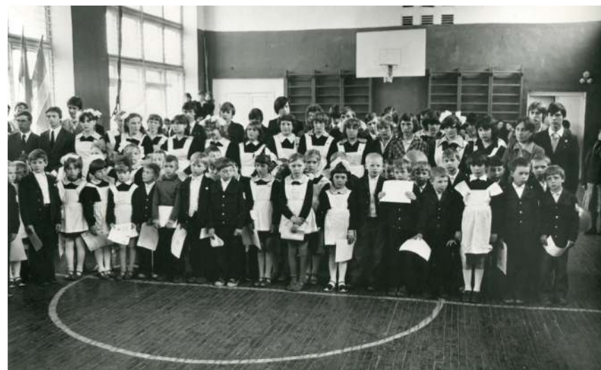
На торжественной линейке в Кирилловской средней школе, 1982 год