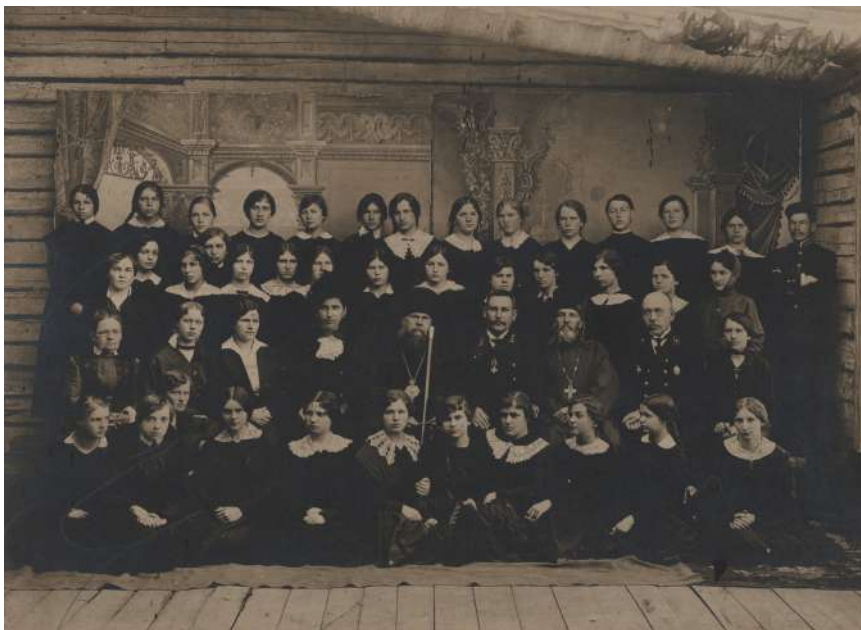
Преподаватели и ученицы Кирилловской женской гимназии, 1916

В 1897 году в Кириллове открыли женскую прогимназию – общеобразовательное учреждение с программой четырех младших классов гимназии. Прогимназия имела право принимать экзамены на звание учителя начальной школы и первый классный чин. В 1907 году Кирилловская женская прогимназия была преобразована в гимназию. Это учебное заведение стало первым средним учебным заведением в городе. В гимназии обучались девочки со всего Кирилловского уезда. Однако далеко не всем детям была доступна учеба. Обучение в гимназии было платным: в 1–4 классах плата составляла 15 рублей в год, в 5 и 6 классах – 20 рублей, а в 7 и 8 классах – 40 рублей в год. Желающие заниматься музыкой и иностранными языками могли брать дополнительные платные уроки.