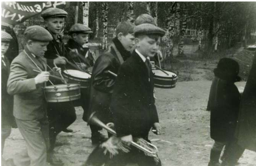
Школьники на Первомайской демонстрации. 1 мая 1968 года

Предусматривалось создание средних общеобразовательных трудовых политехнических школ с производственным обучением. В 1961 году было заявлено о необходимости всеобщего среднего образования.