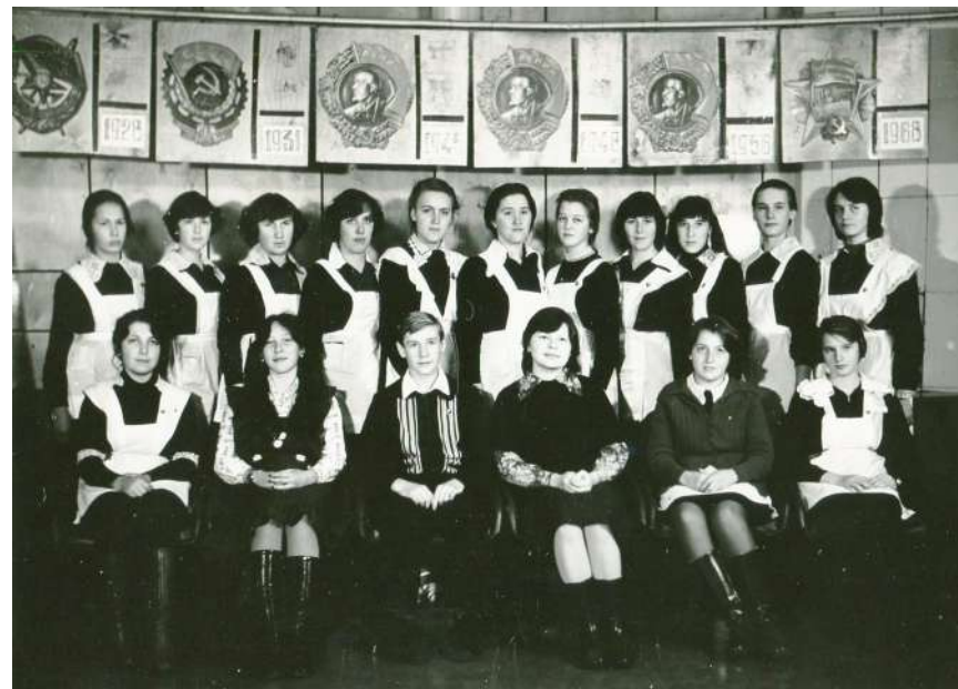
Делегация Кирилловской средней школы на XXXIV районной отчетно-выборной комсомольской конференции, 1979 год

Металл, эмаль, штамповка 20х22х5 мм КП-17359 Н-1265