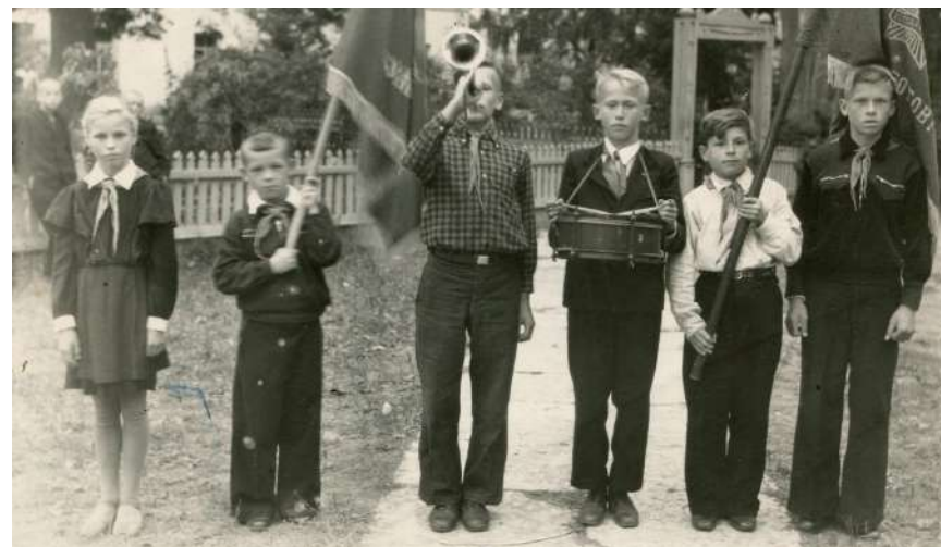
Пионеры. 1950-е годы