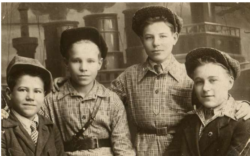
Группа юношей, принятых в комсомол. 1932–1933 годы

После Октябрьской революции все учебные заведения были переданы в ведение Народного комиссариата просвещения (Наркомпроса). На основе декретов СНК РСФСР все общеобразовательные школы стали общенародными, школа отделялась от церкви, были введены бесплатное обучение, совместное обучение детей обоего пола, существование частных школ запрещено, отменялись физические наказания детей; все национальности получили право обучения на родном языке. В октябре 1918 года СНК опубликовал «Положение о единой трудовой школе РСФСР» в соответствии с которым создавалась единая трудовая 9-летняя школа, состоящая из 2 ступеней, обязательная для детей и подростков в возрасте 8–17 лет. Декрет от 26 декабря 1919 года «О ликвидации безграмотности среди населения РСФСР» предписывал массовое обучение неграмотных. В 1920 году при Наркомпросе была образована Всероссийская чрезвычайная комиссия по ликвидации безграмотности, руководившая всей работой в этом направлении.