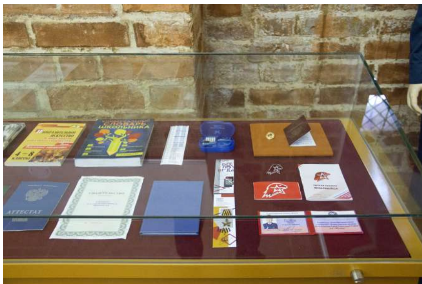
Ученические принадлежности и документы об окончании учебных заведений Конец XX – начало XXI века

стали называть участников военно-спортивной игры «Зарница», а также подростков, изучающих в общественных организациях специальности, связанные с военным делом. С этого времени в школах начали создавать юнармейские отряды, готовить символы и атрибуты. Игра вызвала живой интерес у пионеров и школьников. «Зарница» была элементом начальной военной подготовки, которая в те времена была обязательным предметом школьной программы.