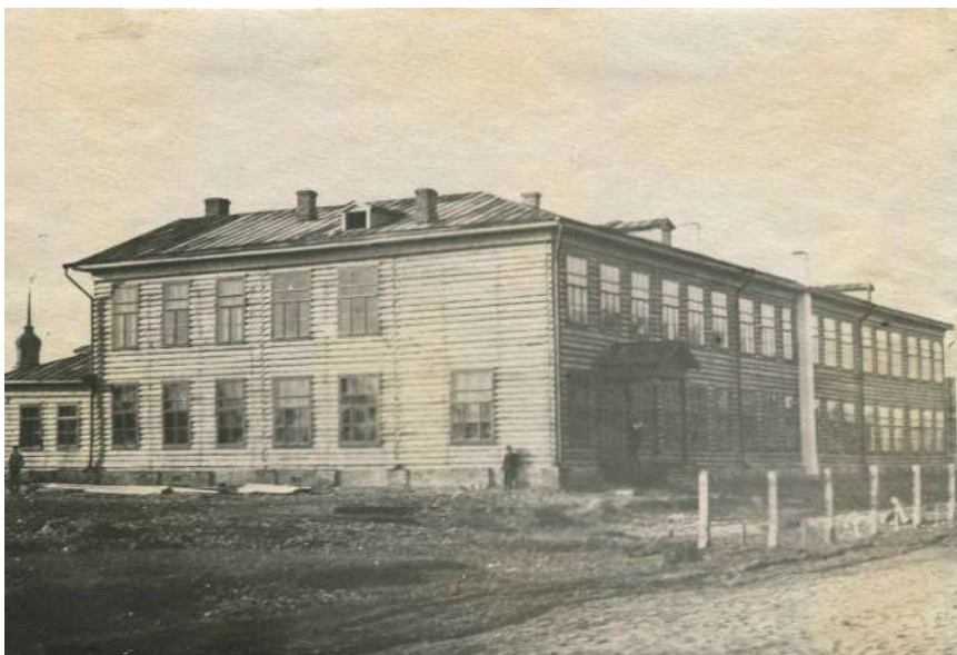
Кириллов, средняя школа города, 1950 год

Война затормозила осуществление всеобщего семилетнего обязательного обучения, хотя правительство принимало меры по восстановлению и расширению школьной сети. С начала 1943 года при некоторых школах и детских домах стали открываться учебно-производственные мастерские. С целью выявления фактических знаний и прочности их усвоения были утверждены годовые проверочные и выпускные испытания, предназначенные для обучающихся с четвертого класса, «Правила для учащихся» и введена цифровая пятибалльная система.