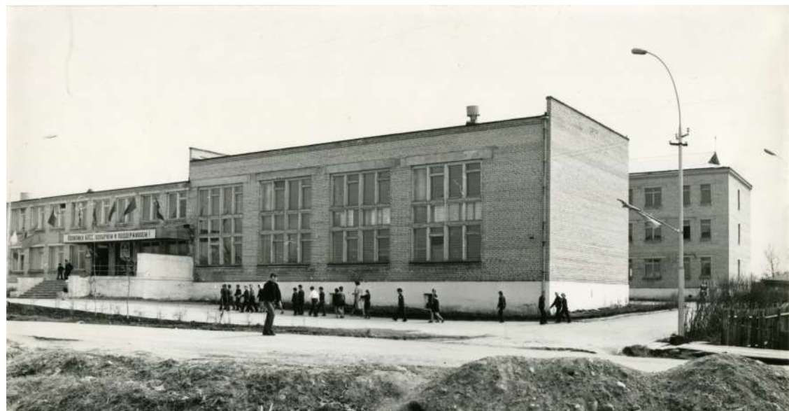
Здание Кирилловской средней школы, 1980-е годы

результате новой реформы вводится 11-летнее образование со сдвигом всех классов, начиная с четвертого, на год вперед.