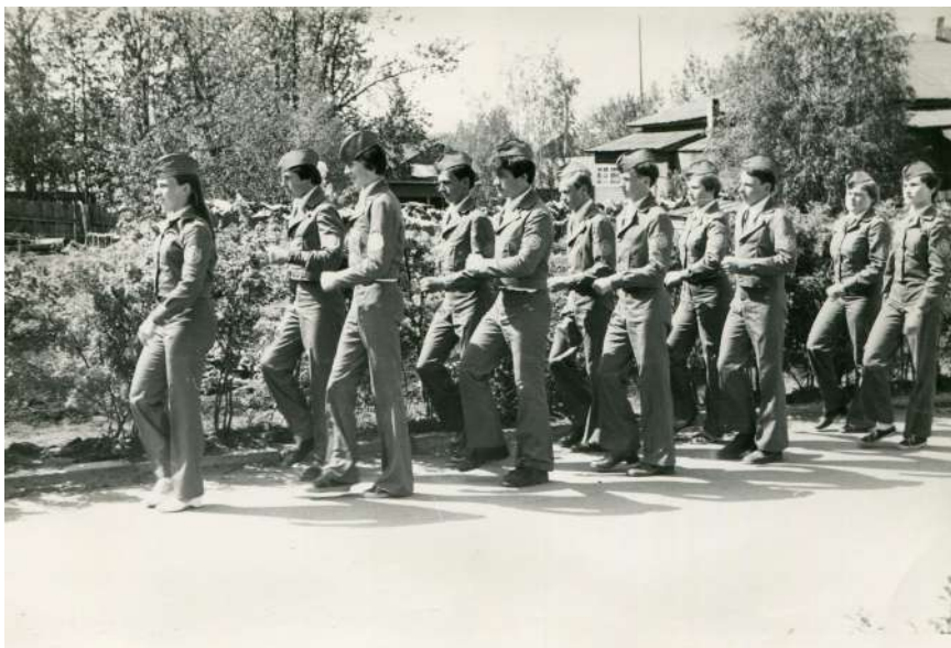
Участники военно-спортивной игры «Зарница», 1979 – 1980 годы