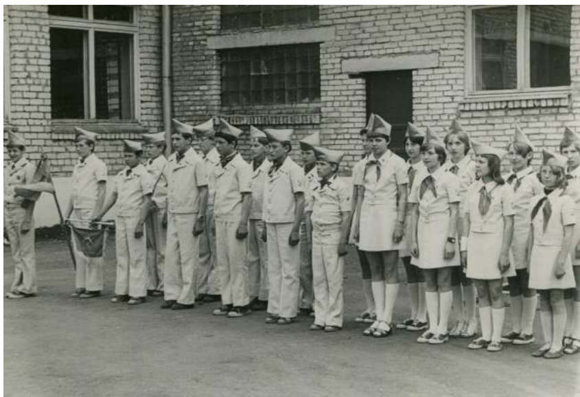
Юнармейцы Кирилловской средней школы – победители районного финала «Зарница», май 1982 года