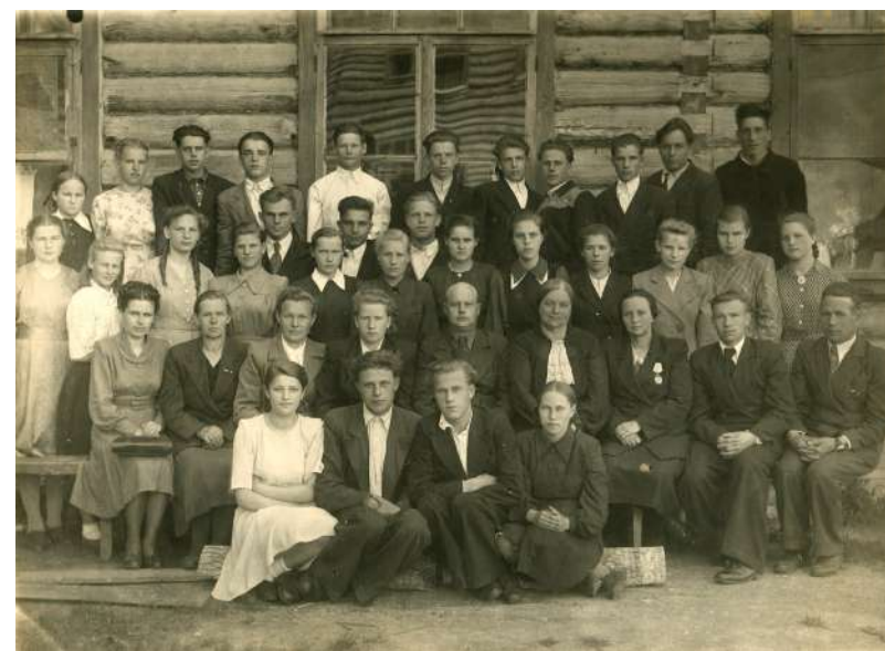
Учителя Кирилловской средней школы, 1947 год