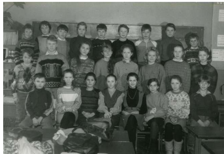
Ученики Кирилловской средней школы, 1995 – 1996 годы

Дерево, краска, столярная работа, окраска 75,5х41,0х37,0 см КП-37662 Д-3841