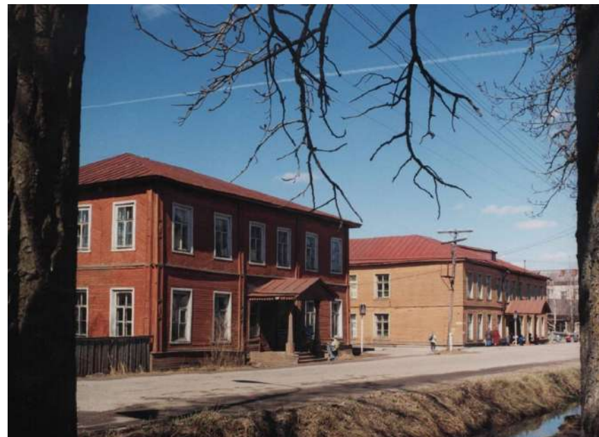
Здание женской гимназии (первое слева). Фото начала 2000-х годов

В 1912 году было открыто реальное училище благодаря щедрому пожертвованию купца Петра Алексеевича Симонова, которое просуществовало до 1918 года.