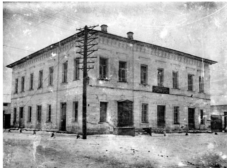
Кирилловская средняя школа. 1950 год

Для молодежи, занятой в промышленности или сельском хозяйстве, организовывались школы рабочей и сельской молодежи. С 1944/45 учебного года было установлено обязательное обучение детей с семилетнего возраста. После окончания войны основными задачами в области просвещения были восстановление и укрепление общеобразовательной школы, введение всеобщего обучения.