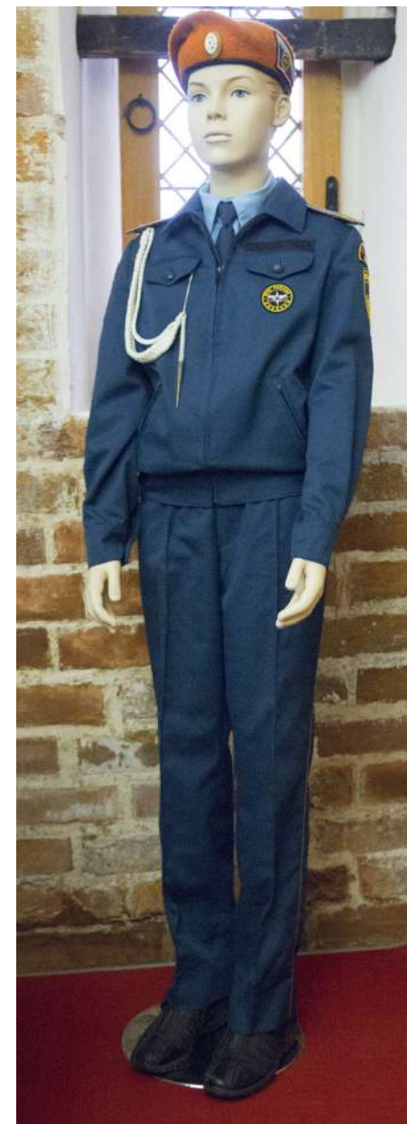
Комплект кадетской формы →

В нашем городе кадетский класс Кирилловской средней школы принял кадет 1 сентября 2015 года, Горицкой школы – в 2020 году. Сегодня в двух школах района получают образование 307 кадет в 13 классах под ведомством МЧС и ОМВД. Кадеты придерживаются определенного распорядка дня и носят специальную форму – оранжевый берет, рубашку и галстук, китель с аксельбантами, брюки или юбки, так как кадеты не только мальчишки, но и девчонки. Кроме общих предметов в учебной программе кадет есть обязательные дополнительные занятия – хоровое пение, хореография, финансовая грамотность, строевая подготовка, скалолазание, стрельба, много внимания уделяется истории России, ее памятным датам и событиям.