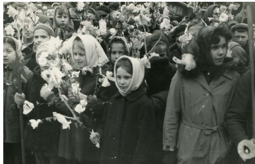
Школьники на Первомайской демонстрации 1 мая 1968 года