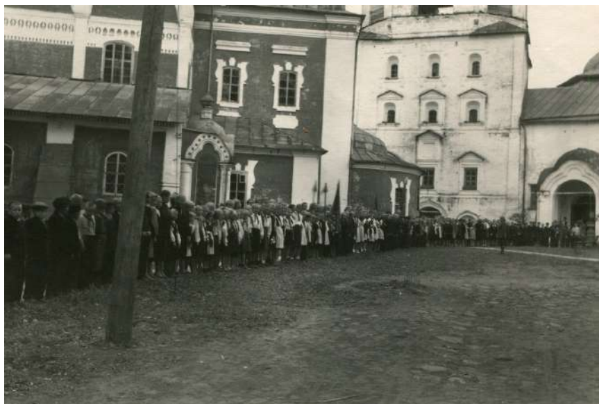
Пионерский сбор, посвященный новому учебному году. 1955 год

Дерево, заводское производство 35,0х1,5х1,5 см; 35,3х1,5х1,5 см КП-29632/2-3 Д-2918/2-3