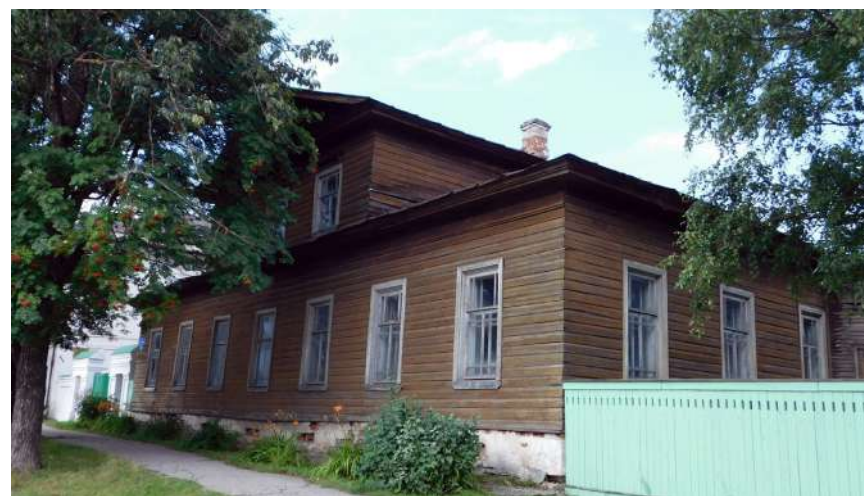
Здание приходского училища для девочек. Фото 2000-х годов