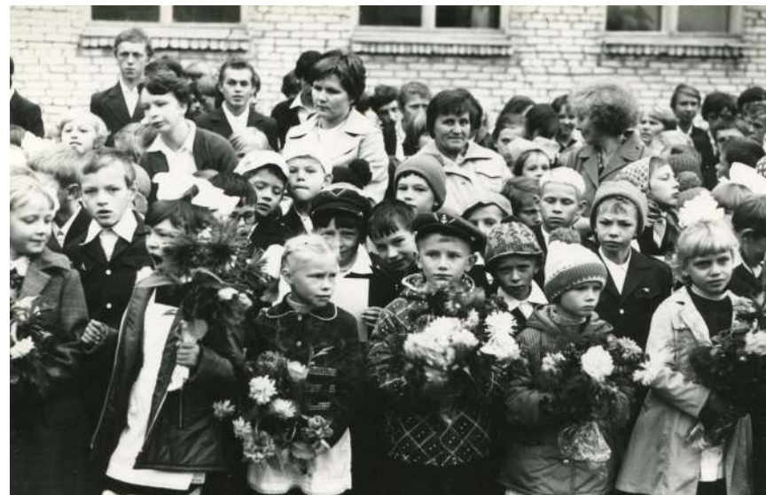
На торжественной линейке в Кирилловской средней школе, 1980-е годы