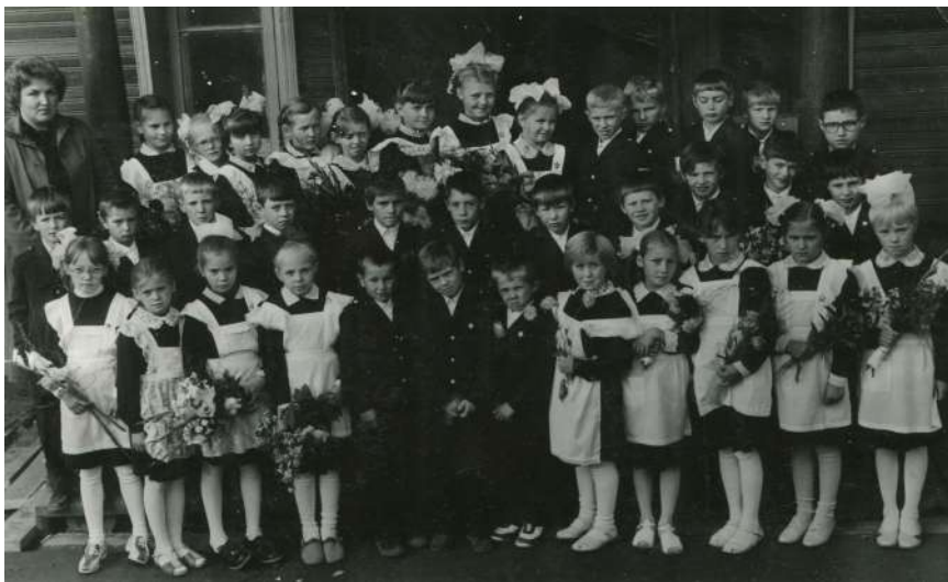
Последний звонок 3 «Г» класса, 1987 год