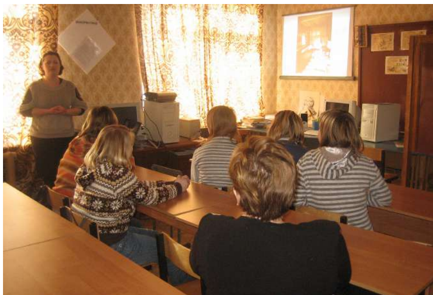
Урок в с. Талицы. 2009 год

подготовки, находящиеся в ведении различных федеральных министерств и ведомств (Минобороны, Росгвардии, МВД, ФСБ, МЧС, Следственного комитета, Минкультуры, а также Минпросвещения).