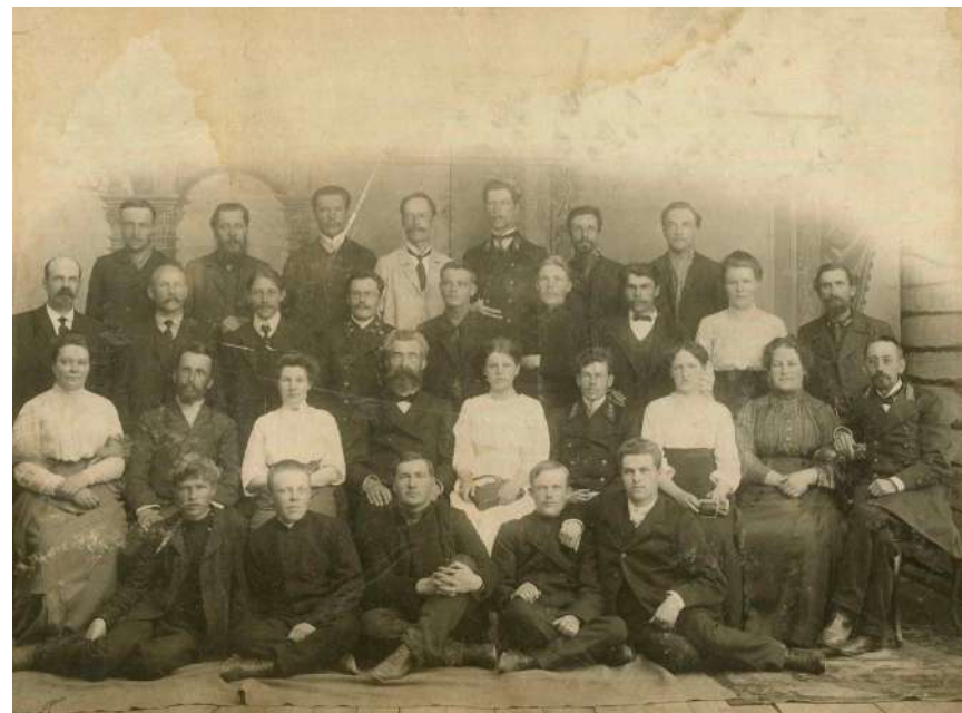
Преподаватели Кирилловского реального училища, 1910-е годы