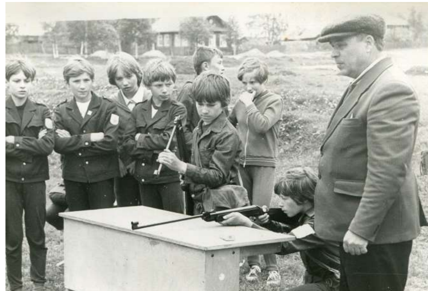
Ученики 4 «а» класса во время подготовки к военно-спортивной игре «Зарница», 1980 – 1981 годы