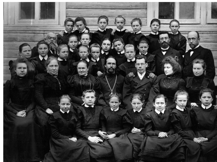
Преподаватели и ученицы Кирилловской женской прогимназии, 1901

В самом городе существовало несколько учебных заведений. В 1878 году было открыто городское училище (после реорганизации уездного училища, открытого еще в 1805 году), которое обеспечивало детям всех сословий получение начального умственного и религиозно-нравственного образования. Численность классов достигала 30–35 человек. Обучение