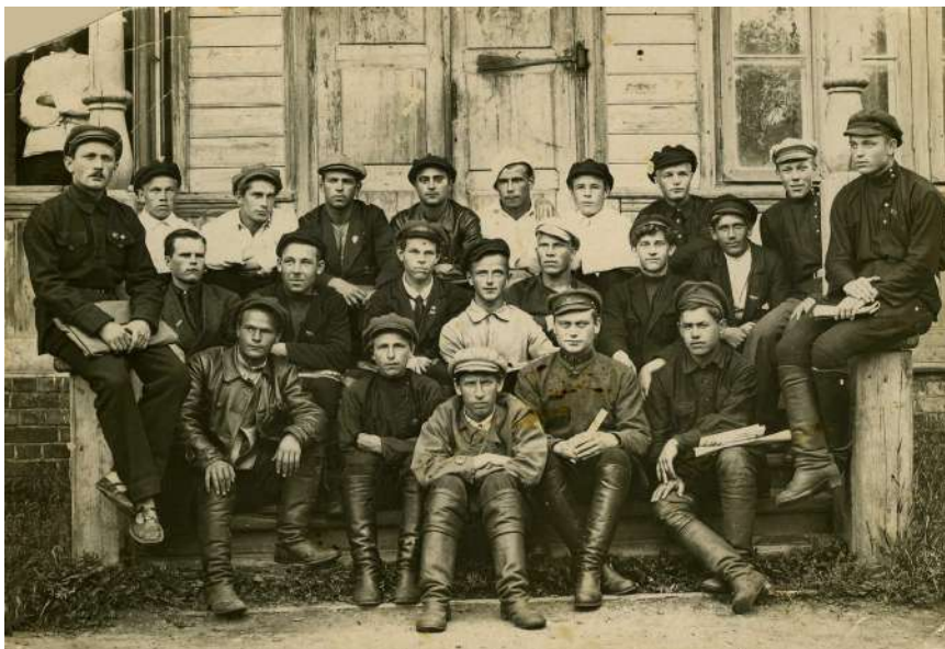
Комсомольский актив города Кириллова. 1924 год

которых устраивались школьные манифестации, чтения, беседы, лекции, собрания, митинги, спектакли, субботники. К 1932 году в Кириллове и районе было успешно завершено проведение четырехлетнего всеобщего и взят курс на осуществление семилетнего и частично десятилетнего обучения. К 1933 году в районе действовало 205 комплектов школ, в которых обучались 7151 ученик.