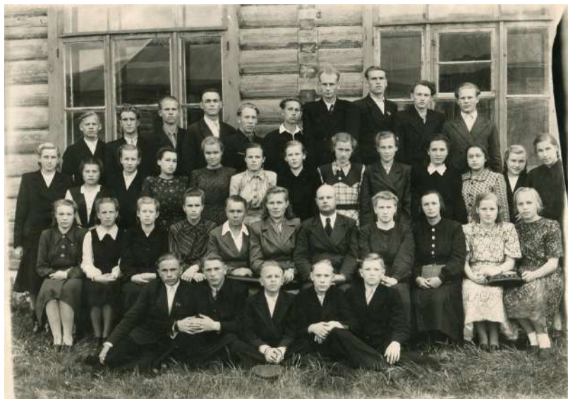
Учителя и выпускники 10 класса Кирилловской средней школы. 1951–1952 годы