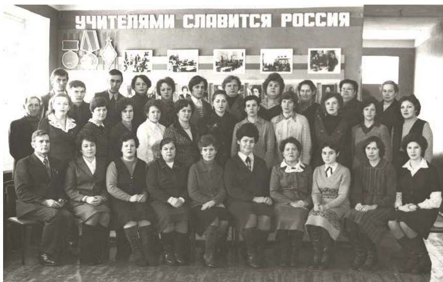
Педагогический коллектив Кирилловской средней школы, 1980-е годы

Всеобщий и обязательный характер полного среднего образования был закреплен в Конституции 1977 года. Появились новые типы воспитательно-образовательных учреждений, значительно повысилось число полных средних школ. В первой половине 1980-х годов появляется тенденция профессионализации общеобразовательной школы. В 1984 году были приняты «Основные направления реформы общеобразовательной и профессиональной школы». Согласно реформе, школа становится одиннадцатилетней, обучение детей предполагалось начинать с шестилетнего возраста, продолжительность учебы в начальной школе стала четырехлетней (с 1 по 4 класс), большое внимание уделялось трудовому обучению школьников. В 1986 году в