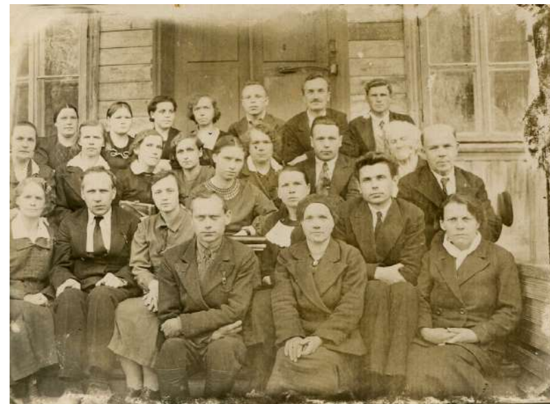
Коллектив Кирилловской средней школы в 1939–1940 учебном году