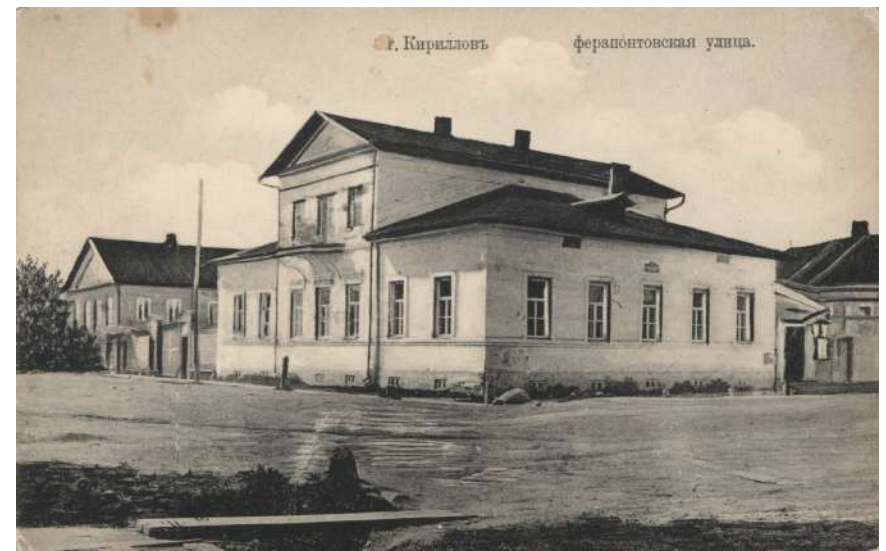
Здание реального училища. Открытка начала XX века

Приходские училища с одногодичным курсом обучения могли учреждаться во всех городских и сельских приходах. Содержались они на местные средства и находились в ведении смотрителей уездных училищ. Начальные школы предназначались для самых низших сословий. Уездные училища с двухгодичным сроком обучения создавались в губернских и уездных городах. Хотя они предназначались для людей всех сословий, но предпочтение отдавалось сыновьям купцов, ремесленников и других городских обывателей. Уездные училища содержались за счет