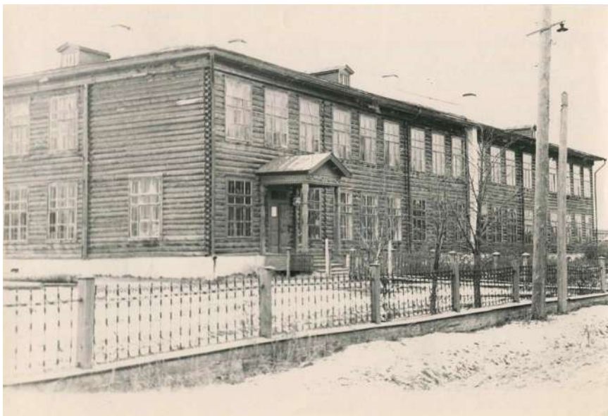
Кирилловская средняя школа (ул. Гагарина, 91). 1963 год