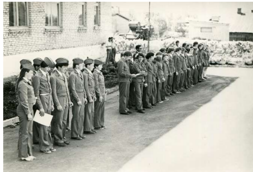
Участники военно-спортивной игры «Зарница», 1979 – 1980 годы