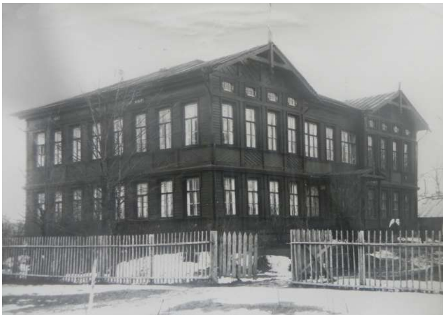
Здание городского училища. Фото 1950-х годов

было платным. В учебные планы входили Закон Божий, русский язык с элементами церковнославянского, арифметика, начала географии, истории, естествоведения, рисование и черчение.