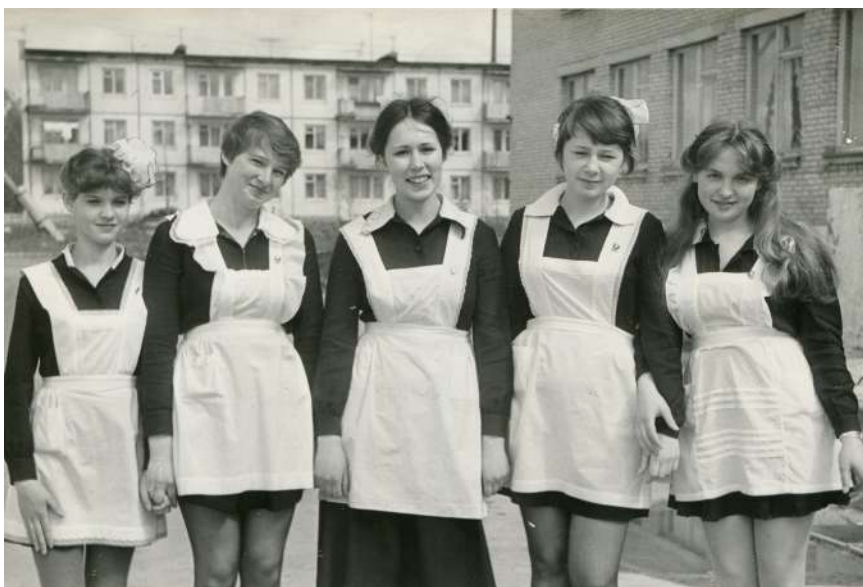
Ученицы Кирилловской средней школы. Начало 1980-х годов