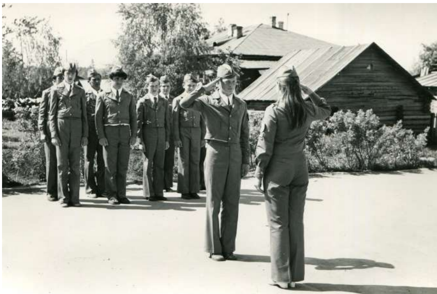
Участники военно-спортивной игры «Зарница», 1979 – 1980 годы