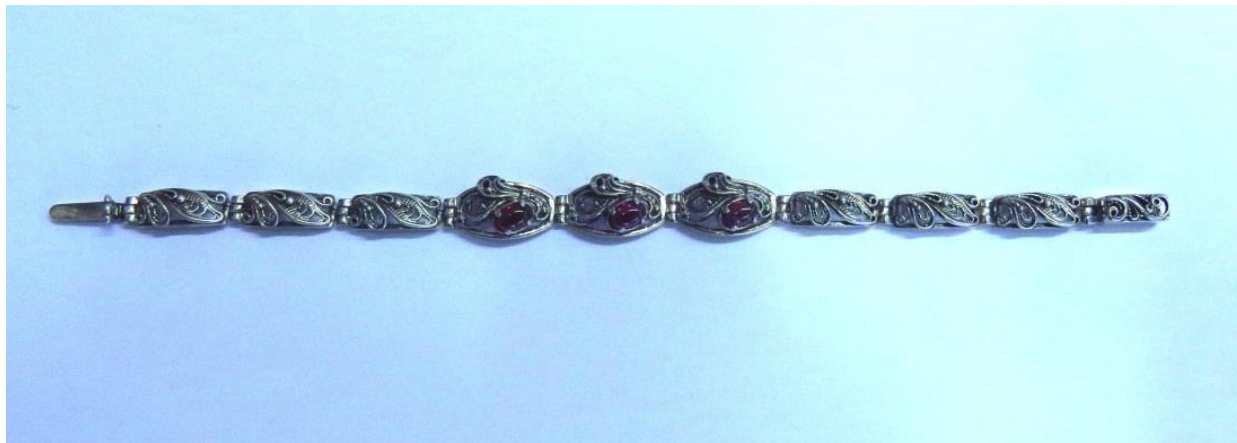
Фото 4. Браслет Г.И. Мериничева после реконструкции

Браслет, сделанный Г.И. Мериничевым почти полтора века назад, является свидетельством таланта и высокого мастерства его создателя. Он имеет изящную форму и удобно «ложится» на руку. Металлическое кружево его поверхности создает иллюзию легкости и воздушности изделия. Темный, почти черный цвет оксидированного серебра гармонично сочетается с таинственной игрой света внутри камней.