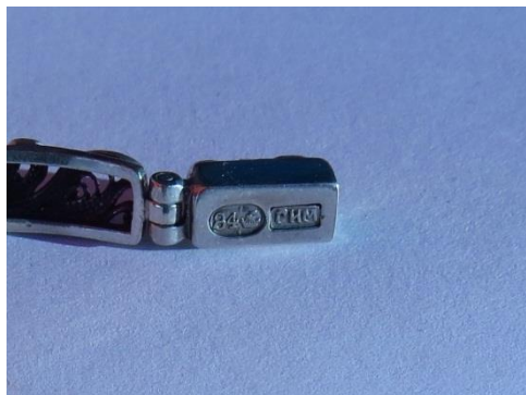
Фото 1 Клеймо и именник на замочке браслета

Вероятно, браслет состоял из девяти звеньев (трех центральных и шести боковых) и замка. В этой комбинации длина браслета в собранном виде и с запертым замком составляла бы примерно 180 миллиметров, что является средним размером для женских браслетов.