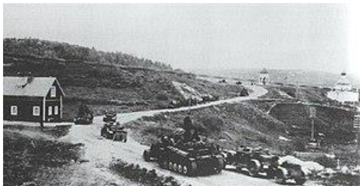
Фото 1. Немецкие войска движутся на мурманском направлении, июль 1941 года.

Для большинства посетителей музея Евгения Преображенского наш земляк известен прежде всего, своим главным подвигом – полетами на Берлин. Но в музее можно познакомиться и с другими, не менее героическими страницами военной биографии Евгения Николаевича. Так уж было суждено, что жизненный путь Е. Н. Преображенского был связан с военным делом, он принимал участие в трех войнах, служил на трех флотах.