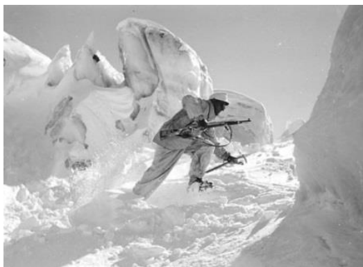
Фото 2. Немецкий воин 2-й горно-стрелковой дивизии

соединяющая Колу с центральными регионами страны, главная военно-морская база Северного флота – город Полярный, на Кольском полуострове производились разработки медно-никелевой руды и апатитов, рядом Воркутинские угольные месторождения. Гитлер рассчитывал захватить советский север в короткий срок (фото 1).