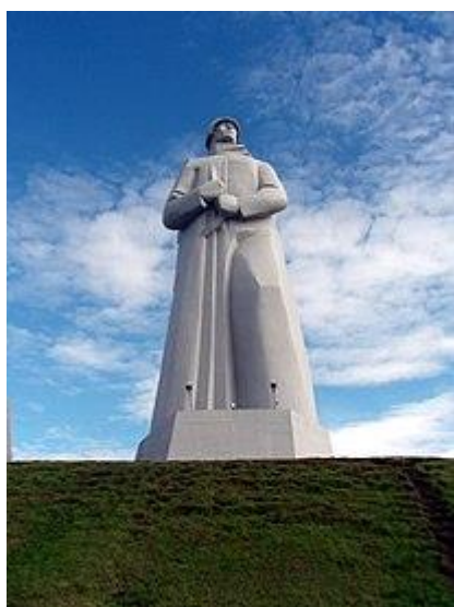
Фото5. Мемориал «Защитникам Советского Заполярья». https://ru.wikipedia.org/wiki/

В память об этих героических днях в городе Мурманск возвышается «Алёша» – мемориал «Защитникам