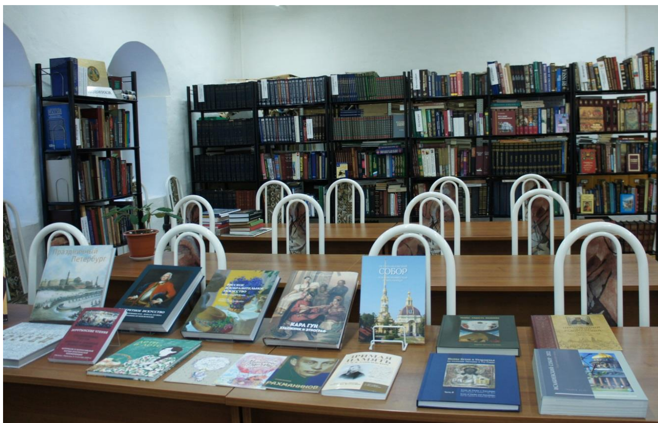
Фото 5. Читальный зал научной библиотеки Кирилло-Белозерского музея-заповедника 2024 год.