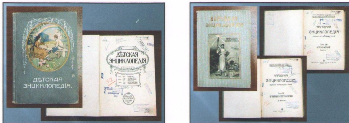
Фото 3. Дореволюционные издания

Особое место в фонде занимают издания краеведческой тематики и дореволюционные издания по истории, православию, искусству, энциклопедические словари и справочники (фото 3.). Они принадлежали разным библиотекам города Кириллова и Кирилловского уезда, в советское время были переданы в музей.