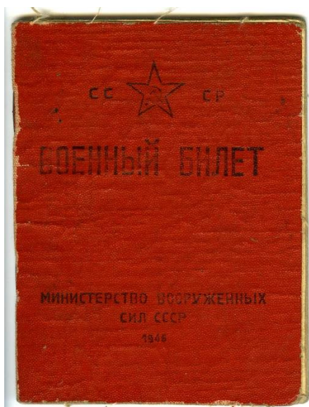
Фото 3. Военный билет Серия Ю № 130925 Василия Михайловича Абакшина.