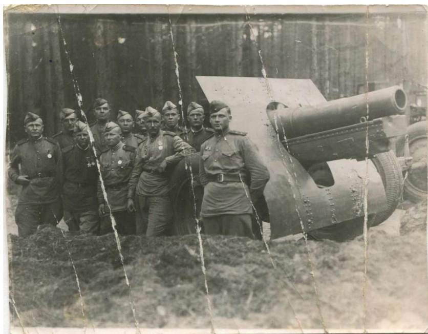
Фото 6. «Группа военнослужащих около артиллерийского орудия» 1943-1945 годы