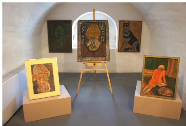
Фото 2. Фрагменты выставки «Монохроники»