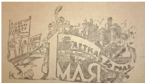
Фото 2. Иллюстрация из газеты «Красный Север» № 100 от 01.05.1932 года