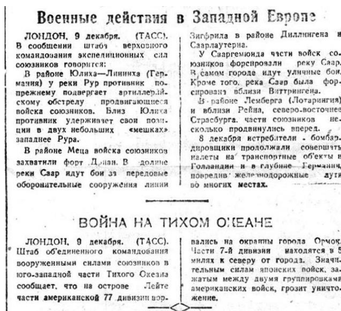
Фото 3. Вырезка из газеты «Красный Север» № 242 от 10.12.1944 года