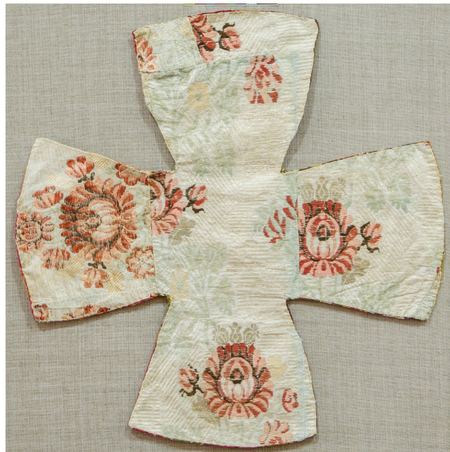
Кат. 38. Покровец

40. Поруч Первая половина XIX века Шелк, коленкор, позумент, парча, блестки, нити шелковые, шитье, вышивка (?) 13,0×27,0 см КБИАХМ КП-1692/1 ЦТ-655/1