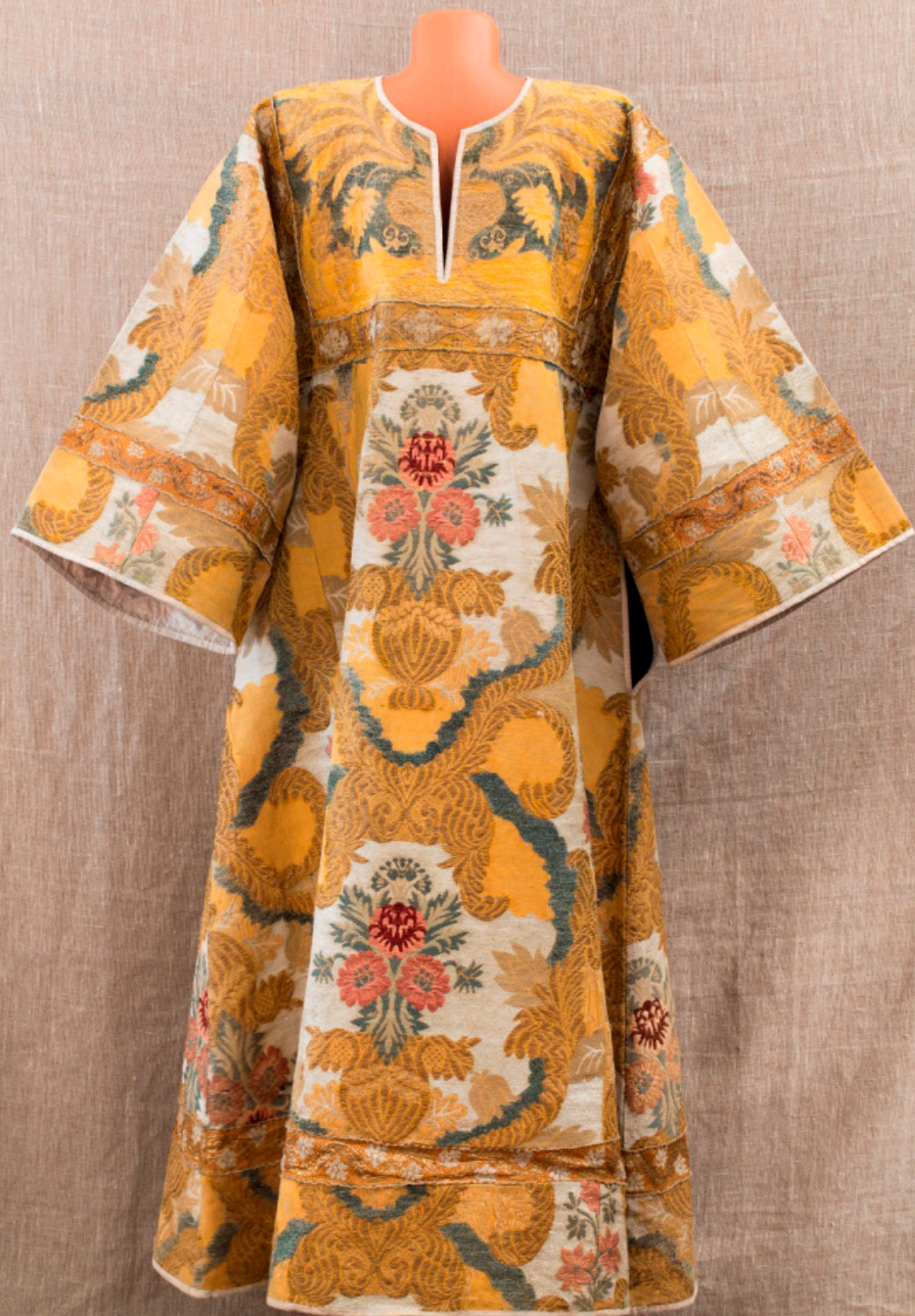
Кат. 36. Стихарь →