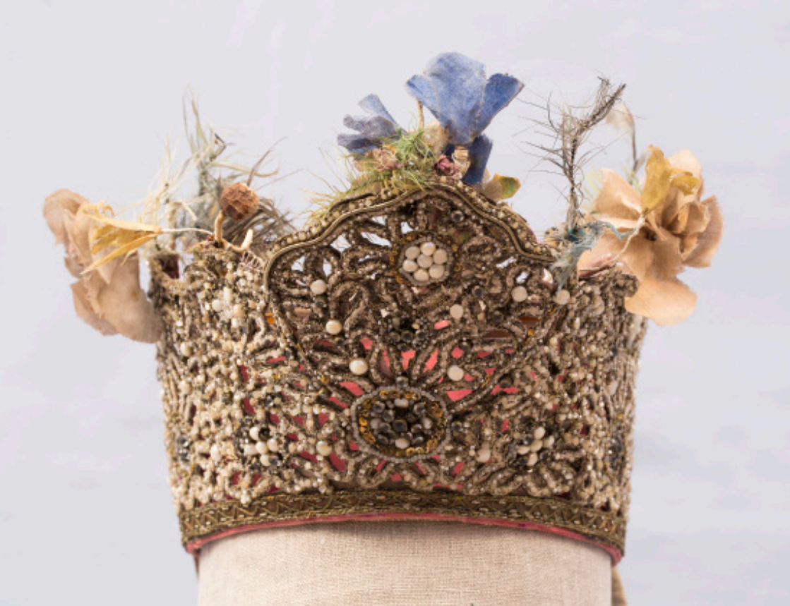
Кат. 2. Коруна после реставрации

1. Платок Последняя четверть XIX века Шелк, ткачество, набойка 80,5×77,0 см КБИАХМ КП-1430 НТ-8