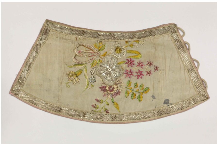
Кат. 40. Поруч до реставрации