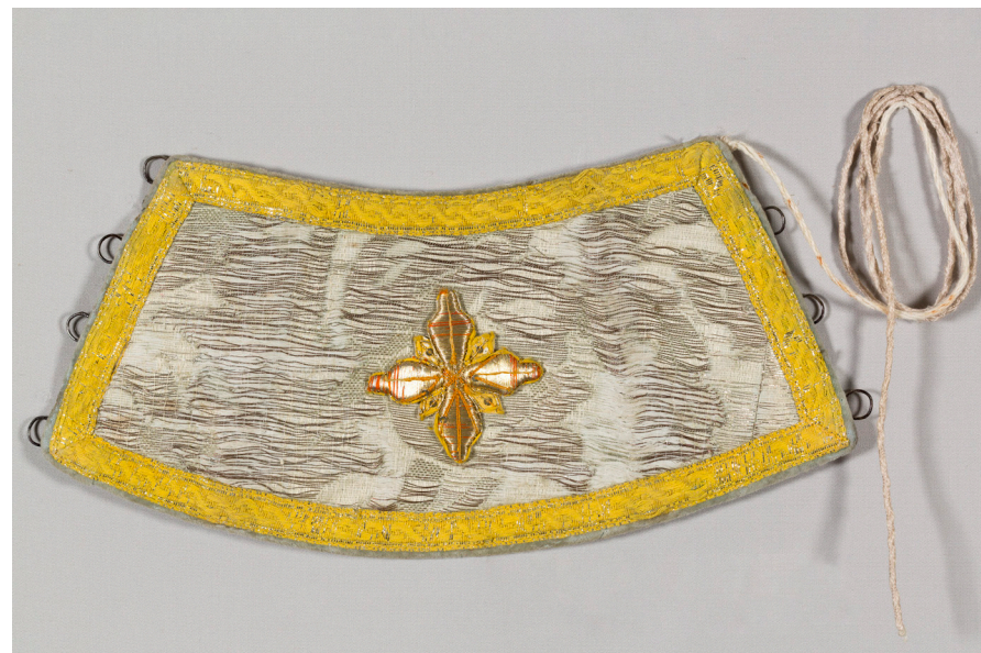
← Кат. 42. Орарь до и после реставрации