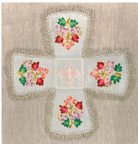
Кат. 33. Покровец

32. Воздух Конец XIX века Атлас, коленкор, бахрома, нити шелковые, нити х/б, шитье, вышивка «тамбур» 72,0×49,0 см (с бахромой); 67,5×44,0 см (без бахромы) КБИАХМ КП-636 ЦТ-49