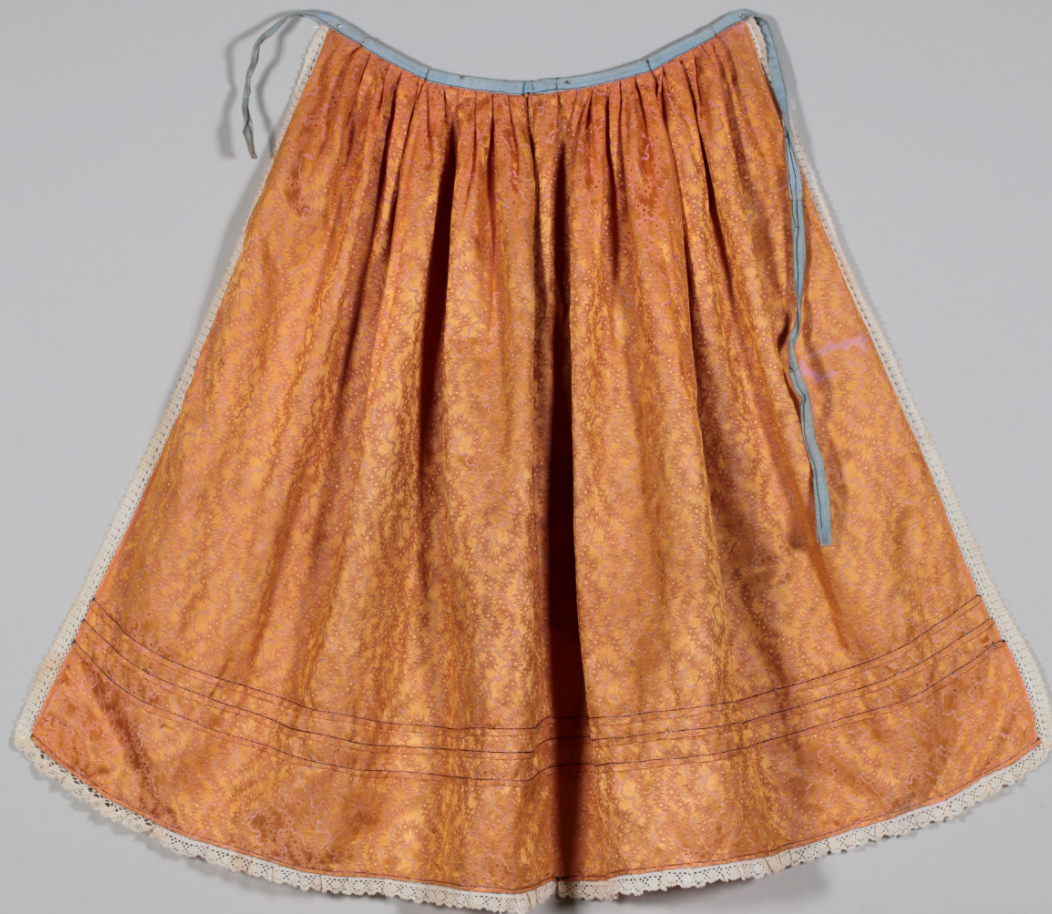
Кат. 16. Фартук →