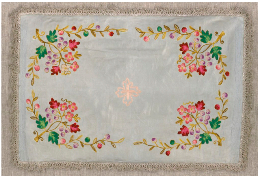
Кат. 32. Воздух