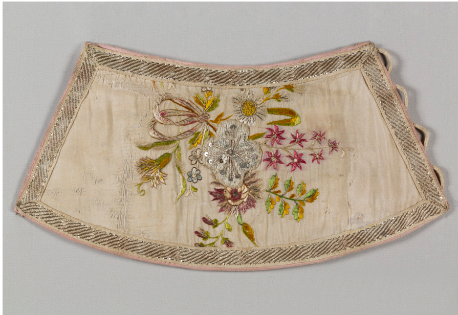
Кат. 40. Поруч после реставрации