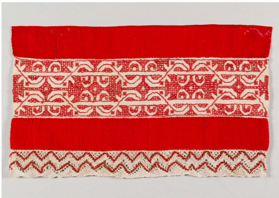
Кат. 9. Конец к полотенцу