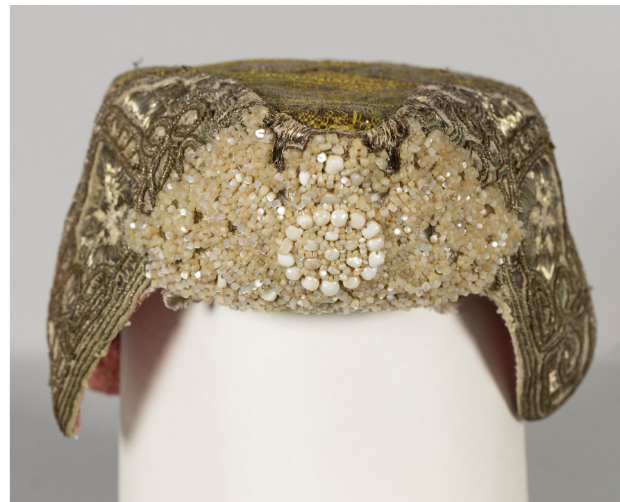
Кат. 4. Кокошник

7. Вставка кружевная 1930-1960-е годы Нити х/б, плетение на коклюшках 25,5×23,5 см КБИАХМ КП-5876 НТ-992