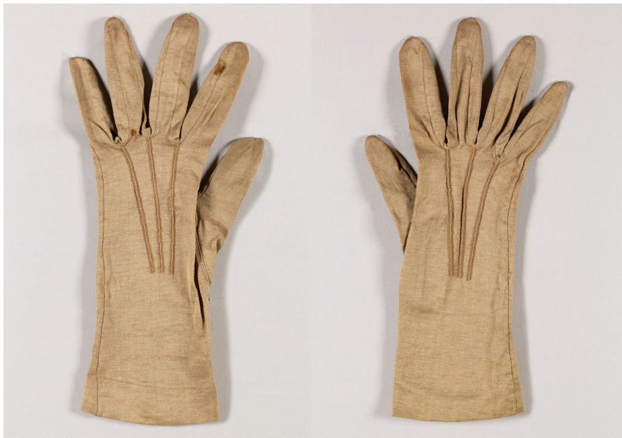
Кат. 23, 24. Перчатки женские