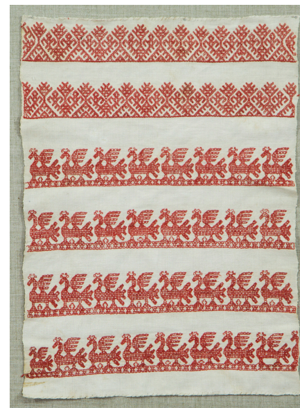
Кат. 5. Конец к полотенцу после реставрации

8. Сарафан Середина XX века Шелк, коленкор, сатин, ситец, холст, кружево фабричное, металл, ткачество, шитье Длина 104,0 см КБИАХМ КП-6283 НТ-1143