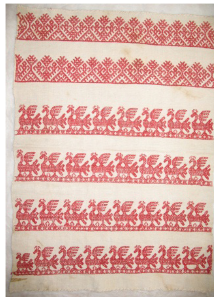
Кат. 5. Конец к полотенцу до реставрации