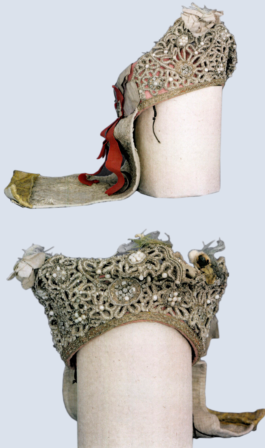
Кат. 2. Корона до реставрации →

Выставка «Продолжение традиций» будет работать до 2 сентября 2023 года.