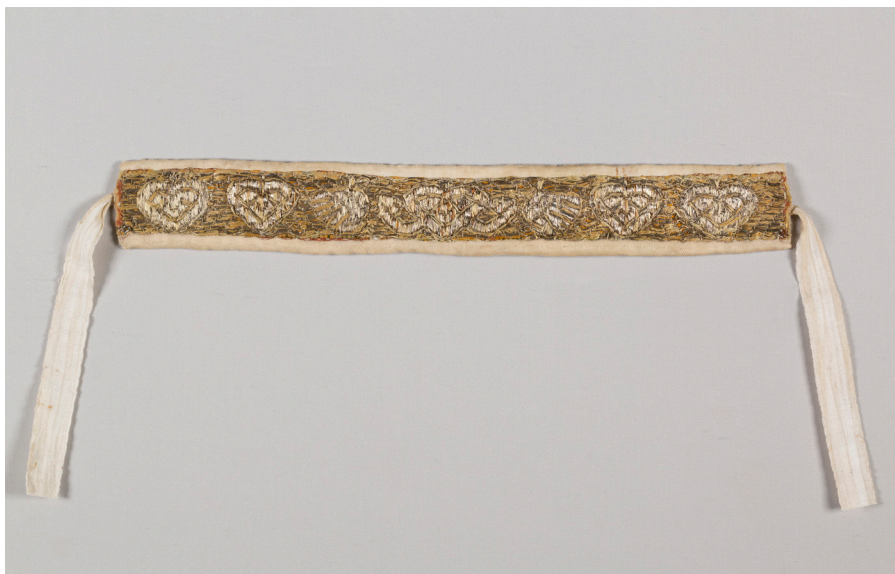
Кат. 12. Наборочник