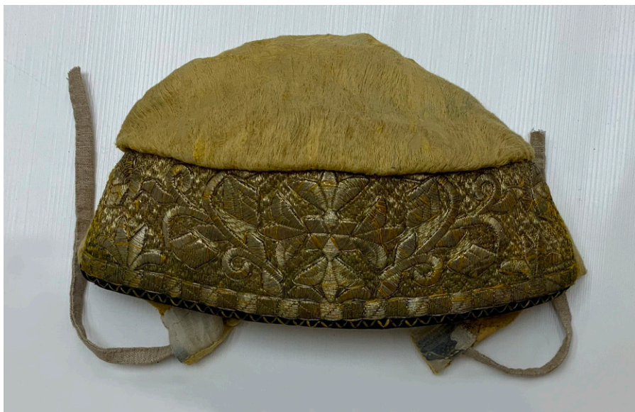
Кат. 22. Борушка