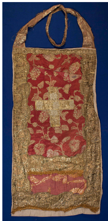
Кат. 37. Набедренник до реставрации