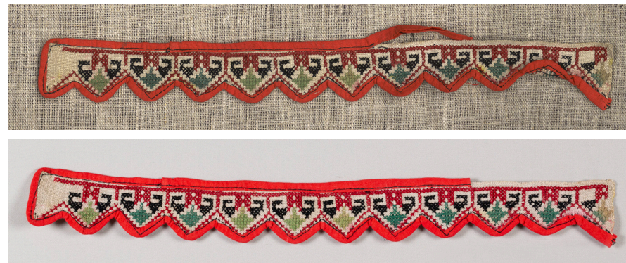
Кат. 20. Край к полотенцу до и после реставрации

25. Полотенце Конец XIX – начало XX века Холст, ткань х/б, нити, нити х/б, ткачество домашнее, вышивка «крестом», вышивка «полукрест» 197,0×35,5 см КБИАХМ КП-25023 НТ-2993