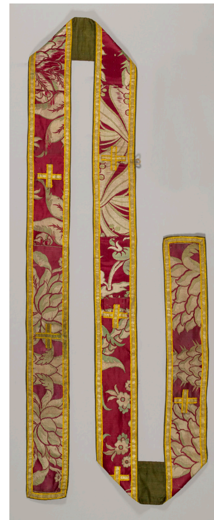
Кат. 34. Орарь

39. Стихарь XVII–XIX века (средник – XVII век) Бархат, парча, глазет, коленкор, позумент, металл, нити металлические, блески, канитель,