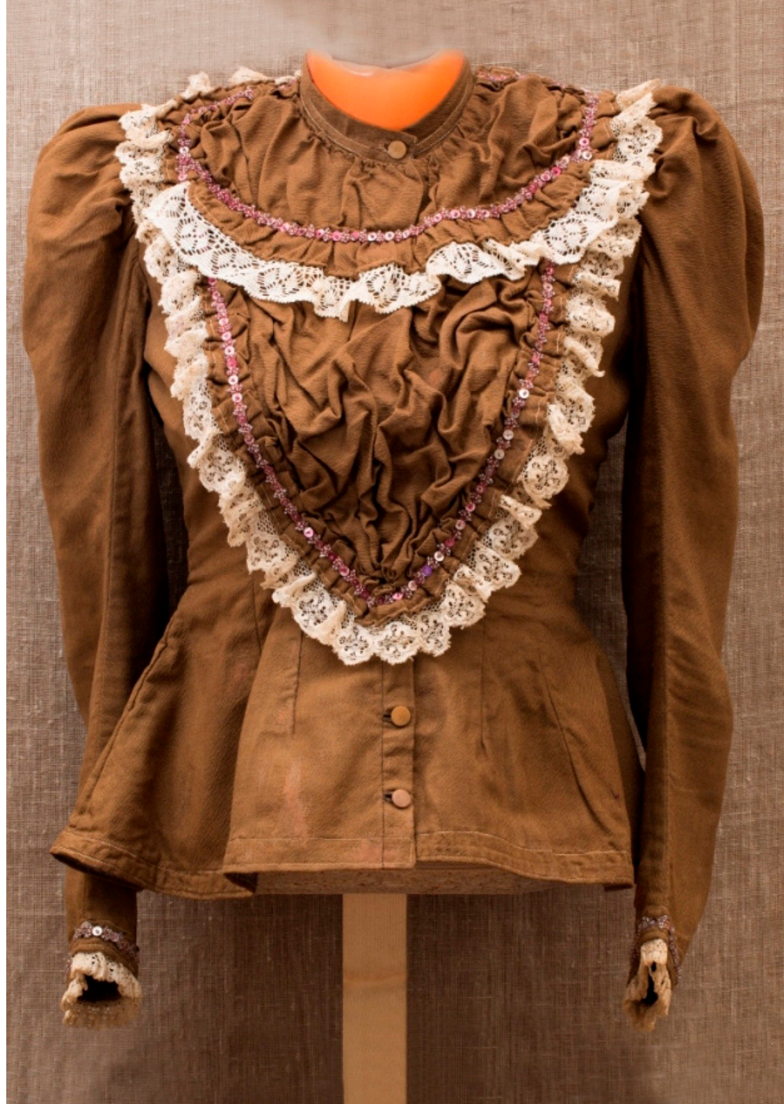
Кат. 10. Казачок →