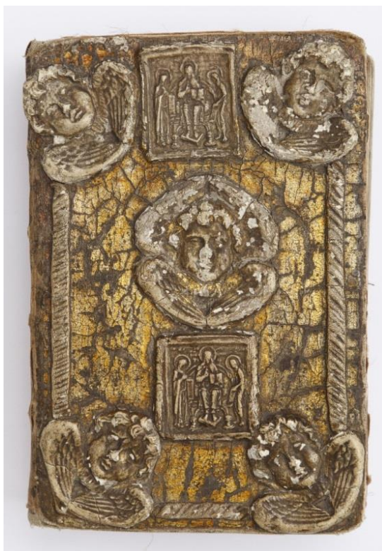
Рисунок 4. Переплет XVIII век.

Во второй половине XVIII века искусство переплета продолжало совершенствоваться. Особое развитие оно получило в связи с появлением в России крупных дворянских библиотек. Переплеты независимо от содержания книги обтягивались красным сафьяном и украшались рамкой и супер экслибрисом.