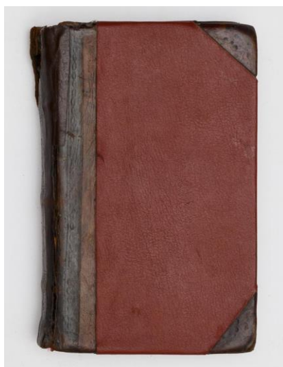
Рисунок 6. Переплет XIX век.

Так же в начале XX века переплетные мастера начали работать с ледерином. Ледерин (от немецкого Leder – «кожа») – хлопчатобумажная ткань с односторонним окрашенным нитроцеллюлозным покрытием. Натуральная кожа использовалась реже и в конечном результате практически перестала применяться в качестве переплетного материала. Есть в музейной коллекции книги в переплетах из ледерина это книга «Месяцеслов всего лета» Москва, Синодальная типография, январь 1846 год. Переплет – картон в ледерине с уголками и корешком из кожи с тиснением. Обрез окрашен черной краской [1., стр.203], (рис.6).