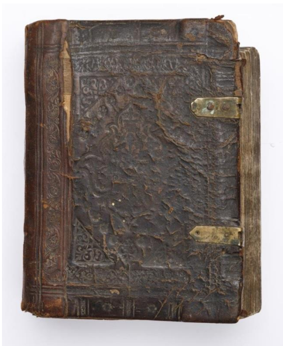
Рисунок 1. Переплет XVII века

Московского печатного двора – клеймо с изображением битвы между львом и единорогом, которое было заключено в круговую надпись. Над кругом изображены две птицы, а под ними – цветы. Вся композиция заключалась в прямоугольник, окаймлённый бордюром из орнамента [3. стр. 59.]. Со временем этот знак претерпел многочисленные изменения. В нашей коллекции есть переплет с одним средником на верхней крышке (3. табл. III – 11, 106) Минеи служебной на декабрь. Переплет XVII века – доски в коже с тиснением. Застежки утрачены, сохранились поздние спеньки. Корешок поздний с накаткой и оттиснутым названием в две строки: «Минея месяц декабрь». Обрез окрашен черной краской[3, стр. 29.], (рис. 1.).