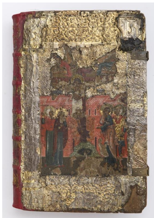
Рисунок 2. Переплет XVII век.

иконы набиты пластины разновременной серебряной басмы, вероятно XVI – XVII века. На верхних углах на подкладных из пергаментных листов и черной мастики набиты серебряные штампованные наугольники с изображением евангелистов Иоанна и Матфея. Сохранились так же часть наугольника в правом нижнем углу с евангелистом Марком. Четвертый наугольник утрачен. По сторонам креста имеются металлические пластинки с названием сюжета: «Распятие Господне». На нижней крышке и корешке сохранились фрагменты малиновой парчи» [1.стр. 24.], (рис. 2).