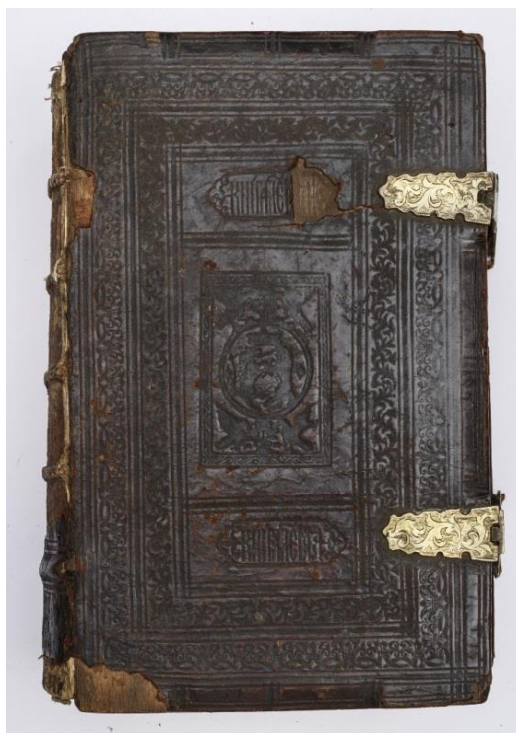
Рисунок 3. Переплет XVII век.

На рубеже XVII – XVIII веков деревянные крышки переплета заменили на картонные. В соответствии с духом петровских реформ в начале XVIII века распространение получили строго оформленные переплеты: крышки, как правило, обтягивались темной телячьей кожей без украшений, корешок бинтами делился на части, в одном из верхних его членений помещалось краткое название книги. Вместо кожаных ремней для скрепления книги стали использовать более тонкую тесьму. Значительно реже встречаются цельно кожаные переплеты с узкой, тисненной золотом орнаментальной рамкой. В музее хранится «Евангелие» напечатанное в (1564 год) Московской анонимной типографии в переплете XVIII века. Доски в бархате, на верхнем крышке золоченое украшение из гипса: в уголках и среднике – херувимы, под средним оттиснут в гипсе с одной формы трех фигурный Деисус. Обрез золоченый с чеканом. Запись на обороте верхней крышки гласит «Евангелие принадлежит Космодимиановской Селищской церкви Крестецкого уезда Новгородской епархии»[1., стр. 19], (рис 4.).