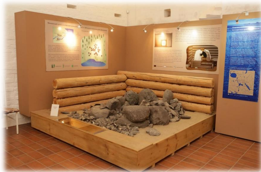
Фото 1. Каменное основание печи из Минино I, X–XII век Выставка Древности Белозерья, Кирилло-Белозерский историко-архитектурный и художественный музей-заповедник

Остатки наземных срубных построек жилого назначения X–XII веков, обнаруженные в ходе новгородских и ладожских раскопок, свидетельствуют о том, что и для этих территорий в это время свойственен переход от землянок и полуземлянок к полноценным рубленым домам, которые отапливались каменно-глиняными или глинобитными печами, установленными ближе к входу в жилое помещение.