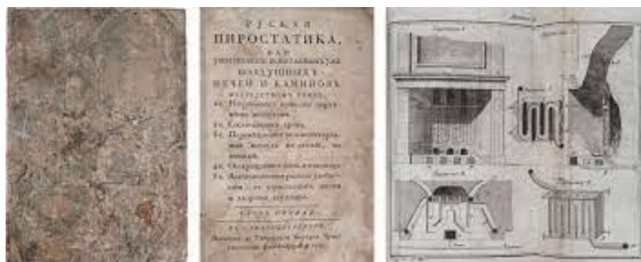
Фото 2. Брошюра «Русская пиростатика»

Помимо функции обогрева жилища и приготовления пищи печь считалась предметом мистическим и сакральным, ибо была вместилищем огня, который наши предки уважали и почитали. Вся жизнь человека, так или иначе, была связана с домом и печью, и именно здесь люди находились под защитой предков и домашних духов, одной из наиболее распространенных персонификаций которых, стал домовый. Он охранял дом, помогал справным хозяевам, наказывал нерадивых, предупреждал о неприятностях и хранил очаг. Разные народности приписывали ему различные места обитания, но все они сходились в том, что самым любимым местом в избе была печь, он мог жить на печи, за ней в подпечье или в голбце, говорили: «Домовой печется» – заботится или беспокоится. Вепсы считали, что домовый часто является в образе крупной мыши, живущей преимущественно за печью, и выбрасывали ему туда молочные зубы своих детей со словами: «Мышка-норушка! На тебе деревянный, дай мне костяной!». Покидая по разным причинам старое жилье, люди старались забрать «счастье» с собой, для этого они, в самом простом варианте, забирали уголья из старого очага и переносили их в новый, со словами «милости просим, дедушка, на новое жилье». Иногда для того же под печь или в печь запикивали разношенный лапоть и говорили: «Домовой-Домовой, садись в сани – поезжай с нами!»