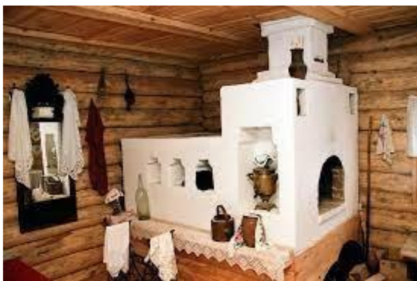
Фото 3. Русская печь.

Печь была символом мира и покоя, при ней нельзя было ругаться или выражаться, тогда говорили: “Печь в избе!” (фото 3).