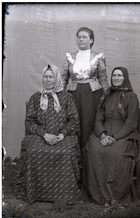
Фото 13. Негатив стеклянный «Неизвестные». Начало XX века. Стекло, фотоэмульсия, фотосъёмка. 12,9×9,0 см КБИАХМ НВ-1687/7

Одноцветный сарафан, а позднее юбка и кофта в тон получили название «пара» (фото 13).