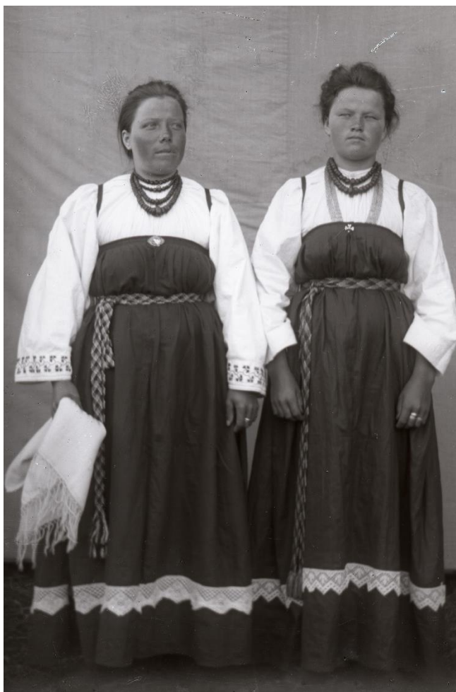
Фото 2. Негатив стеклянный «Неизвестные». Начало XX века Стекло, фотоэмульсия, фотосъёмка. 12,8×8,8 см. КБИАХМ НВ-1687/4

Старшее поколение и крестьянки дальних от погостов деревень не изменили устоявшемуся типу костюма: они по-прежнему в длинных круглых присборенных сверху сарафанах, смотря по достатку: бедные в холщовых «красиках» или «ситешниках» из дешевой фабричной ткани, богатые – в шерстяных «гарусниках» и штофных – шелковых сарафанах (фото 2, 3).