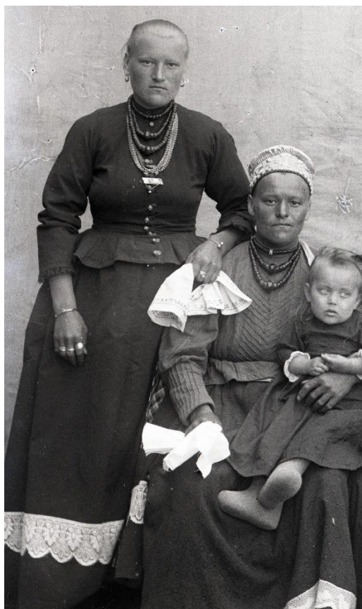
Фото 5. Негатив стеклянный «Неизвестные», фрагмент. Начало XX века Стекло.11,8×8,8 см. КБИАХМ НВ-1687/54

Непременным атрибутом праздничной одежды были украшения. На фотографиях на показ выставлены предметы роскоши: янтари, гайтаны, браслеты и перстни (фото 5, 6).