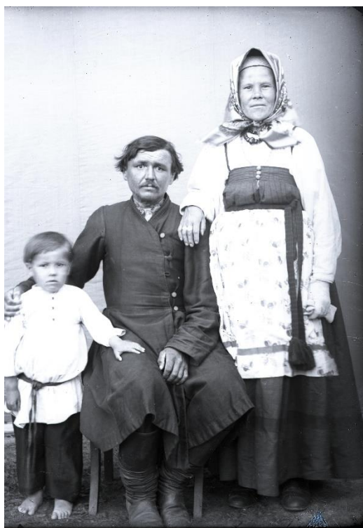
Фото 9. Негатив стеклянный «Неизвестные». Начало XX века. Стекло. 11,8×8,9 см КБИАХМ НВ-1687/62

Своеобразием достатка были нитяные перчатки – этакий признак богатства, совсем не гармонирующий с рукой, привыкшей к тяжелому бабьему труду (фото 9, 10). На двух фотографиях в качестве предмета роскоши оказался зонтик (фото 10,11).