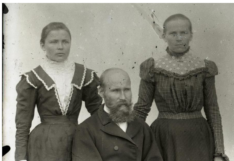
Фото 1. Негатив стеклянный. Начало XX века.