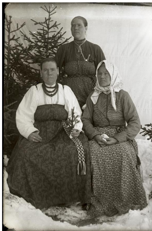
Фото 8. Негатив стеклянный «Неизвестные». Начало XX века. Стекло, фотоэмульсия, фотосъёмка. 12,9×9,0 см. КБИАХМ НВ-1687/8

Своеобразием достатка были нитяные перчатки – этакий признак богатства, совсем не гармонирующий с рукой, привыкшей к тяжелому бабьему труду (фото 9, 10). На двух фотографиях в качестве предмета роскоши оказался зонтик (фото 10,11).