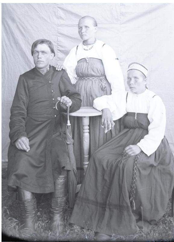
Фото 11. Негатив стеклянный «Неизвестные». Начало XX века. Стекло. 11,9×8,9 см КБИАХМ НВ-1687/49