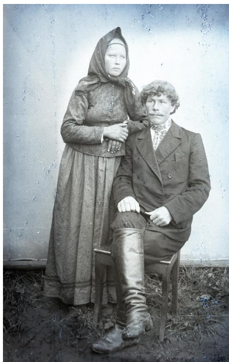
Фото 12. Негатив стеклянный «Неизвестные». Начало XX века. Стекло. 11,9×9,0 см. КБИАХМ НВ-1687/47

Часть крестьянок Спасской волости, сообразно новой моде, поверх сарафана стали надевать приталенную кофту с глухим воротом – казачек (фото 12).