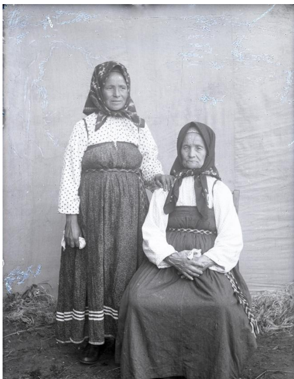
Фото 3. Негатив стеклянный «Неизвестные». Начало XX века Стекло, фотоэмульсия, фотосъемка. 11,9×8,9 см КБИАХМ НВ-1687/5

а у богатых – шелковый». Пестрые кокшеньгские пояса с ромбическим рисунком – один из наиболее характерных элементов тарногского костюма (фото 3, 4).