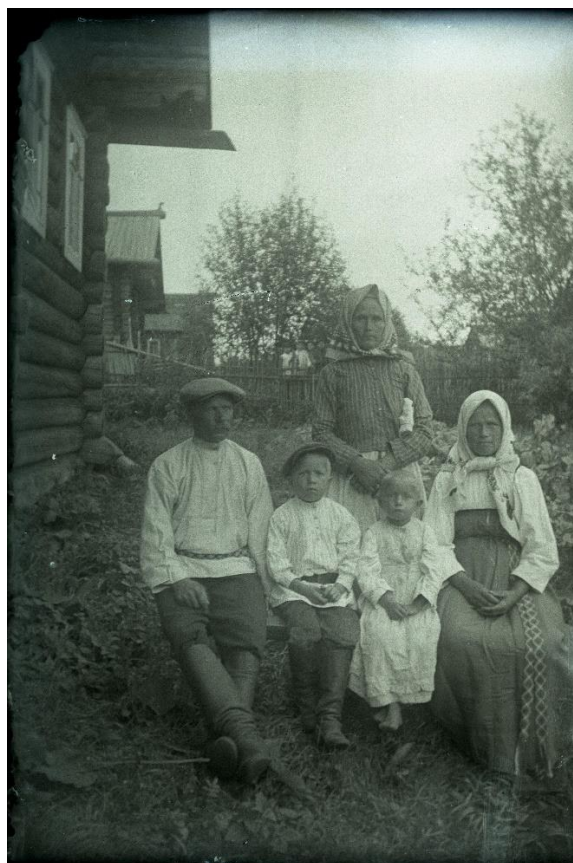
Фото 4. Негатив стеклянный «Неизвестные». Начало XX века. Стекло. 12,8×9,1 см. КБИАХМ НВ-1687/52