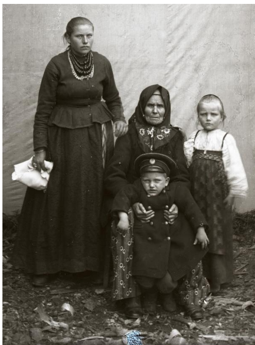
Фото 6. Негатив стеклянный «Неизвестные». Начало XX века Стекло.11,9×8,9 см. КБИАХМ НВ-1687/61