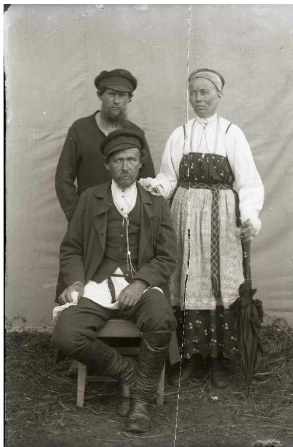
Фото 10. Негатив стеклянный «Неизвестные». Начало XX века. Стекло. 9,0×12,0 см КБИАХМ НВ-1687/69