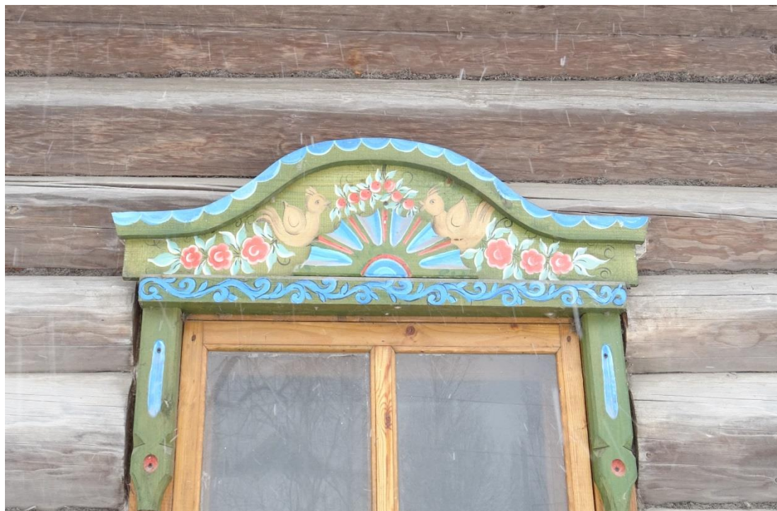
Фото 6. Редкий пример украшения расписными наличниками дома. Автор росписи Т.В. Люшина (фото г. Кириллов, 2023 год)

Кирилло-Белозерский историко-архитектурный и художественный музей-заповедник приглашает посетить экспозиции, в том числе с расписными предметами из коллекции «Дерево»!