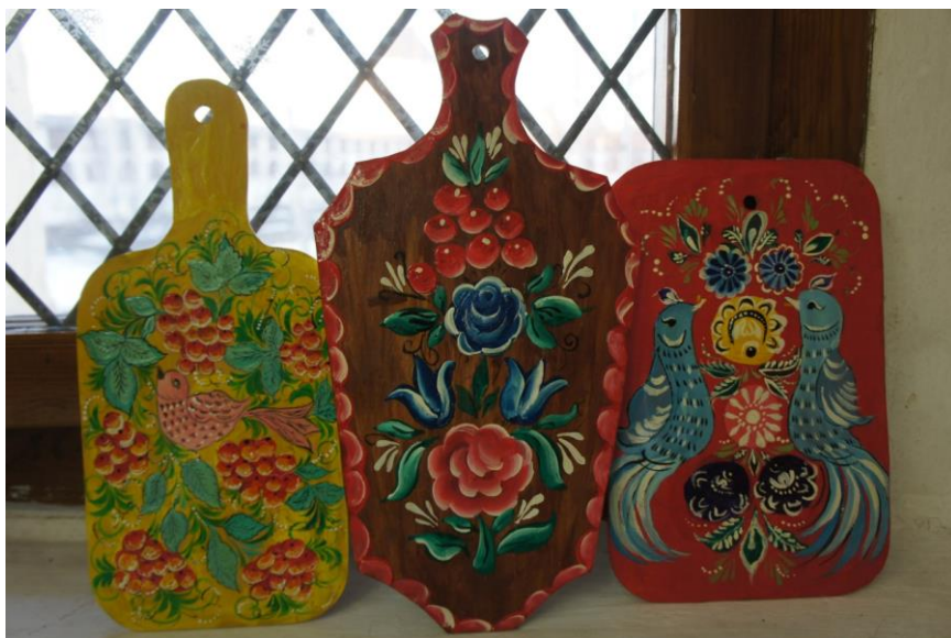
Фото 4. Работы участников занятий по изобразительному творчеству в Воскресной школе (г. Кириллов)

Родное ремесло родного края осваивают в областной столице в студии «Вологодские росписи».