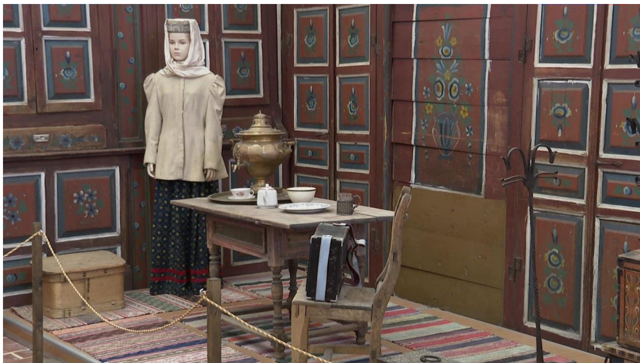
Фото 1. Интерьер экспозиции «Народное искусство Белозерья» в Кирилло-Белозерском музее-заповеднике. 2020 год

Появление кирилловской и других видов росписи относят к историческим периодам развития промыслов, связанных с обработкой дерева и изготовлением из древесных пород