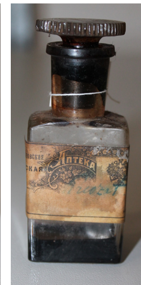
Кат. 19. Бутылочка аптечная с пробкой. Конец XIX – начало XX века