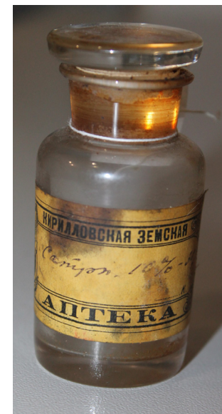
Кат. 18. Бутылочка аптечная с пробкой. Конец XIX – начало XX века