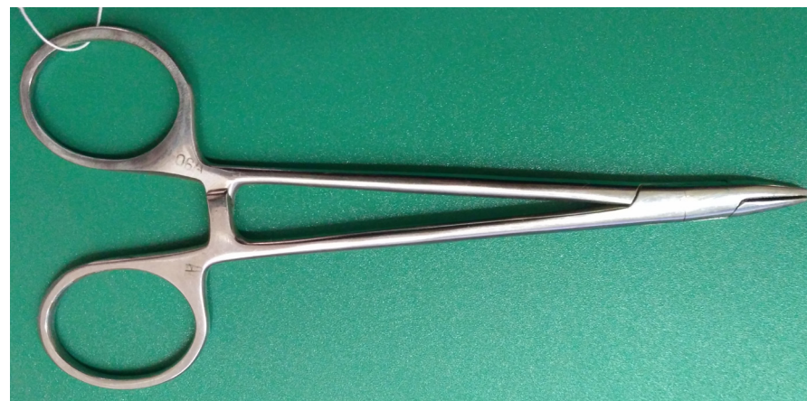
Кат. 54. Иглодержатель хирургический в виде ножниц. 1980-е годы