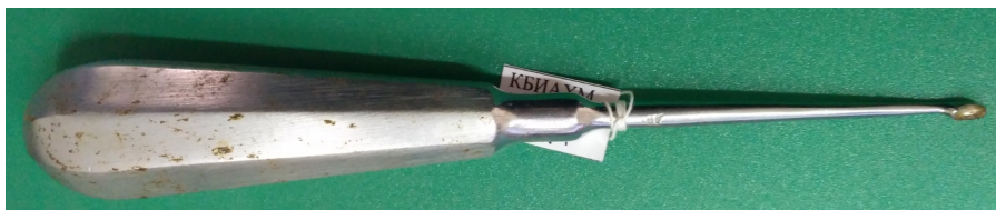
Кат. 11. Ложка костная острая малая. 1970–1980-е годы