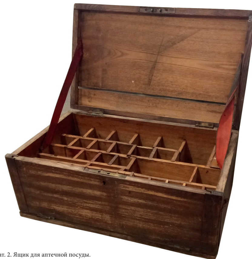
Кат. 2. Ящик для аптечной посуды. Начало XX века