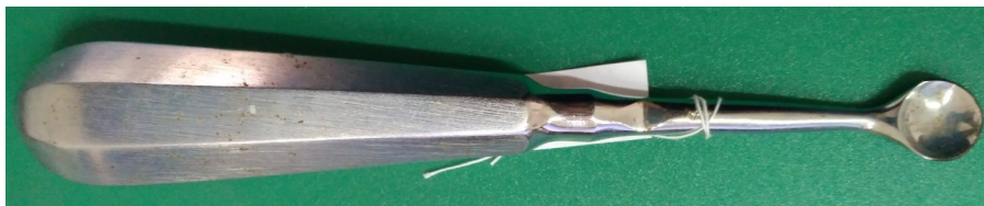
Кат. 12. Ложка костная острая большая. 1970–1980-е годы

Стекло, отливка 30,5×16,2×16,2 см КБИАХМ КП-34599 К-3531 №ГК-22973025