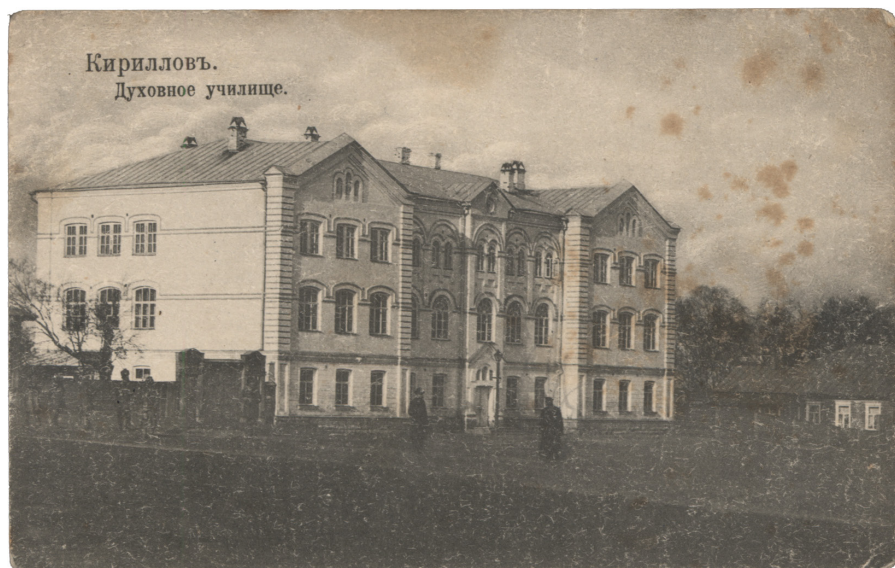
Здание духовного училища. Начало XX века

земства. Празднование юбилея свидетельствовало о широком общественном признании заслуг земского доктора. В этом же году была утверждена сумма на содержание врача, заведующего больницей – 1800 рублей.