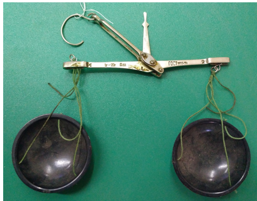
Кат. 31. Весы аптечные равноплечные. 1954 год