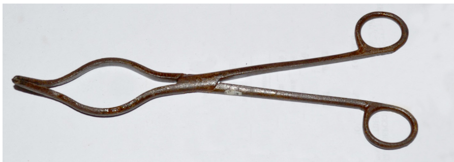
Кат. 52. Пинцет. Конец XIX века