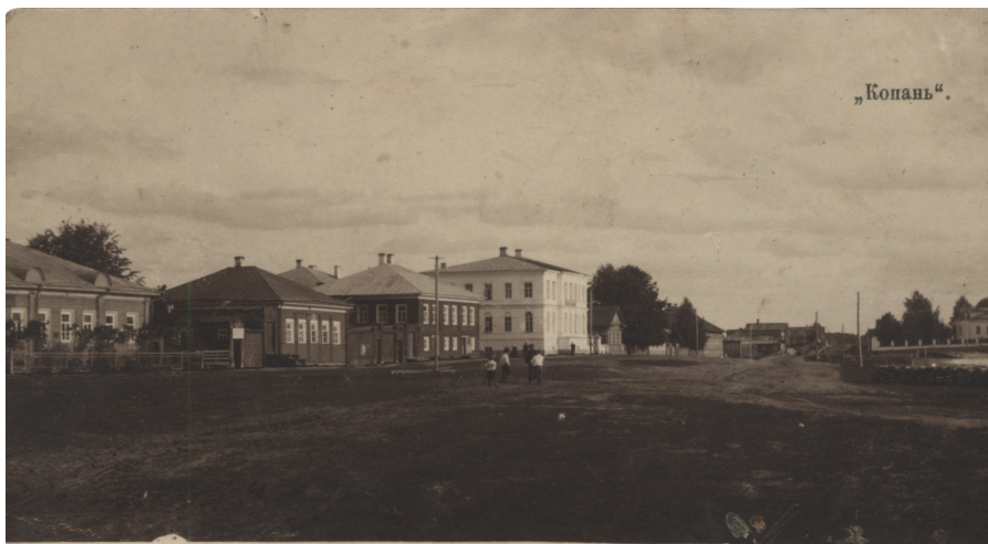
Вид на улицу Большая Набережная. Начало XX века

фарфоровые ступки и пестики для измельчения и смешивания лекарственных веществ, аптекарские весы, различные стеклянные флакончики, баночки и пробирки для лекарств. Некоторые бутылочки имеют этикетку Кирилловской земской аптеки и другие рукописные надписи. Для отмеривания сыпучих веществ и жидкостей применяли мерную аптечную посуду – мерные колбы, мензурки, бюретки, капельницы, пипетки.