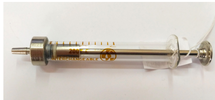
Кат. 67. Шприц инъекционный многоцветный. 1970–1980-е годы