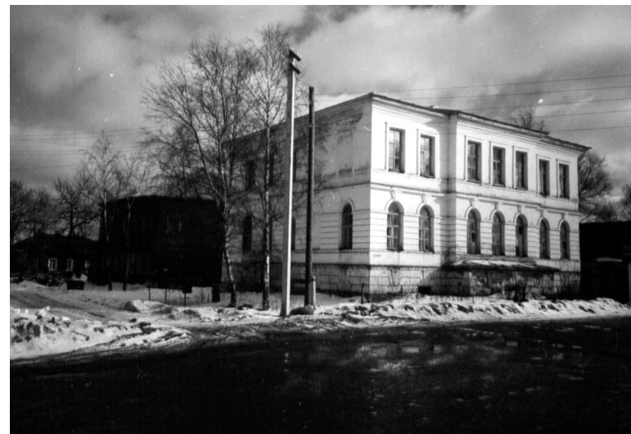
Каменное и деревянное здание больницы. Конец XX века

В 1912 году в честь 25-летнего юбилея службы И.Я. Нодельмана Кирилловское уездное земское собрание постановило учредить стипендию его имени в реальном училище, наименовать его именем хирургического отделения при городской больнице, подготовить приветственный адрес от