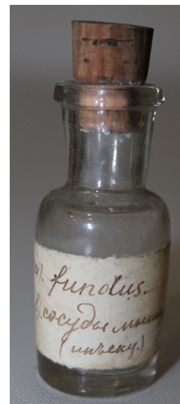
Кат. 10. Бутылочка аптечная с пробкой. Начало XX века

26. Бутылочка аптечная с пробкой Начало XX века Стекло, бумага, чернила, отливка, рукопись 6,7×2,7×2,7 см КБИАХМ КП-34740 К-3597 №ГК-24073269