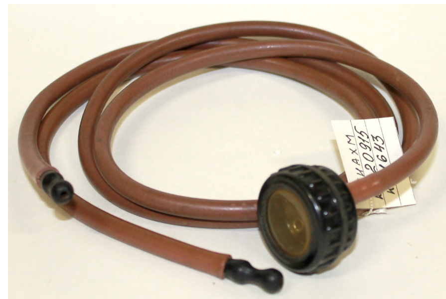
Кат. 57. Фонендоскоп. 1940-е годы

61. Шприц медицинский Вторая половина XX века Стекло, металл, сборка 12,3×2,5 см КБИАХМ КП-29147 М-2830 №ГК-7807289