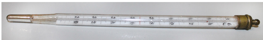
Кат. 58. Термометр в футляре. Начало XX века

Фарфор, глазурь, отливка 3,5×3,5×10,4 см КБИАХМ КП-34700 К-3557 №ГК-24073327