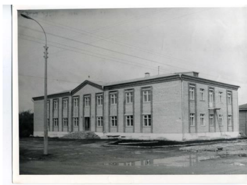
Фото 8. Здание райисполкома, построенное в 1975 году

В первой половине 1970-х годов, благодаря Кирилловским строительным организациям в городе произошли большие перемены. В центре города выросли красивые белоснежные здания райисполкома и райкома партии (Фото 8, 9), достраивался Дом связи.