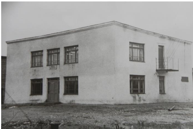
Фото 3. Новое здание КБО. 1967 год

сгорело. После пожара службы комбината переехали в новое помещение на улицу Гагарина, дом 94. В этой части здания бывшего КБО сейчас располагается "Дом Детского Творчества" (Фото 3).