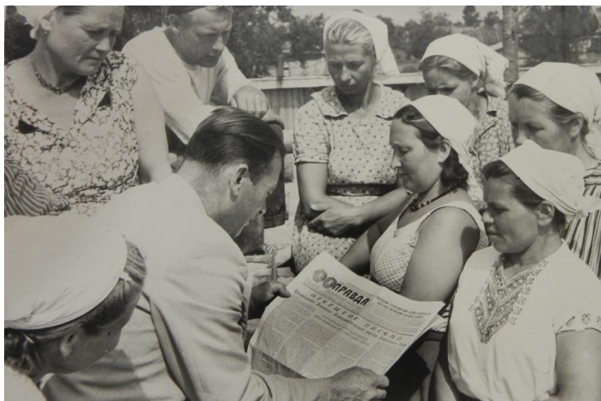
Фото 4. Стройучасток, знакомство с открытым письмом. 1963 год

Летом 1968 года, для рабочих и служащих объединения «Сельхозтехники» вблизи мастерских началось строительство 16-квартирного жилого дома. Это был первый дом в городе с центральным отоплением и водопроводом. Строительство вёл прорабский участок треста «Череповецсельстрой» 7 .