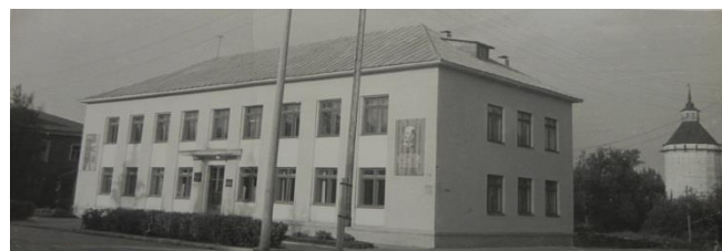
Фото 9. Здание Кирилловского РК КПСС, построенное в начале 1970-х годов

Развитие сервисной зоны (зоны гостеприимства, культурно-бытовых услуг и отдыха) в городе было предусмотрено Советом Министров РСФСР ещё в 1969 году. Учтено оно и в генеральном плане застройки города Кириллова, утверждённом в марте 1971 года. В рассматриваемое время уделялось большое внимание улучшению сервисной зоны города. На зелёном мысу Сиверского озера раскинулся комплекс турбазы «Сиверская». В это время была построена современная четырёхэтажная гостиница «Русь». Была создана сеть столовых и кафе, открылись два ресторана – «Русь» и «Трапеза» 14 .