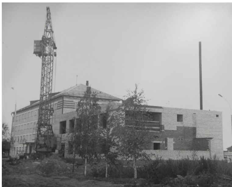
Фото 10. Строительство гостиницы и ресторана «Русь». Первый в городе башенный кран КБ-100

За 1960-е и 70-е годы в городе Кириллов произошли существенные перемены в социальной жизни. Курс на типизацию и индустриальное домостроение позволил развернуть массовое жилищное строительство и подойти к решению важнейшей социальной задачи – обеспечение людей благоустроенным жилищем. Постановка задачи посемейного заселения квартир при ограниченности экономических возможностей того времени привели к созданию малогабаритных квартир. Миллионы людей впервые в жизни ощутили достоинства отдельной квартиры. Началось повсеместное посемейное заселение новых квартир – явление дотоле неведомое, социальное значение которого трудно переоценить 15 .