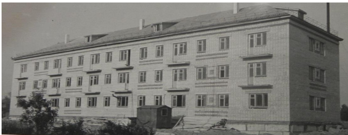
Фото 5. Заканчивается строительство 33-х квартирного жилого дома по улице Урицкого 16, 1972 год

В 1970-е годы в Кириллове строятся новые административные здания, жилые благоустроенные дома, детские сады, магазины. В начале 70-х годов каркасно-панельное и монолитное железобетонное строительство было дополнено возведением зданий из довольно экономичного силикатного кирпича (Фото 5). Этот стройматериал позволил повысить уровень комфорта в жилых зданиях без особого удорожания строительства, хоть скорость возведения несколько и снизилась. Достоинства силикатных фасадов также заключались и в том, что их не нужно было штукатурить – этот материал не требовал утепления, в отличие от железобетонных панелей и монолита, и хорошо выдерживал самые сильные морозы без потери комфорта внутри зданий 9 .