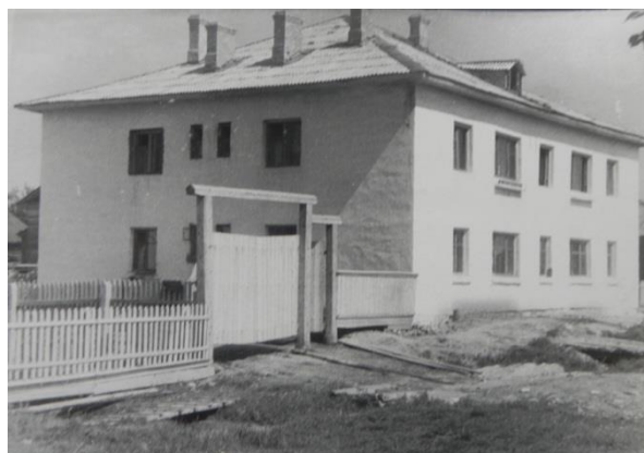
Фото 2. Новый дом по улице Рабоче-Крестьянской (ныне улица Победы). 1963 год

В 1966 году было закончено строительство здания КБО (комбинат бытового обслуживания). В 1967 году старое, деревянное здание комбината бытового обслуживания