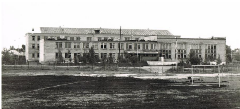
Фото 7. Кирилловская средняя школа. Фото конца 1970-х годов

В первой половине 1970-х годов, благодаря Кирилловским строительным организациям в городе произошли большие перемены. В центре города выросли красивые белоснежные здания райисполкома и райкома партии (Фото 8, 9), достраивался Дом связи.