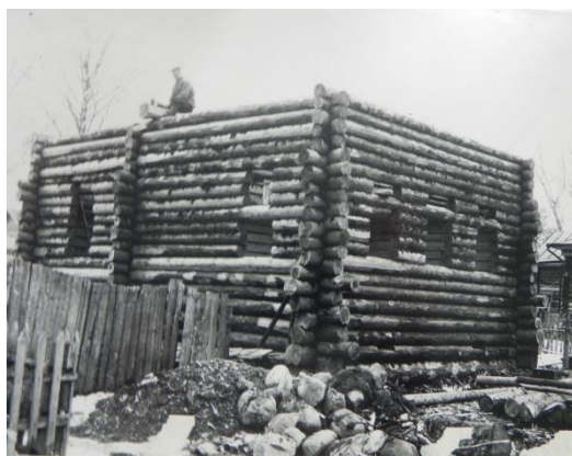
Фото 1. Постройка нового дома в Кириллове

По сложившейся исторической традиции в городе сохранялось малоэтажное строительство. В первой половине 1960-х годов в Кириллове было построено шесть двухэтажных домов: три деревянных (Фото 1) и три кирпичных, 8-квартирные и 12-квартирные (Фото 2).