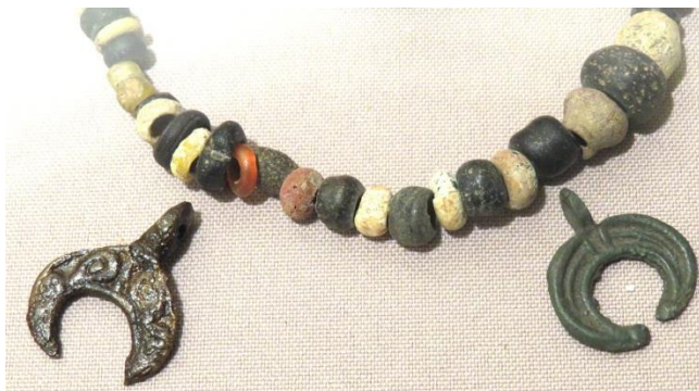
Рис 1. Лунницы

Лунницы являлись одной из наиболее распространенных составных частей средневекового обережного ожерелья. Они носились на груди, точно у сердца, или у пояса (защищая солнечное сплетение) и, как правило, помещались между бусин рядом с сонарными знаками.