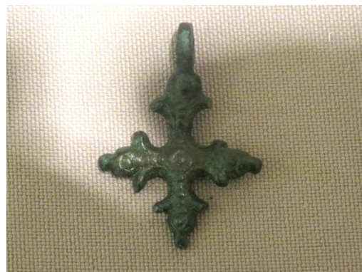
Рис 8. Крест КП-11182