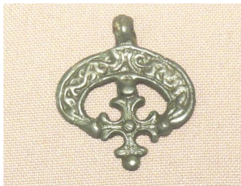
Рис 7. Лунница КП-13151

Такое же происхождение имеет и крестовключенная лунница КП-13151. Богатство и тонкость растительного орнамента, тщательность детализировки поверхности креста могут свидетельствовать о высоком профессионализме мастера. По мнению многих исследователей, такая разновидность лунниц появляется на стыке язычества и христианства. Можно предположить, что крест этой лунницы стал моделью для равносторонних крестов, отливавшихся местными мастерами.