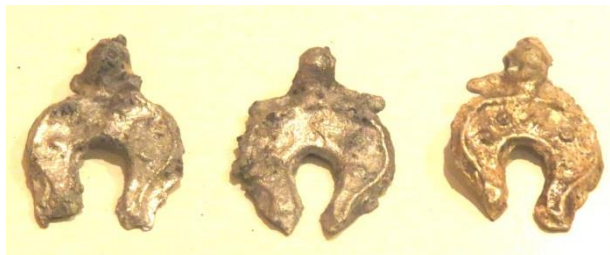
Рис 4. Следы облоя на изделиях.

видеть следы исправления таких видов брака, как непроливы и раковины. Некоторые изделия не были освобождены от облоя, что может свидетельствовать о том, что они предполагались быть использованы в качестве сырья для последующих плавок.