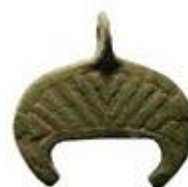
Рис 6. Лунница X века из Киева

Такое же происхождение имеет и крестовключенная лунница КП-13151. Богатство и тонкость растительного орнамента, тщательность детализировки поверхности креста могут свидетельствовать о высоком профессионализме мастера. По мнению многих исследователей, такая разновидность лунниц появляется на стыке язычества и христианства. Можно предположить, что крест этой лунницы стал моделью для равносторонних крестов, отливавшихся местными мастерами.