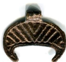
Рис 5. Лунница КП-13838

Широкоорогая лунница КП-13838, которая является точной копией лунницы найденной в Киеве в культурном слое X века имеет привозное происхождение. Ее отличает высокое качество литья, передающее мельчайшие подробности украшения лицевой поверхности изделия.