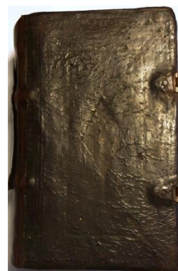
Фото 3. Книга «Обиход и праздники на крюковых нотах» XVII век

В коллекцию «Рукописные книги» у Анны Ивановны Виноградовой была приобретена уникальная книга «Обиход и праздники на крюковых нотах» XVII века.