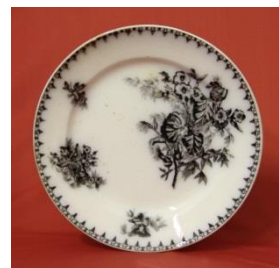
Фото 2. Тарелка. 1871–1917 годы