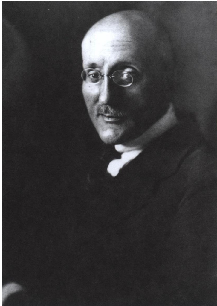
Художник, историк искусства, музейный деятель, академик, Игорь Эммануилович Грабарь

Игорь Эммануилович Грабарь – русский и советский художник-живописец, историк искусства, просветитель, музейный деятель, педагог, профессор. Член объединений «Мир искусства» и «Союз русских художников». Действительный член Академии художеств (1913–1918). Доктор искусствоведения (1940). Лауреат Сталинской премии первой степени (1941). Действительный член Академии наук (1943). Академии художеств СССР (1947). Народный художник СССР (1956).