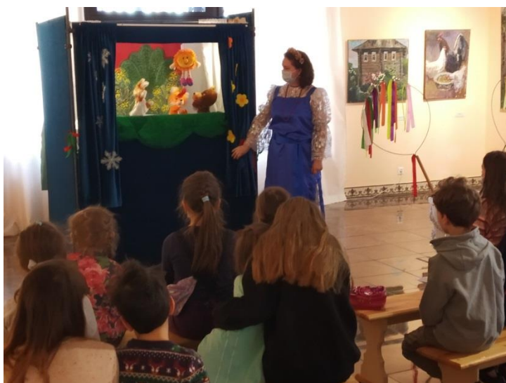
Фото 1. Кукольное представление «Здравствуй, Солнышко!»

Увлекательными были для ребят мероприятия, проходившие в дни весенних каникул, на которых они изготовили в технике аппликации весенние цветы, познакомились с зимующими и перелетными птицами нашего края, поучаствовали в викторине, разгадали загадки о птицах и изготовили из теста жаворонка, вестника весны. Популярностью