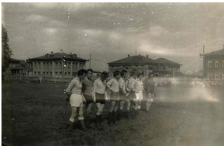
Фото 2. Команда на первом стадионе в Кириллове. 1950-е годы