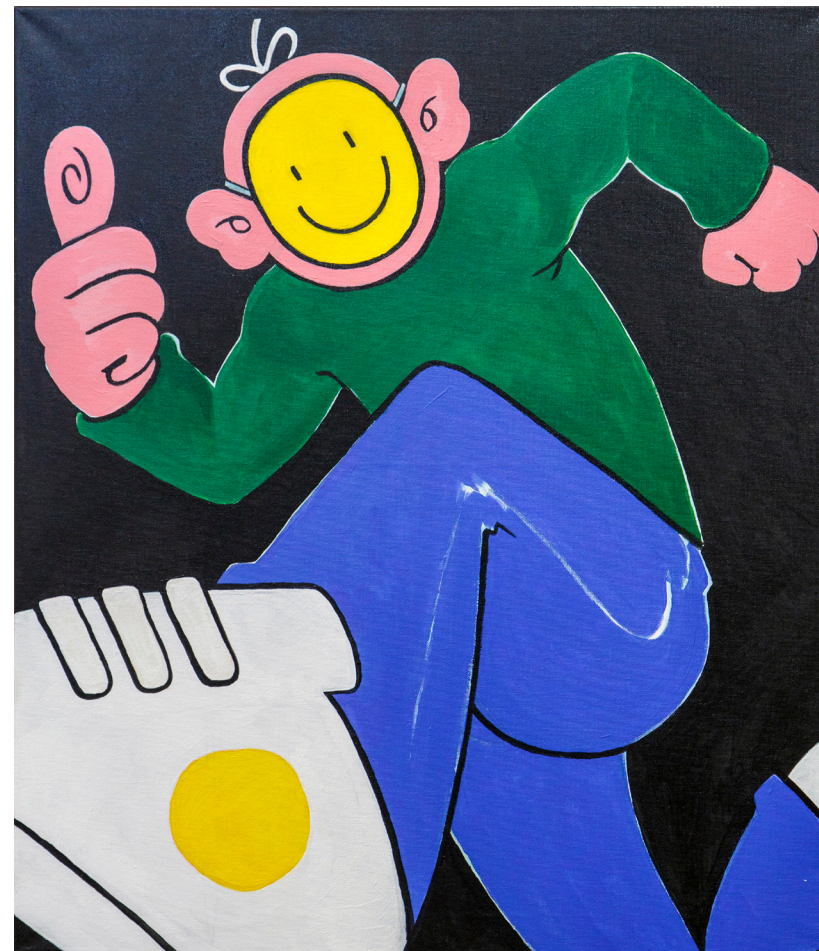
Кат. 43. Номер 1