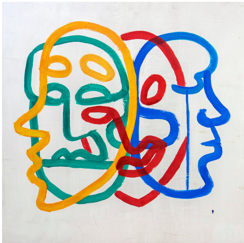
Кат. 39. Кто я?

Смешанная техника, ДСП, фасадная краска, темпера, маркеры 60,0×36,0 см