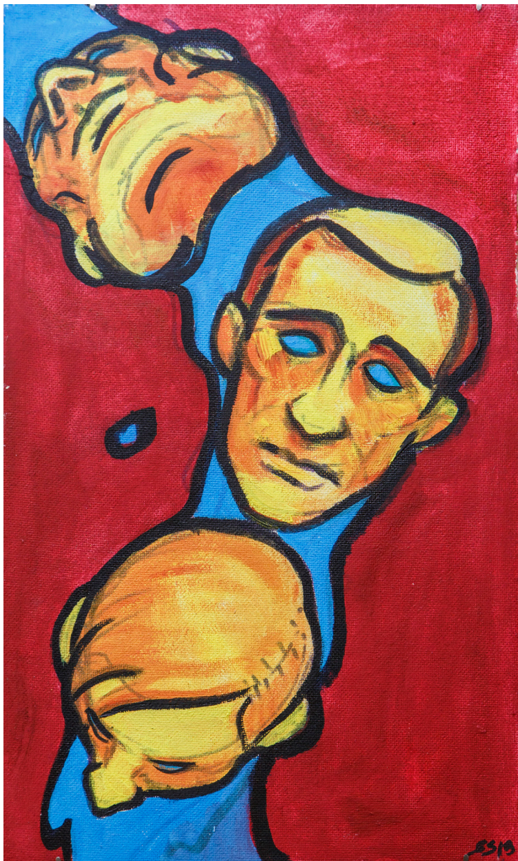
Кат. 35. Столкновение со смыслом