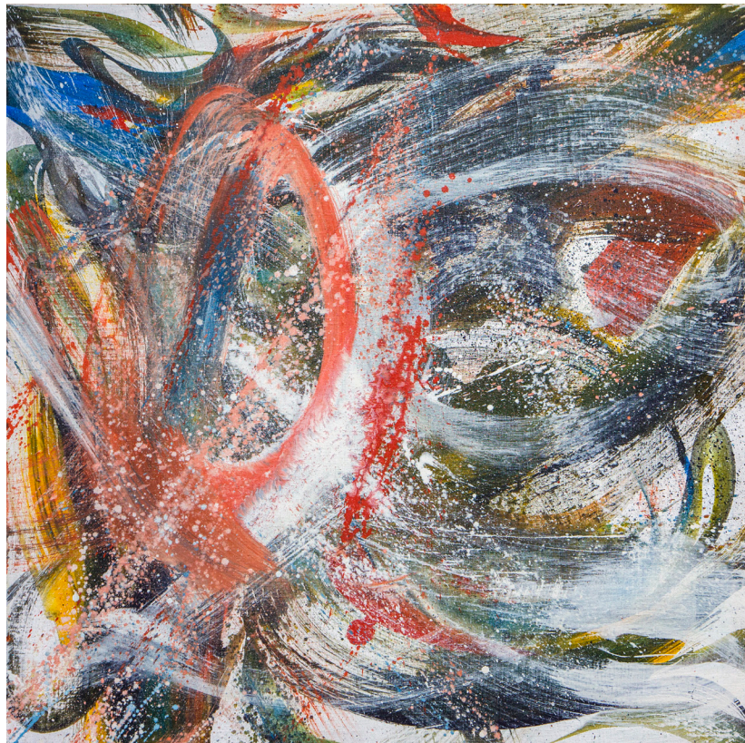
Кат. 33. Кисть вдвоём