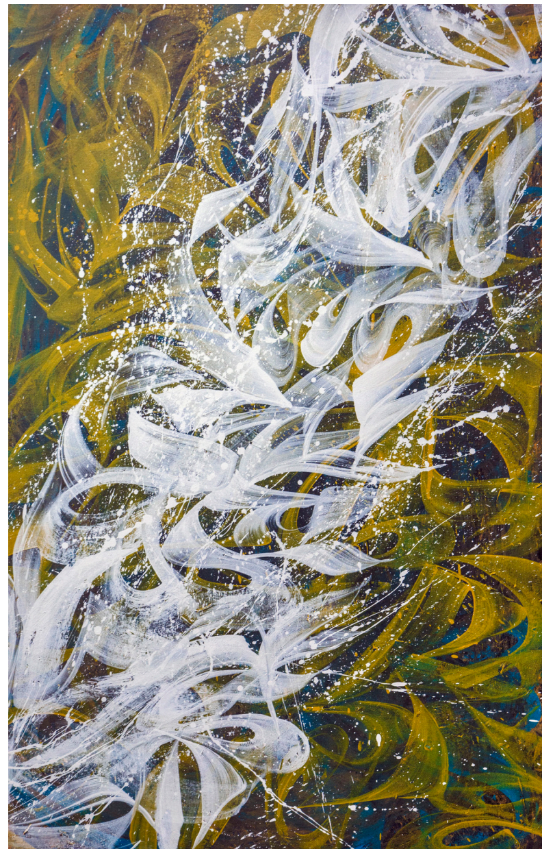
Кат. 27. Диагональный диалог