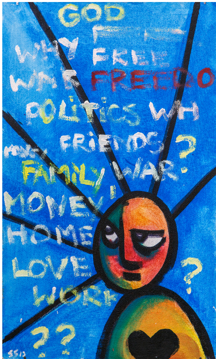
Кат. 34. Freedo