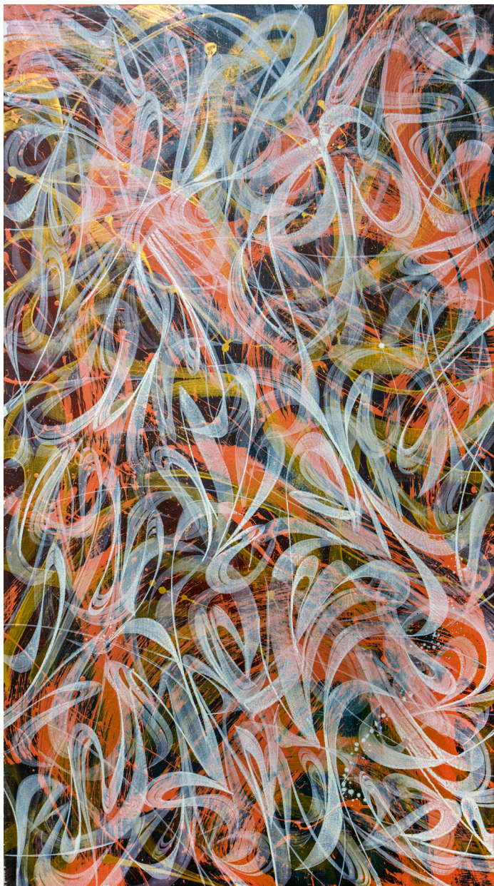
Кат. 28. Переходный возраст