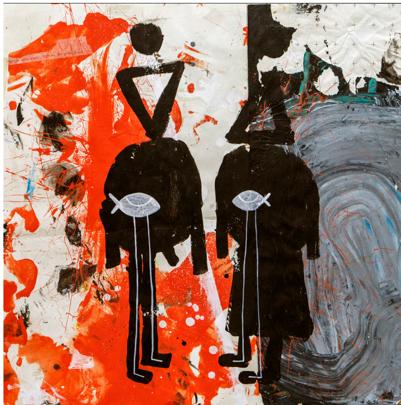
Кат. 18. Мужчины с Марса, женщины с Венеры. Серия «Путешествие к Королю Солнца»

Кат. 15. Космос наш. Серия «Путешествие к Королю Солнца» →