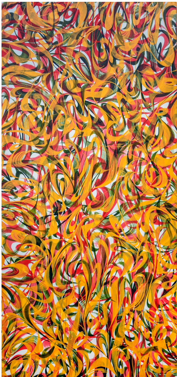
Кат. 26. Духи апреля