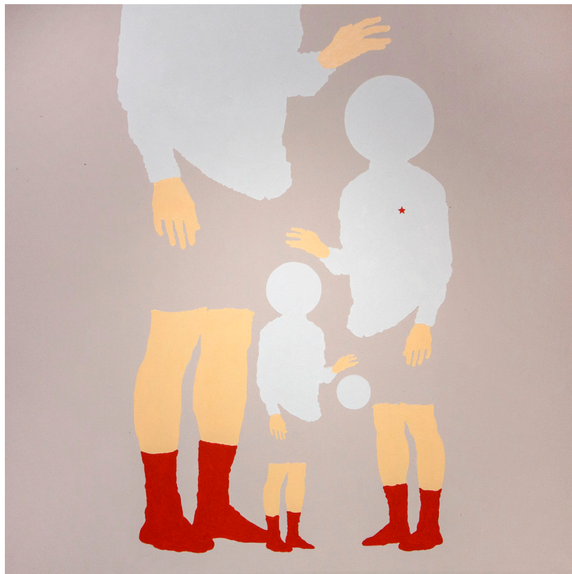
Кат. 23. Хороший мальчик. Серия «Tanz»

Кат. 21. Купальный сезон. Серия «Tanz» →