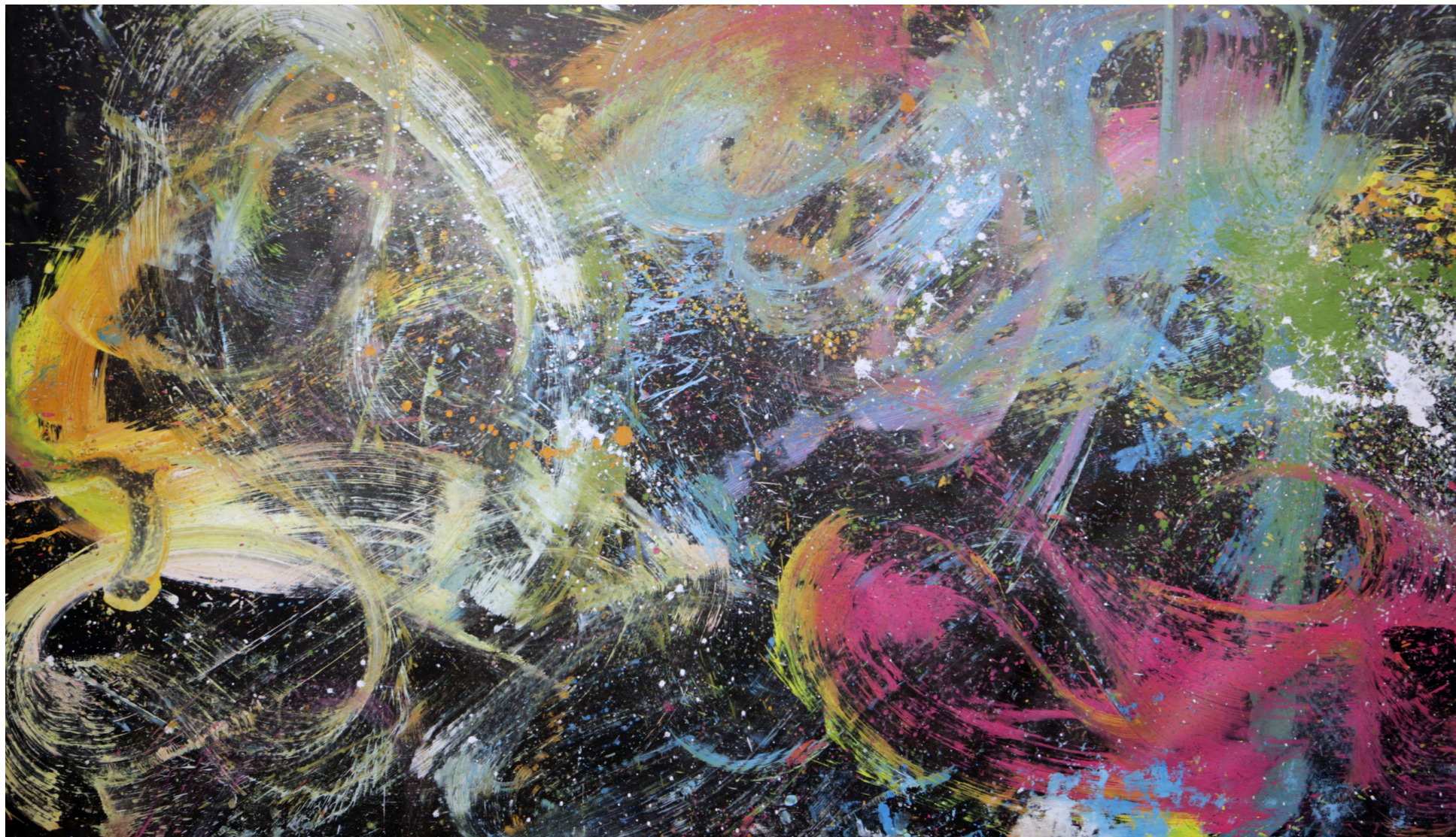
Кат. 32. Хлебный день