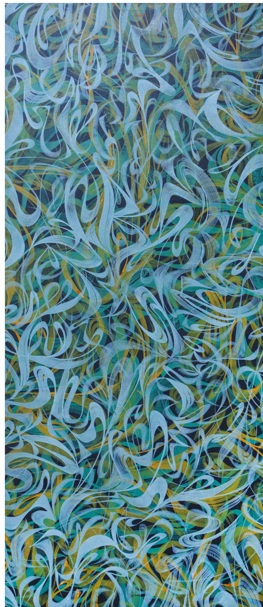
Кат. 29. Изумрудная тропа