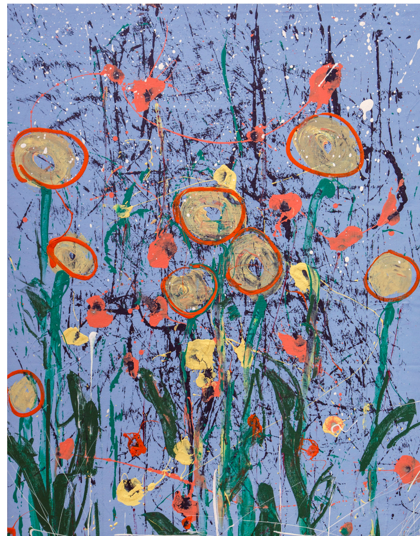
Кат. 8. Серия «About Flowers»

Через деконструкцию формы Илья хочет обратить внимание на эту самую форму. Серия создана в коллаборации с композитором Анатолием Рипом.