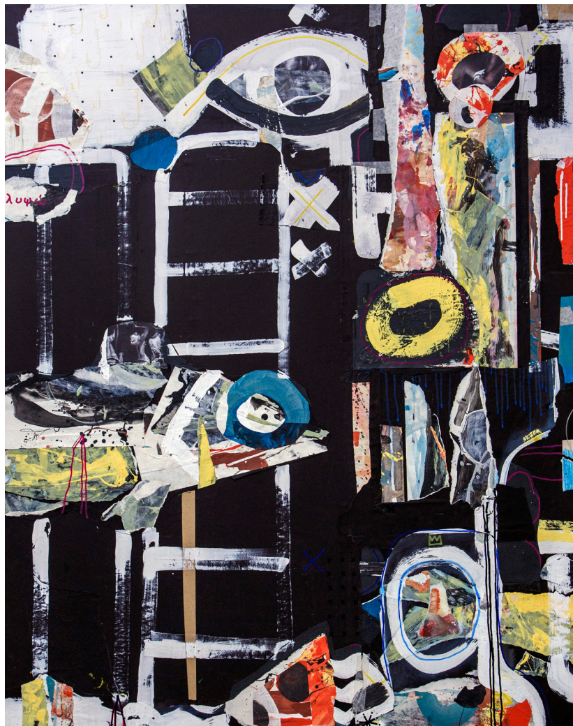
Кат. 10. Серия «Путешествие к Королю Солнца»