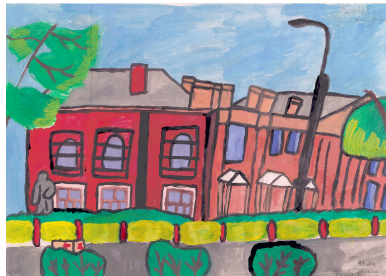
Кат. 10. «Красные ряды». Тюсова Ангелина