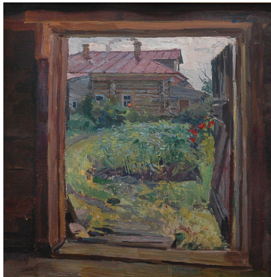
Кат. 28. Отчий дом. 1986. Горбунов Б.И.