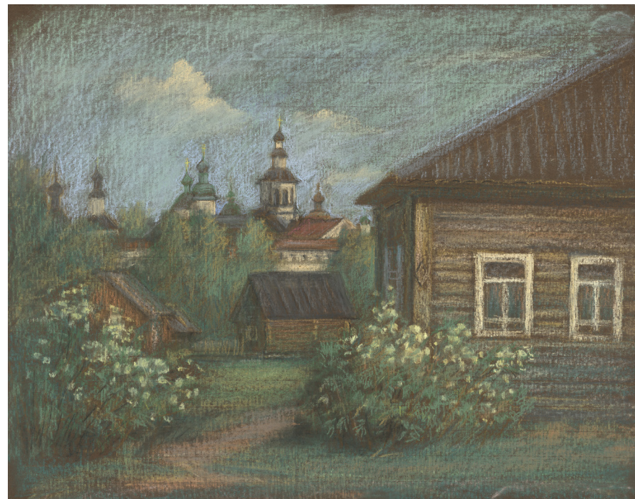
Кат. 21. Вечер. 2003. Антонова Н.А.