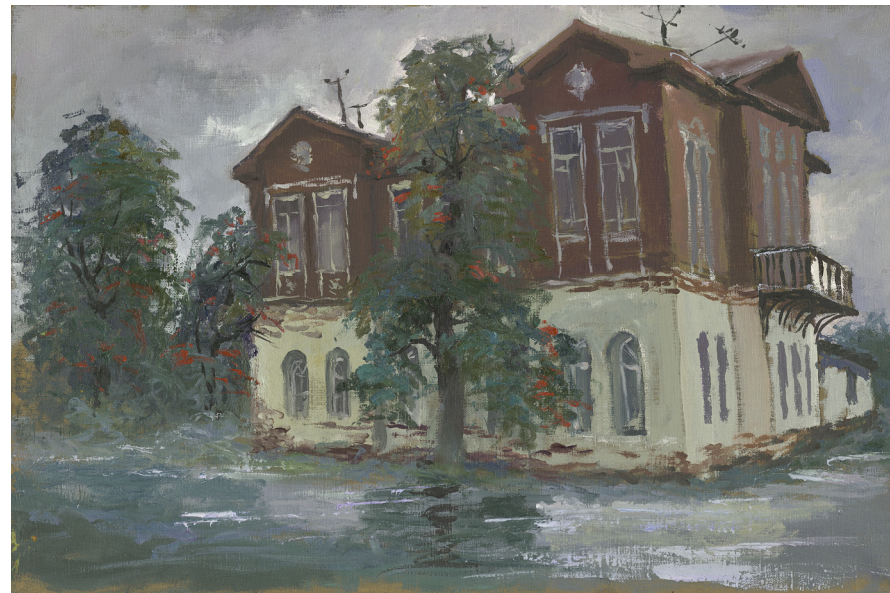
Кат. 34. Особняк в Кириллове. 2011. Пахомов О.В.

2011. Пахомов О.В. Холст, масло КБИАХМ КП-27600 МЖ-340 №ГК-6936658