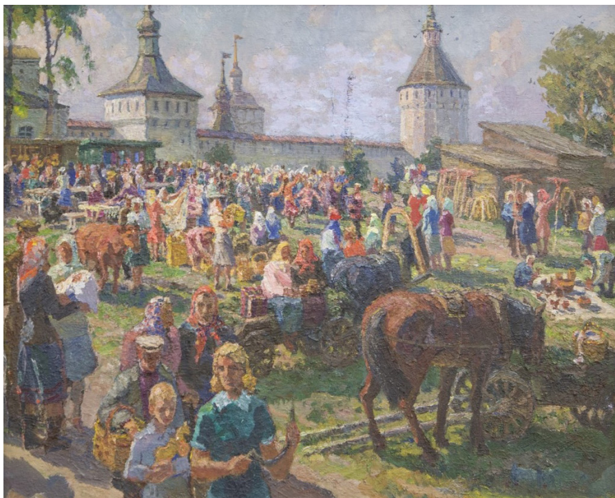
Кат. 26. Ярмарка в Кириллове. 1988. Горбунов Б.И.