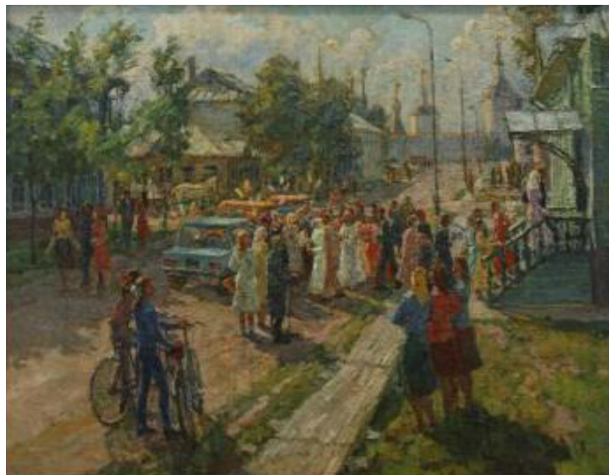
Кат. 27. У Загса в Кириллове. 1988. Горбунов Б.И.