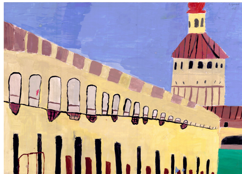
Кат. 13. «Крепостные стены Кирилло-Белозерского монастыря». Сушпанова Валерия