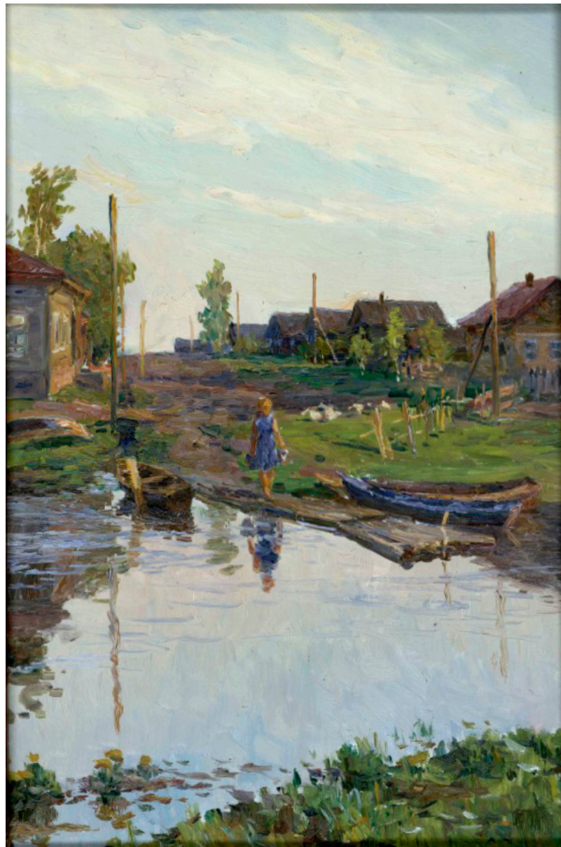
Кат. 24. Предместье Кириллова - Обшара. До 1957. Горбунов Б.И.