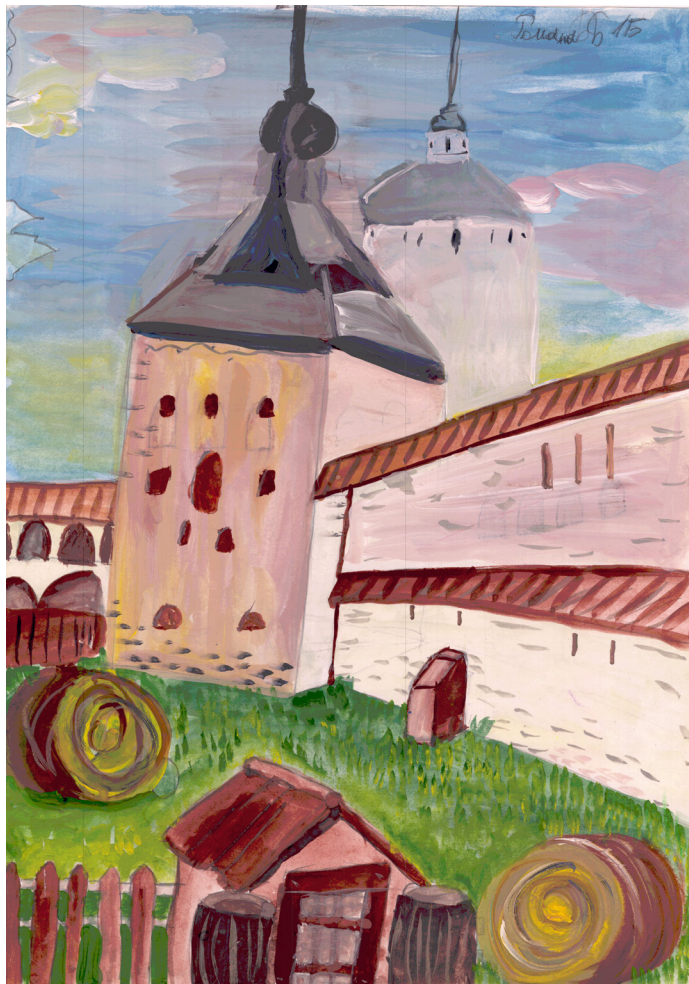
Кат. 8. «Стражи внутреннего двора монастыря». Бабаев Роман