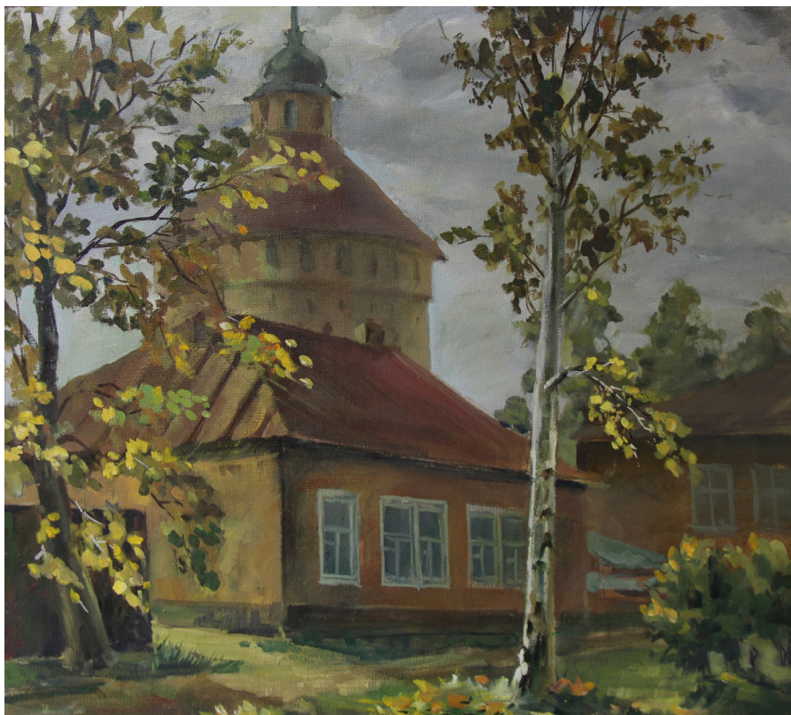
Кат. 31. Осень в Кириллове. 2004. Макарищенко А.С.