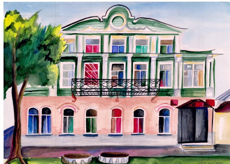
Кат. 6. «Здание суда на улице Гостинодворской». Прохорова Светлана