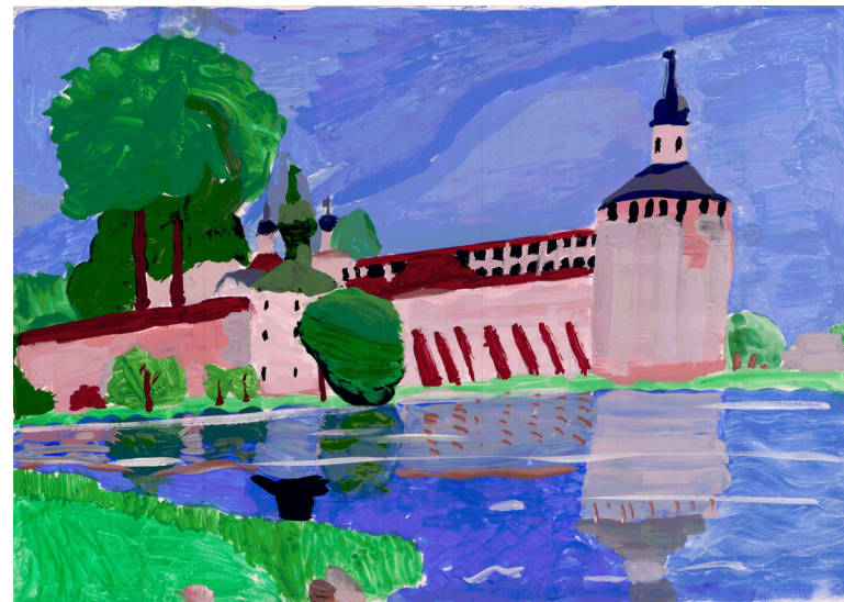
Кат. 9. «Сиверское озеро у стен и башен монастыря». Голубев Артем