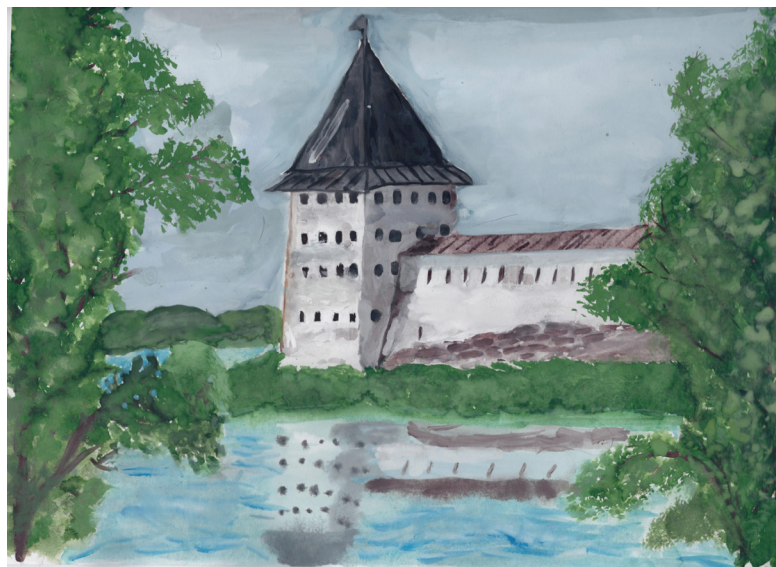
Кат. 15. «У озера». Мельников Максим