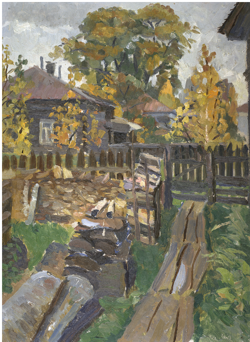
Кат. 30. Тополя моего друга. 1980-е. Поздняков А.Ф.