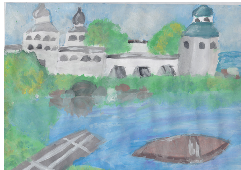
Кат. 16. «На берегу Сиверского озера». Голягина Мария