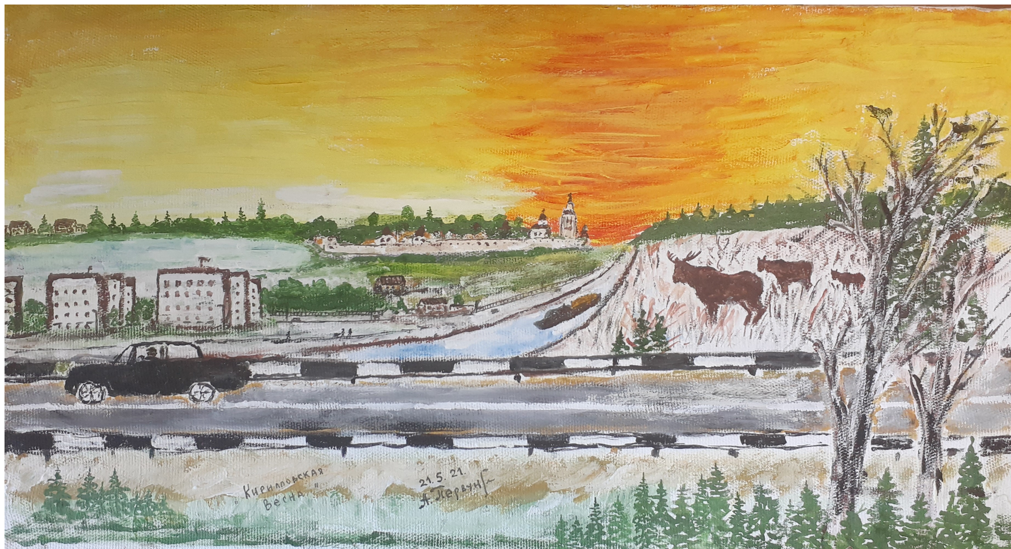
Кат. 18. «Кирилловская весна». Первунинский А.В.