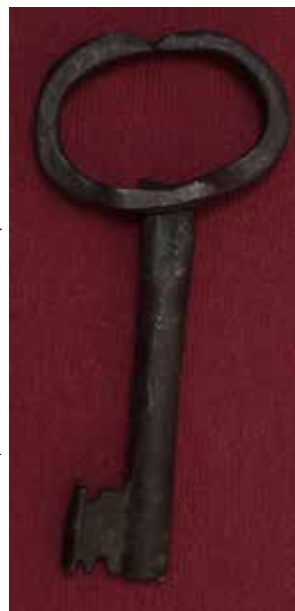
КП 13537 М 1540

Ключ состоит из цилиндрического полого стержня, расплюснутого у основания, и головки овальной формы. Головка, выгнутая из плоской четырёхгранной пластины, с сомкнутыми наверху концами подвижно крепится на основании стержня. Бородка ключа прямоугольная в сечении по форме напоминает букву Т, с тремя трапециевидными выемками: 1 – снизу, 2 – сверху и выступами по боковым граням на 0,2-0,4 см. Кольцо закреплено на стержне слабо, поверхность стержня неровная с небольшой деформацией в нижней части.