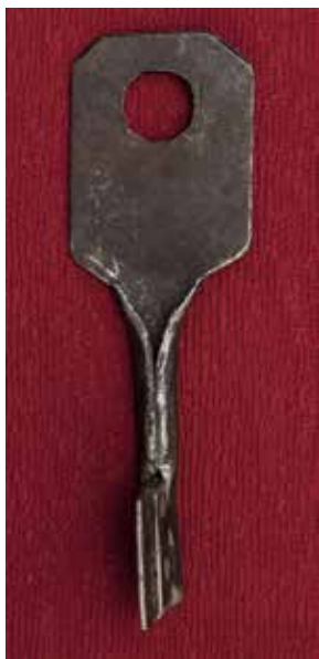
КП 26965 М 2605

со швом по внутренней стороне. Бородка прямоугольная составная, имеет щелевидную нарезку с нижней стороны, части бородки соединены 2-мя круглыми заклёпками.