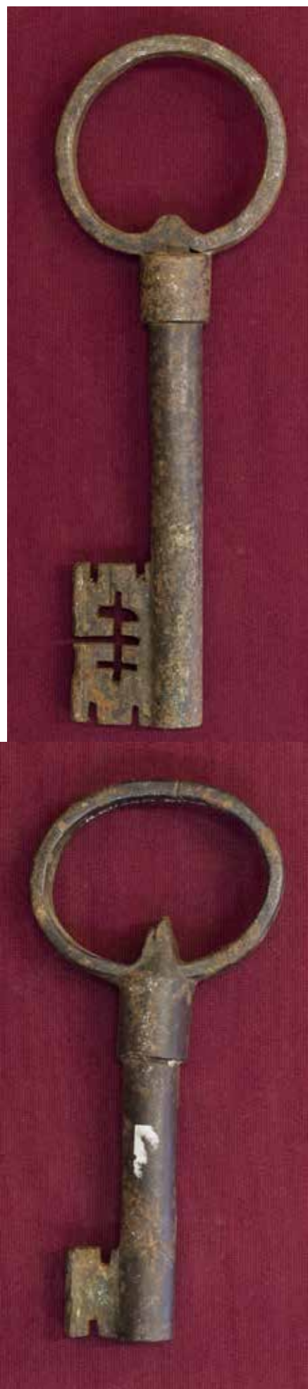
КП 22650 М 1904 КП 21361 М 1779 КП 26964 М 2604