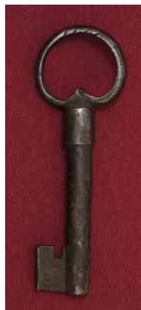
КП 962 М 517

Ключ кованый с гладкой поверхностью. Стержень полый круглого сечения диаметром 1,7 см, слегка приплюснутый в нижней части. Головка ключа в виде навершия посоха, украшенного 3 выпуклыми рельефными бороздками, над ними шаровидное утолщение, которое венчает трёхлепестковый стилизованный цветок (тюльпан или лотос). В шаровидном утолщении имеется открытое прямоугольное отверстие с одной стороны и такое же закрытое заклёпкой отверстие с противоположной. Бородка ключа прямоугольной формы длиной 7 см и шириной 3,5 см. На ней прорезные сквозные зигзагообразные отверстия в форме стилизованных цветов и двойными диагонально расположенными прорезями, в сечении по форме напоминает букву Т, с выступами по боковым граням (0,7 см). На нижней части стержня имеется надпись красной краской «КИХМ 962».