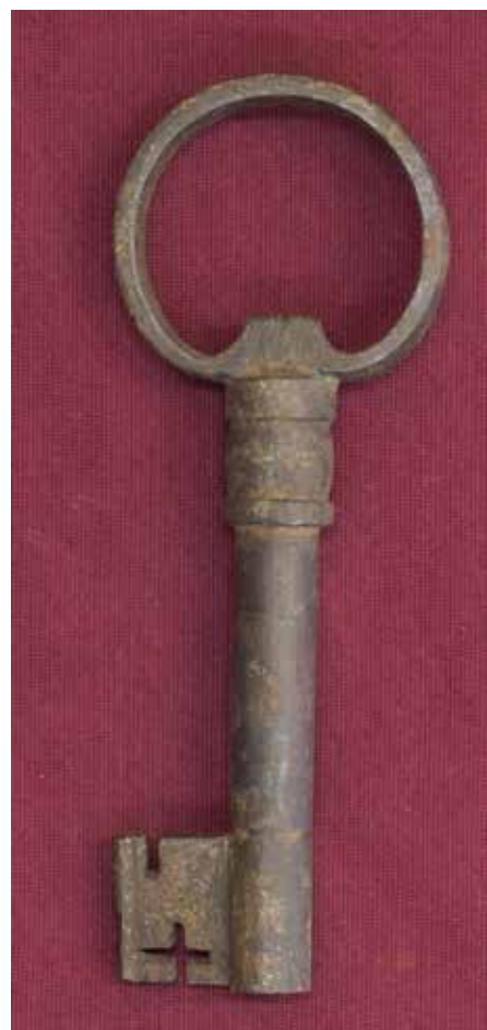
КП 7880 М 1138

Ключ кованый. Головка ключа круглая, изготовлена из плоской пластины, концы которой соединены со стержнем у его основания в форме трапеции. Основание стержня вставлено в трубку длиной 2,8 см. Стержень ключа полый круглый в сечении диаметром 1,5 см с прямоугольной бородкой в сечении по форме напоминающей букву Т, с прямоугольной прорезью со стороны головки (0,7 см), крестообразным вырезом с противоположной стороны (1,2×1,4 см) и выступами по боковым граням (0,1 см).