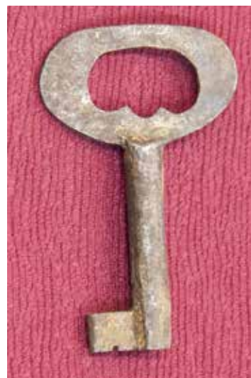
КП 13529 М 1532 КП 13530 М 1533

Ключ кованый. Головка ключа сердцевидной формы, изготовлена из четырёхгранной плоской пластины с загнутыми внутрь головки концами. Стержень ключа в форме цилиндра, в верхней части декорирован широким кольцом, в нижней части – заканчивается двухступенчатым штырём. Бородка прямоугольная в сечении по форме напоминающая букву Т, на бородке имеются две прямоугольные прорези по 0,5 см и выступами по боковым граням на 0,2 см. К кольцу прикреплена кожаная петля.