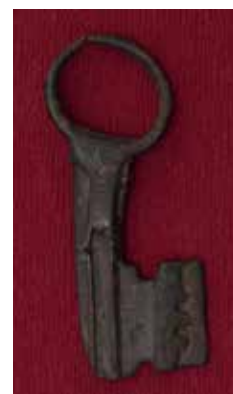
КП 26969 М 2609

Ключ кованый. Головка ключа круглая, изготовлена из четырехгранной плоской пластины, соединена со стержнем полый трубкой длиной 2 см, завершающейся треугольным сердечком внутри головки. Стержень ключа полый круглый диаметром 1,3 см с прямоугольной бородкой в сечении по форме напоминающей букву «Т», на бородке имеются две диагонально расположенные прямоугольные прорезы: сверху (0,8 см) и снизу (0,4 см) и выступы по боковым граням на 0,1-0,3 см.