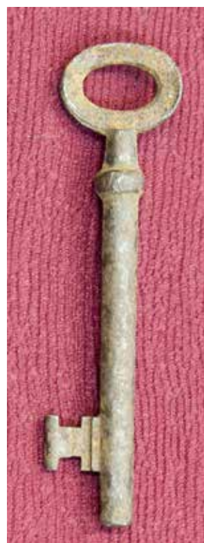
КП 15248 М 1627 КП 15249 М 1628

Ключ литой. Головка ключа сердцевидной формы, изготовлена из четырехгранной плоской пластины. Стержень ключа в форме вытянутого цилиндра, в верхней части декорирован широким валиком. Бородка фигурная (в форме буквы Н), с одной стороны центральная часть бородки имеет утоньшение. Сильно коррозирован.