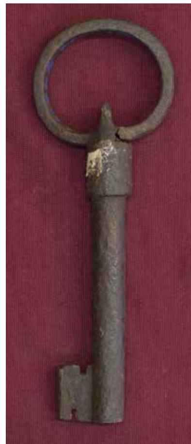
КП 11245 М 1349