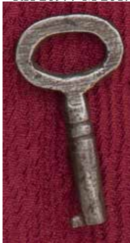
КП 26978 М 2618

Ключ из светлого металла цельнометаллический с выступающей бородкой. Головка ключа плоская овальная. Стержень полый круглого сечения диаметром 0,3 см, с тремя рельефными канавками у основания с разрезом на конце. Бородка ключа с односторонней нарезкой имеет 1 зубчик.