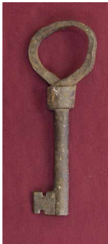
КП 3487 М 855

Ключ кованый, частично деформирован и коррозирован. Стержень полый круглого сечения диаметром 1,5 см, ключ выкован из пластины, имеется шов на месте соединения концов. Головка изогнутая, сложной формы, из плоской четырёхгранной пластины, концы которой соединены у основания стержня – один конец вставлен в другой на уровне основания стержня. Головка соединена со стержнем полый трубкой, изготовленной из плоской пластины длиной 2,4 см. Бородка ключа прямоугольная с двумя диагонально расположенными прямоугольными прорезями: сверху (0,5 см) и снизу (0,6 см).