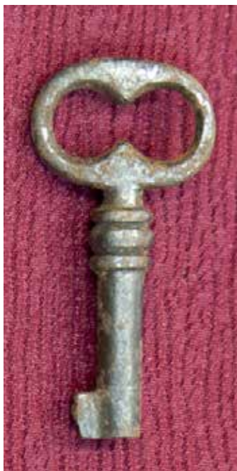
КП 15250 М 1629