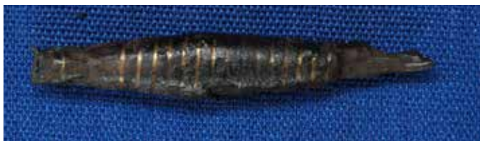
КП 16619 А 2369

Белоозеро, 1993 г., Вост., уч. И-Л, № 225, Белоозерский отряд Онежско-Сухонской экспедиции ИА РАН, С.Д. Захаров