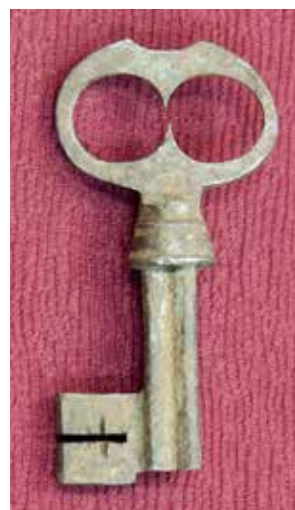
КП 15245 М 1624

Ключ кованый, состоит из четырехгранного с вогнутыми стенками полого стержня (в сечении 1,2×1,2 см). Верхняя часть стержня круглая (украшена полу дынькой) с двумя рельефными полосками. Стержень украшен конусовидным выступом-перехватом с двумя валиками. Бородка широкая квадратная с крестообразной выемкой. Головка ключа овальная, изготовлена из четырехгранной плоской пластины с полукруглой выемкой сверху и восьмерковообразным вырезом внутри головки. Сильно коррозирован.