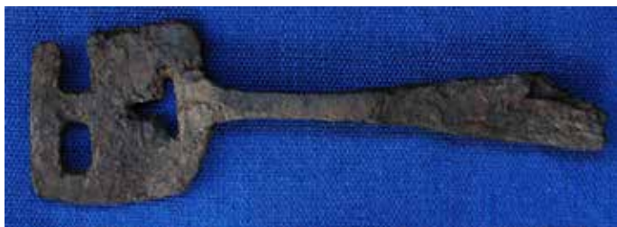
КП 16614 А 2364