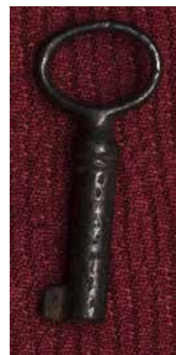
КП 26975 М 2615

Ключ тёмно-серого цвета цельнометаллический с выступающей бородкой. Головка ключа в виде восьмёрки. Стержень круглого сечения, заужен на конце и у основания, с рельефной канавкой между двумя валиками у основания. Бородка ключа прямоугольная без нарезки.