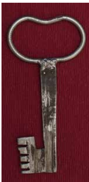
КП 26967 М 2607 КП 26968 М 2608

Ключ из светлого металла с выступающей бородкой, частично деформирован. Головка ключа в виде овала вогнутого в верхней части, круглого сечения. Стержень и бородка цельнометаллические, имеют следы рубки. Стержень в виде плоской четырёхгранной пластины, у основания припаян к головке. Бородка ключа прямоугольная, имеет пять зубчиков и прямоугольный вырез в верхней части.