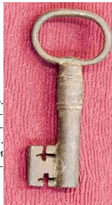
КП 13428 М 1531

Ключ кованый, коррозирован, имеет небольшую деформацию. Стержень ключа полый круглый диаметром 0,8 см с прямоугольной бородкой, на бородке имеются две диагонально расположенные прямоугольные прорези: сверху (0,8 см) и снизу (0,8 см). Вверху стержень украшен двумя кольцеобразными бороздками и небольшой дынькой. Головка ключа овальной формы, изготовлена из четырёхгранной плоской пластины.