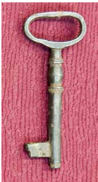
КП 15253 М 1632

Поступил в 1991 году в дар от А.А. Тетерина, с. Горицы, Кирилловского района