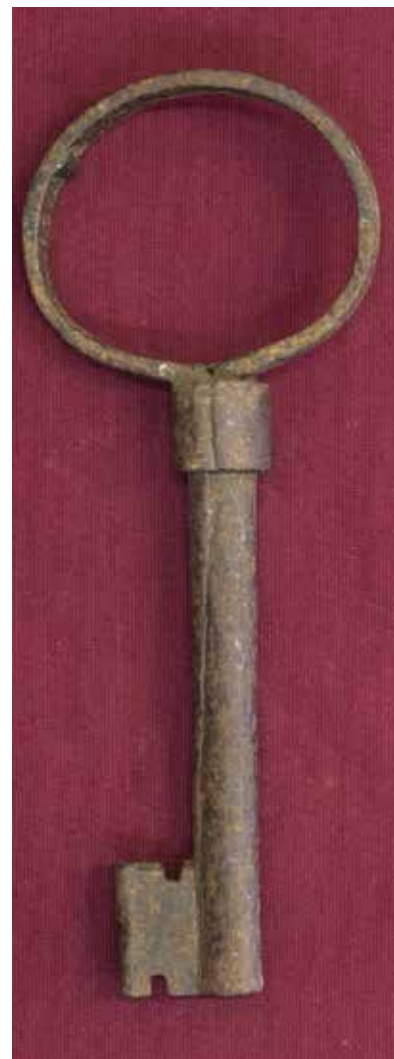
КП 9837 М 1221

Ключ кованый с полым стержнем круглого сечения диаметром 1,4 см, по середине стержня имеется опоясывающее углубление. Головка ключа овальная, из плоской четырёхгранной пластины завершающейся зубчиком внутри головки, соединена со стержнем полый трубкой длиной 1,7 см. Бородка ключа прямоугольная с двумя