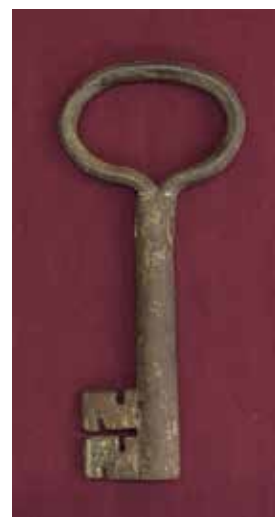
КП 13540 М 1543 КП 26966 М 2606

Ключ кованый. Стержень ключа полый, круглого сечения диаметром 1,4 см, прямоугольная бородка (2,8×2), имеет вырез сверху, в сечении напоминает буквы «Т» с выступами 0,1 и 0,2 см. Головка ключа овальная, изготовлена из приплюснутой пластины с четырьмя нарезками с одной стороны в верхней части и соединена со стержнем полый трубкой длиной 2,1 см. Концы пластины соединяются у основания стержня внутри головки в виде треугольника.