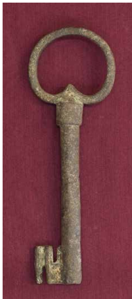
КП 13531 М 1534

Ключ кованый с полым стержнем круглого сечения диаметром 1,5 см, выкован из пластины, имеется шов на месте соединения краёв пластины. Головка овальная сердцевидная, изготовлена из четырехгранной плоской пластины, концы которой соединены у основания и загнуты внутрь головки. Головка соединена со стержнем полый трубкой, изготовленной из плоской пластины длиной 3,2 см. В месте соединения кольца со стержнем видны части многочисленных соединённых при ковке частей ключа. Бородка ключа прямоугольная с двумя диагонально расположенными прямоугольными прорезями: сверху (0,3 см) и снизу (0,8 см), имеет небольшую деформацию. Нижняя замочная часть прямоугольной формы, с двумя прямоугольными за-сечками с 2х сторон.