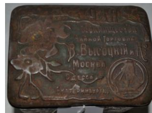
Фото 3. НВ-3943 Коробка чайная Начало XX века.

с парусом. «В. Высоцкий и К о » — компания, которая была одной из крупнейших чаеоторговых фирм. Она основана в Российской империи в середине XIX века Вульфом Янкелевичом Высоцким, уроженцем литовского города Жагаре, который перебрался в Москву в конце 1840-х годов. Товарищество находилось в Лубянско-Ильинских торговых помещениях в Москве. Основной деятельностью торгового дома была оптовая торговля чаем, в основном «кантонским» — чаем, транспортировка которого осуществляется по воде, в отличие от «караванного чая», который транспортировали по суше. Во время революции компания на территории России была национализирована, зарубежная работает по сегодняшний день.