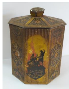
Фото 4. КП-33874 М-3477 Банка чайная Вторая половина XX века.

Обращают на себя внимание сюжеты, изображенные на упаковках Московской чайной фабрики (Фото 4). На банке чайной второй половины XX века на боковых сторонах печатные черные изображения памятников г. Москвы: памятник Юрию Долгорукому, памятник Минину и Пожарскому, памятник М.В. Ломоносову и стертое изображение здания МГУ. На дне выбита надпись: «чаеразвесочная ф-ка им. Ленина г. Москва».