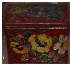
Фото 2. КП-11414 М-1377 Коробка чайная Конец XIX-начало XX века.

торговых фирм: «Петр Соловьев», «Высоцкий и Ко» (Фото 2,3). На изделиях фабрики «Высоцкий и Ко» присутствует эмблема с изображением кораблика