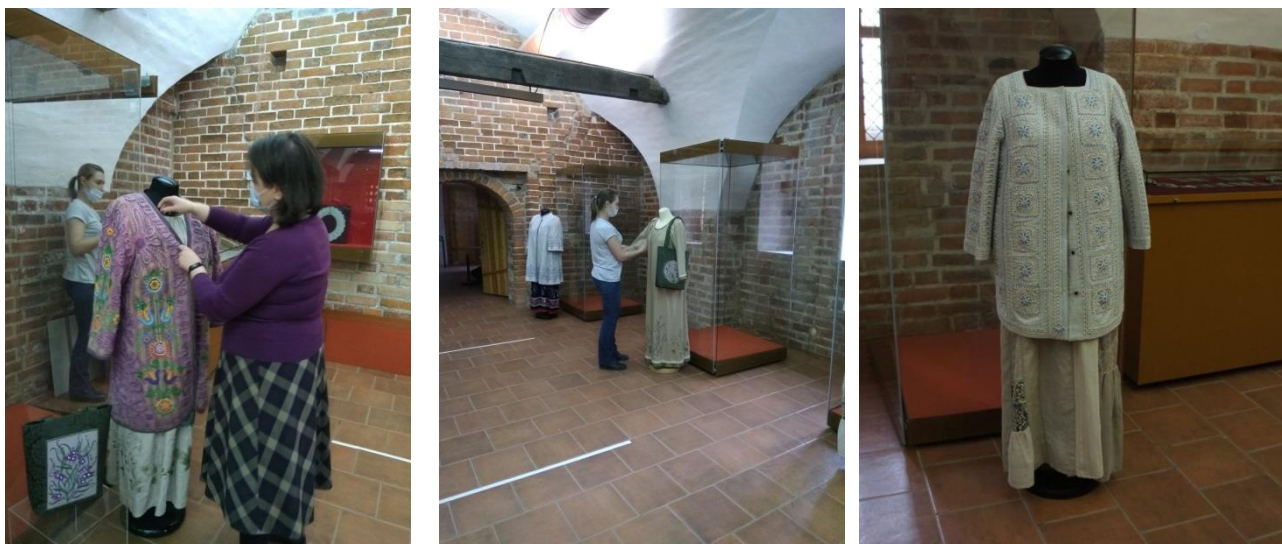
Фото 3. Монтаж выставки «Возвращение к истокам» подклет паперти Трапезной палаты, 2021