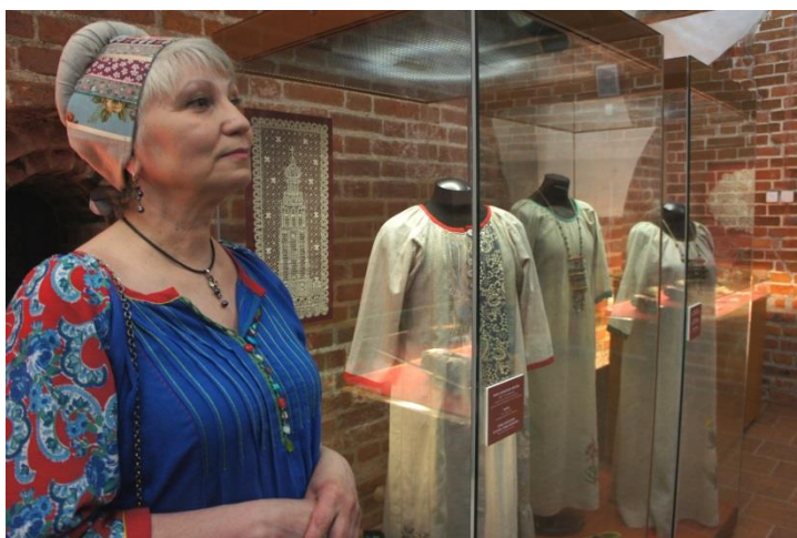
Фото 2. Открытие выставки «Травы Кириллова», 2019

Работы Валентины Лисиной всегда покоряют посетителей своей