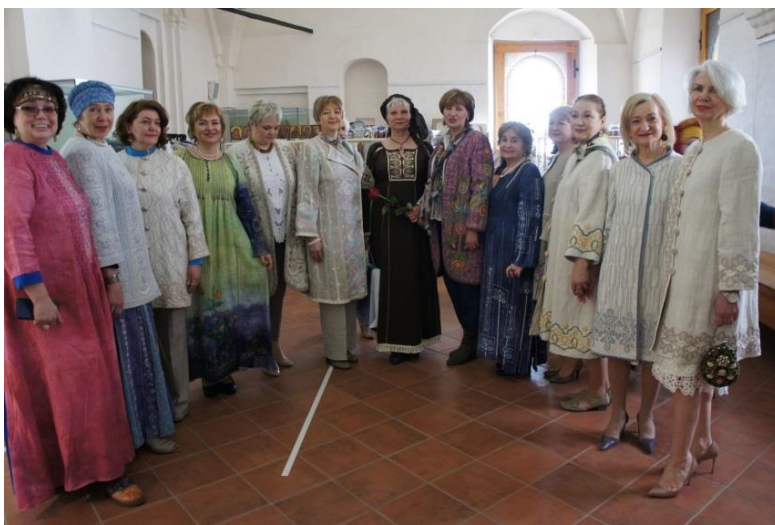
Фото 4. Открытие выставки «Возвращение к истокам»

По словам самого автора, женские летние пальто давно вышли из моды, но они могут вновь стать частью нашего образа, так как добавляют элегантности и женственности.