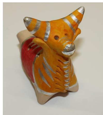
Фото 3. Игрушка-свистулька «Корова», 2019