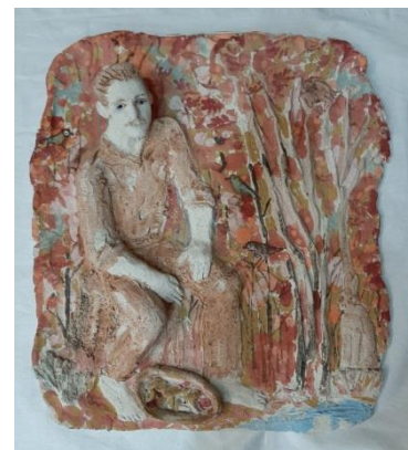
Фото 2. Панно декоративное «Босиком по земле» (портрет А. Яшина), 2012