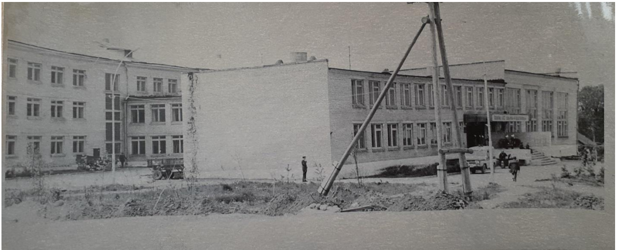
Фото 6. Кирилловская средняя школа, 1981–1982

11 ноября 1974 года для кирилловских школьников открылись двери новой школы и начались занятия.