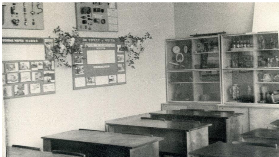
Фото 4. Кабинет машиноведения в новой школе. Май 1975

«Четвёртого ноября 1974 года для жителей города был большой праздник – открытие новой школы на 1000 учащихся. Под звуки духового оркестра к 12 часам у здания школы собрались работники райкома партии, райисполкома, строители ПМК-1074, родители и школьники. Митинг был открыт председателем горисполкома В.Д. Жудиным. Право разрезать ленточку было предоставлено первому секретарю РК КПСС А.И. Валюженичу. Наступает торжественная минута. Ленточка разрезана, и двери школы гостеприимно распахиваются, приглашая своих хозяев принять от строителей этот подарок» 5 , – рассказывает корреспондент местной газеты «Новая жизнь» от 12 ноября 1974 года.