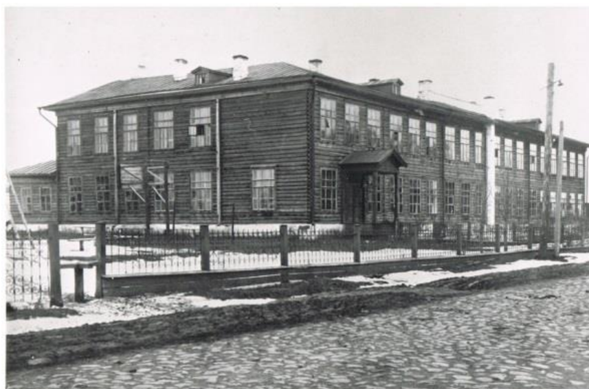
Фото 1. Здание средней школы города Кириллова, построенное в 1940-м году

В 1940 году для школы было построено новое деревянное двухэтажное здание напротив городского сада по адресу Гагарина, 98 (фото 1).