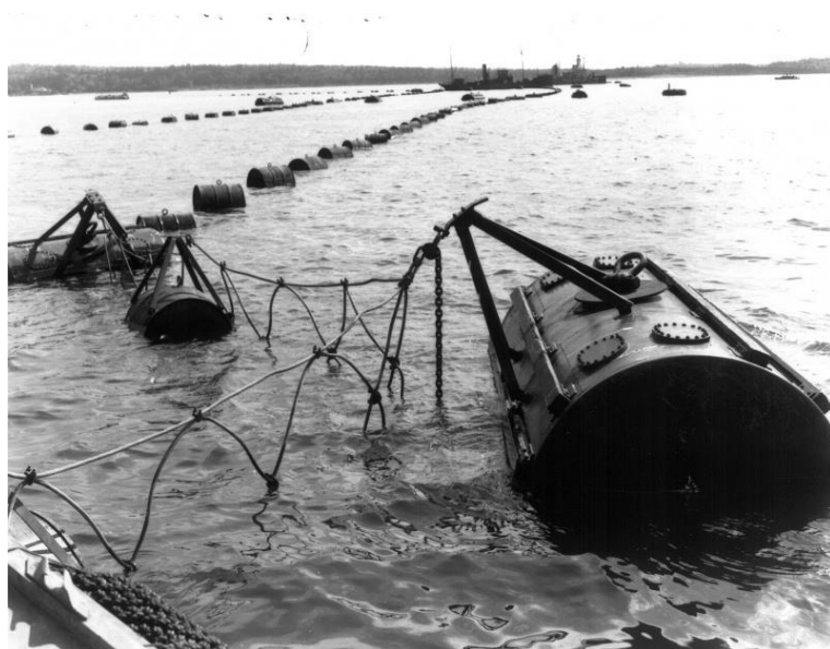
Фото 5. Расстановка противолодочных сетей

в минных заграждениях «Насхорн 1-Х» 72 933 мины в несколько рядов. Между островом Мякилуото, скалой Порккала Колбода и островом Найссаар с 28 марта по 15 мая отряд сетевых заградителей выставил противолодочные сети «Валрос» в два ряда на расстоянии 150–300 м между ними. Был также перекрыт сетями проход между островами Найссаар и Аэгна. В конечном итоге в 1943 году немецкими и финскими кораблями были выставлены несколько систем эшелонированных по глубине минно-сетевых заграждений, перегораживавший весь залив от южного до северного побережья. Главный рубеж был развернут между островом Нарген и мысом Порккала-Удд. Глубина залива здесь составляет 25–60 метров и только в одном месте достигает 80 метров, ширина – 20 морских миль. Советские подлодки неоднократно пытались разрезать или торпедировать эту сеть, но убедились в тщетности этих попыток (Фото 5).