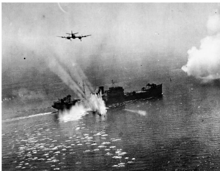
Фото 3. Выход торпедоносца на транспорт