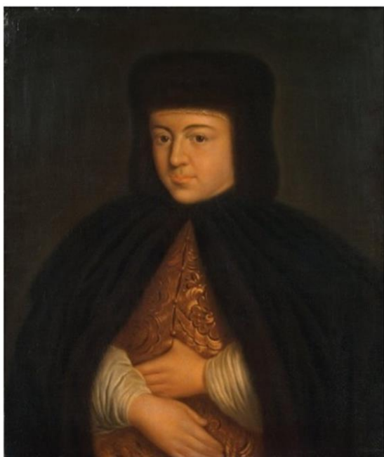
Фото 3. Царица Наталья Кирилловна Нарышкина. Парсуна XVIII в. Неизвестный художник