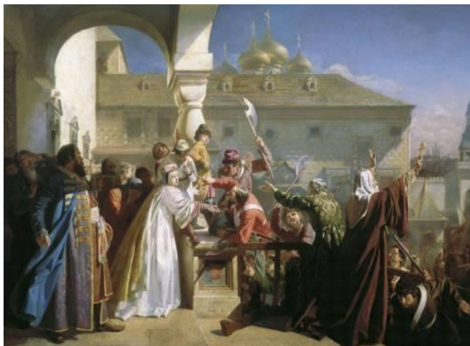
Фото 8. Восстание стрельцов 1682 года. 19 в. Н.Д. Дмитриев - Оренбургский

Смерть царя Фёдора Алексеевича в 1682 году принесла особенно тяжелые последствия для Нарышкиных. С уходом царя возник спор о престолонаследии, вылившийся в страшное восстание стрельцов (фото 8). В течение нескольких дней стрельцы устраивали кровавую расправу в Кремле, требуя выдачи Нарышкиных и Матвеева. Стрелецкое восстание 1682 года унесло из жизни нескольких родственников Петра I. Боярин Артамон Матвеев после попытки усмирить разъяренных стрельцов, был сброшен на копья и изрублен. Сыновья Кирилла Полуектович – Иван Кириллович и Афанасий Кириллович после жестоких пыток были убиты восставшими стрельцами. Стрельцы хотели умертвить и отца царицы Натальи. Лишь со слезами она вымолила ему жизнь, и стрельцы согласились заменить ему смерть на ссылку. 18 мая 1682 года Нарышкин был пострижен в монахи и отправлен в Кирилло-Белозерский монастырь. 22 мая туда же был сослан и младший сын К.П. Нарышкина – Фёдор 9 .