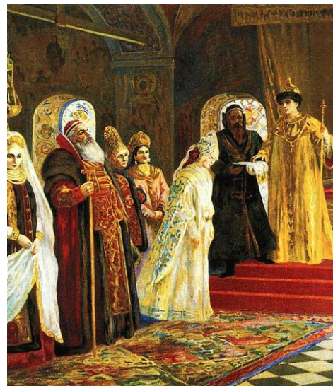
Фото 5. К. Маковский «Выбор невесты» 1887г. Русский музей

Брак царя Алексея Михайловича с дочерью Кирилла Полиектовича – Натальей Кирилловной резко отразился на судьбе Нарышкиных. Вызванный в Москву, Кирилл Полиектович присутствовал на свадьбе своей