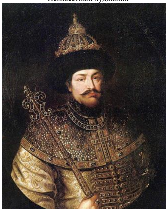
Фото 4. Царь Алексей Михайлович Романов. Парсуна XVIII в. Неизвестный художник

личность. С 12 лет он воспитывался в царском дворце вместе с будущим царем Алексеем. Получил лучшее образование из всех возможных в то время в Московском царстве. Имел природную склонность к изучению языков, неплохо знал основные европейские и частично тюркские языки, что помогло ему позже в дипломатической работе. Ценил и любил европейскую культуру. Первым на Руси ввел в обиход настенную роспись «светского» характера. Имел в своем доме коллекцию немецкой станковой живописи. Первым привез на Русь европейский театр, европейские театральные труппы. Имел огромную библиотеку в своем доме. Создал собственную типографию и первую в Москве аптеку. Также Матвеев прекрасно показал себя на военной службе как военачальник, успешно участвовал в целом ряде военных кампаний. Позже возглавил Посольский приказ и руководил всей внешней политикой страны.