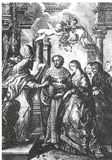
Фото 6. Венчание А.М. Романова с Н.К. Нарышкиной. Европейская гравюра.

дочери, занимая одно из наиболее почетных мест, и тотчас же получил многочисленные подарки и награды. В 1671 году он был пожалован в думные дворяне, затем в окольничие, а в 1672 году, в день рождения царевича Петра, одновременно с Матвеевым, в бояре. В это же время Нарышкин был наделён большими поместьями и довольно значительным по своему времени денежным окладом.