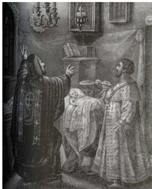
Фото 7. Рождение царевича Петра Алексеевича. 1672 г. Иллюстрация из книги Н.И. Костомарова «Русская история»

При царе Фёдоре Алексеевиче Нарышкин вследствие происков Милославских перестал, по-видимому, принимать какое бы то ни было участие в дворцовой жизни, так как его нет в числе приглашенных на торжественные обеды или на приемы иностранных послов. Исключение составляет лишь Собор, созванный в 1682 году для