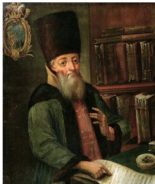
Фото 1. К.П. Нарышкин. Парсуна.

На протяжении нескольких столетий Кирилло-Белозерский монастырь являлся местом заточения и захоронения многих знатных особ. Царская опала, победа одной придворной группировки над другой приводили в ссылку в монастырь представителей известнейших фамилий, в том числе и близких родственников властвующей династии. Как правило, погребения высокородных лиц совершались в главном соборе монастыря, в родовых усыпальницах, за алтарем центральных монастырских храмов. Часть монастырского некрополя в виде надгробных плит можно увидеть сегодня на дорожке, ведущей к церкви преподобного