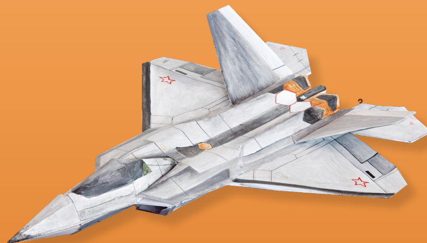
13. Модель самолета, 2019 Дерево, металл, краска 37,0x40,0 см Кирилловская средняя школа, 3 «в» класс