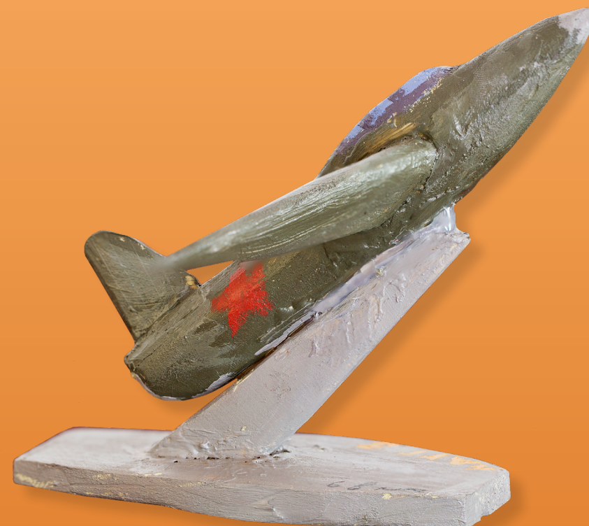
15. Модель самолета, 2019 Дерево 45,0x45,0 см Кирилловская средняя школа, 9 «б» класс