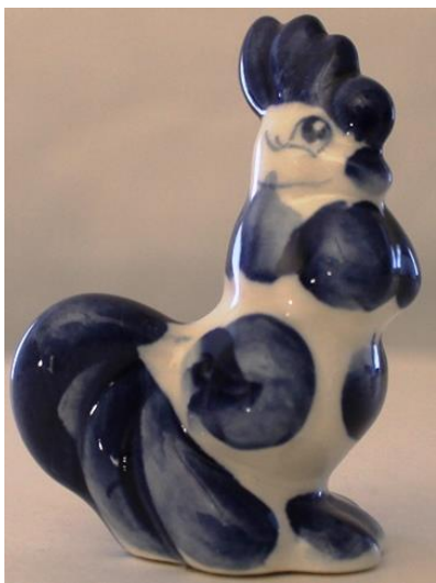
Фото 5. Фигурка "Петушок". 1925–1929

(фото 4). Сладкие петушки на палочках раздавали на праздниках детям. Съеденный петушок защищал малышей от болезней и сглаза.