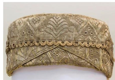
Фото 2. Кокошник. Конец XVIII – начало XIX века

В русских ремёслах образ этой птицы как оберега чаще всего использовали в вышивках на одежде, скатертях, рушниках, полотенцах. Рушниками украшали самый нарядный угол в избе. Встречая дорогих гостей, подносили на полотенце хлеб и соль. Этот древний обычай дошел и до наших дней. И теперь особо важным гостям подносят «хлеб-соль» также на расшитом полотенце. Яркий образец такой вышивки – на полотенце из коллекции «Народные ткани» Кирилло-Белозерского музея-заповедника (фото 1). На нем изображение петуха присутствует многократно: в качестве элементов различных орнаментов и как центральный образ рисунка. Для вышивки рушников использовали нити красных, белых цветов, а позднее стали добавлять зеленые, желтые, синие.