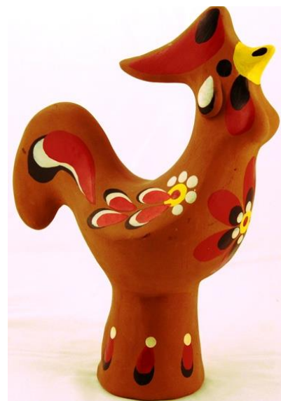
Фото 6. Свистулька "Петушок". 1980-е

Петух недаром любим в народе. Он символизирует солнце, является вестником света, утренней зари. Он хозяин дома, символ очага, достатка, олицетворяет мужское начало. Петух является символом возрождения жизни. Он очень красив, всегда вызывает позитивные эмоции. Это удивительная птица, образ которой прочно закрепился в русской культуре.