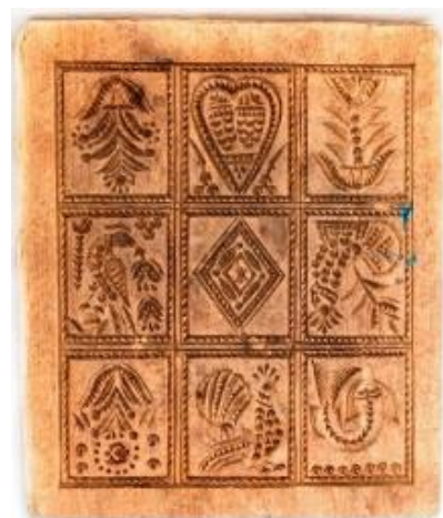
Фото 4. Доска пряничная. Начало XX века

Среди древнейших символов славян изображение петуха почти не встречается в рисунках и резьбе. Зато позднее, уже в христианские времена, эта птица становится любимым символом наших далеких предков. Петуха и курицу древние связывали с плодородием, упоминали в обрядовых и свадебных песнях крестьянки и часто повторяли на пряничных досках. Печатный пряник славен своим неповторимым вкусом и ароматами меда, букета пряностей в составе сухих духов, всевозможных фруктово-ягодных начинок, неповторимыми рисунками растений, животных, птиц. Так, на одном из участков формочной поверхности набоечной пряничной доски начала XX века из собрания Кирилло-Белозерского музея-заповедника изображен петух