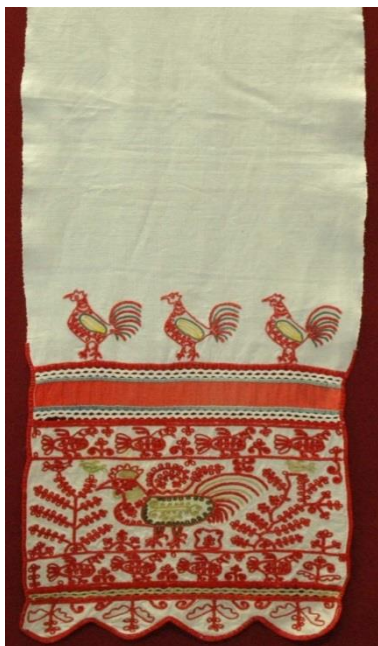
Фото 1. Полотенце. Начало XX века

Петух – один из распространенных образов народной культуры. Он давно и прочно вошёл в фольклор многих народов мира; его почитали как солнечную птицу, «глашатая Солнца».