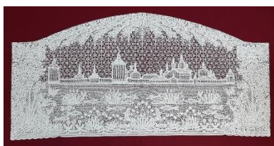
Фото 4. НТ-3853

Горицкому Воскресенскому (фото 3) и Кирилло-Белозерскому монастырям (фото 4). Создание художником подобных тематических произведений – задача непростая.