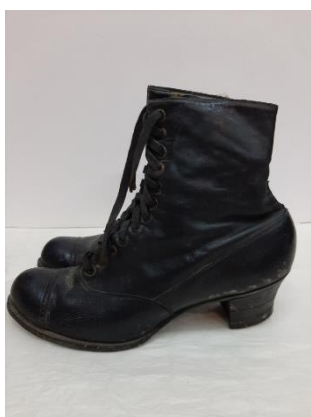
Фото 10. НТ-3815, 3816

первой половине XX веков (фото 10) и по определенным признакам очень схожих с обувью викторианской эпохи (1837–1901). Плотная шнуровка ботинка носила не только декоративный характер, она не давала ботинку «болтаться» и натирать ногу. Ботинки служили своего рода «корсетом» для ноги и подчеркивали её изящество и миниатюрность. В конце XIX – начале XX века в Кирилловском и Белозерском уездах довольно значительных масштабов достигло кожевенное производство, что способствовало развитию сапожного дела. Возможно, эти ботинки изготовил какой-либо сапожный мастер, живший в этой местности. В настоящее время такая обувь в большом разнообразии фасонов снова стала популярна у современных женщин.