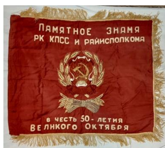
Фото 8. НТ-3852

Интересны предметы, отражающие советскую эпоху. Они поступили от жителей города Кириллов, Кирилловского района. В первую очередь это предметы с символикой: вымпел, знамя (фото 8). Во-вторых, это одежда советского времени (школьная форма девочек и мальчиков, пионерский галстук, манишка, платья, кофты, пиджаки, юбки, жакеты, плащ, фуфайка, чулки, мужское и женское нижнее белье и т. п). В фондах музея существуют пробелы, связанные с советской бытовой историей. Многие используемые ранее предметы исчезают из жизни современных людей, поэтому их сохранение – задача музея.