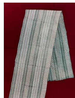
Фото 7. НТ-3889

Два вновь поступивших предмета из коллекции «Народные ткани» (полотенца) выполнены мастером народных художественных промыслов Вологодской области Еленой Николаевной Короткой с использованием мерного кружева. Они представляют собой образец традиционного ремесла – браного ткачества и, несомненно, прекрасно дополняют коллекцию полотенец в собрании музея-заповедника, могут послужить интересным материалом для изучения традиций Русского Севера (фото 6).