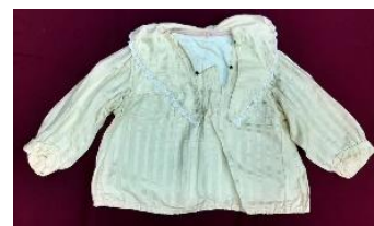
Фото 2. НТ-3802

Обращает на себя внимание предмет, приобретенный у Г.Г. Савиной: кофта середины XX века (фото 2). Кофта сшита из хлопчатобумажной и шелковой ткани, украшена фабричным кружевом. Она также представляет интерес, так как, начиная с середины XX столетия, подобные предметы начинают выходить из обихода, и в настоящее время их можно увидеть в основном только в собраниях музеев.