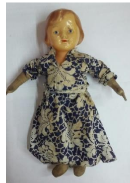
Фото 1. НТ-3772

В конце декабря 2018 года поступил интересный экспонат – кукла фабричного производства, датируемая 1940–1950-ми годами (фото 1). Голова куклы изготовлена из целлулоида, тело тряпичное. Одета игрушка в платье из хлопчатобумажной ткани. Кукла находилась в доме, который был построен в Кириллове в 1887 году. Эта игрушка рассказывает о досуге советских детей. Подобных предметов в коллекции музея-заповедника практически нет, но для строительства тематических выставок и экспозиций они бывают необходимы.