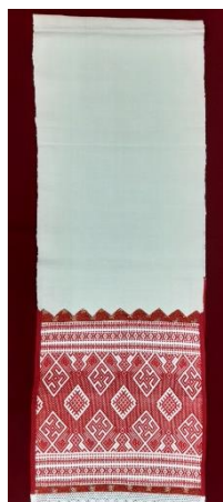
Фото 6. НТ-3781

создано панно «Казанская башня» (фото 5), поступившее в собрание музея-заповедника в 2019 году.