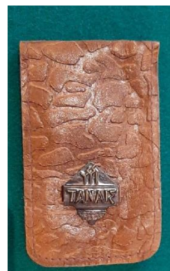
Фото 9. НТ-3896

Васильевны Церковницкой. Памятники разного времени, большая часть датируется 1930–1980-ми годами. В основном это предметы быта и предметы разнообразного назначения, находившиеся ранее в доме Церковницких (подзоры, подвесы с кровати, фрагменты кружева, наволочка, накомодник, скатерти, салфетка, накидка, дорожка, кошелек, визитница (фото 9), зонт, сумка и прочее). Кроме того, собрание музея-заповедника пополнилось одеждой и обувью, принадлежавших семье Церковницких. Хочется обратить внимание на две пары женских ботинок на шнуровке, популярных в конце XIX –