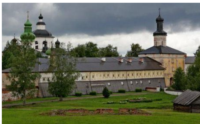
Илл. 2. Современный вид Солодеженного сушила с напольной стороны

Во время работы совместной археологической экспедиции Ленинградского отделения Института археологии АН СССР, исторического факультета Ленинградского университета и Кирилло-Белозерского музея летом 1971 года было проведено обследование территории «Острога», в том числе и солодеженного сушила. Тогда