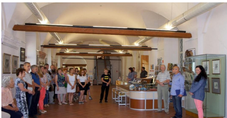
Фото 3. На открытии выставки «Неустойчивое равновесие». 2016

Название юбилейной выставки в 2016 году вдохновлено физическими терминами – «Неустойчивое равновесие». На ее открытии собрались родные