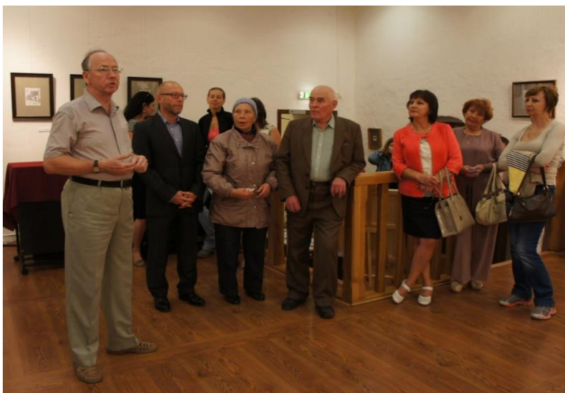
Фото 2. На открытии выставки «Графика». 2013

Большое количество работ было написано Михаилом Матвеевым после посещения разных городов нашей страны. На выставке были представлены архитектурные памятники Астрахани, Валаама, Пскова, Ярославля, Печор, Москвы, Великого Новгорода, Переславля-Залесского. Побывав в разных странах, он создал заграничную серию, начиная от Копенгагена и Праги и заканчивая Венецией и монастырем великомученицы Екатерины на Синае. На выставке «Графика. Михаил Матвеев» было представлено 78 работ, написанных с 1994 по 2005 годы. Каждый посетитель этой выставки нашел и открыл для себя здесь что-то новое.