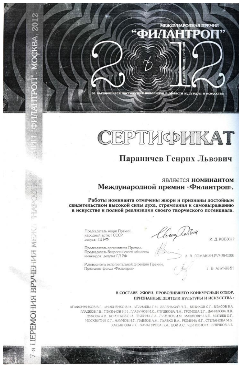
Фото 7. Сертификат номинанта премии «Филантроп» за 2012 год