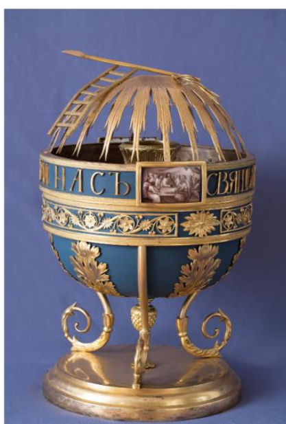
Фото 1. Даросушительница из коллекции Кирилло-Белозерского музея

В 2017 году на выставке «Даросушительница. XIX век» в Архимандричьих кельях Кирилло-Белозерского музея-заповедника впервые был представлен интересный прибор – даросушительница (КБИАХМ М-479), входившая в состав предметов церковного обихода (Фото 1). Экспонат датирован XIX веком. Даросушительница служила для приготовления запасных святых даров. Судя по фондовым документам, она принадлежала Кирилло-Белозерскому монастырю и вошла в музейное собрание после его упразднения. Даросушительницы очень редки в музейных коллекциях: так, в Кирилло-Белозерском музее-заповеднике их только две. Данный памятник был отреставрирован в 2017 году в Вологодском филиале ВХНРЦ им. И.Э. Грабаря (Фото 1). Вторая даросушительница также имеет множество утрат и нуждается в реставрации.