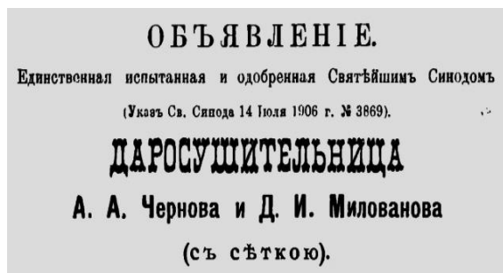
Фото 4. Объявление о продаже даросушительницы