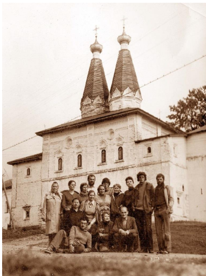
Фото 2. Группа реставраторов и сотрудников музея. 1981