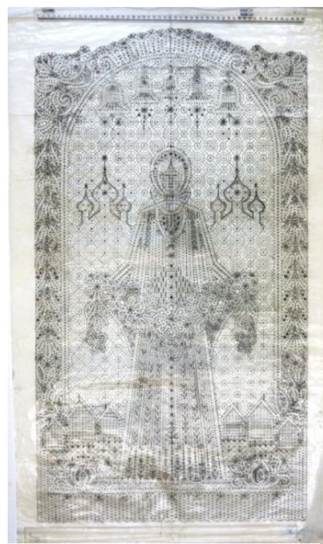
Технический рисунок к панно «Победа». 2012 КП-28658