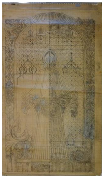
Авторский рисунок к панно «Победа». 2011 КП-28972

Главным в творчестве Галины Никитичны становится обогащенная фактура, сложные ритмические связи всех элементов, безупречное качество исполнения. Ее творчество отличается целостностью, индивидуальностью авторской манеры. Она с особой любовью работает над повествовательными сюжетами, внимательно разрабатывает детали, стремится к их максимальной выразительности.