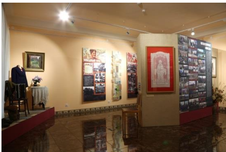
Выставка «Поклонимся Великим тем годам». Народный дом, 2016

Вот что говорит сам автор о своей работе: «Война прошла по стране, по земле, по человеческим судьбам, разрушая, уничтожая, испепеляя дотла. Разрушенные города, сожженные деревья, растоптанные поля. Упали звезды. На погоны. Награды. Обелиски. Склонились лавровые листья в наградах героев, в венках павшим. Победа пришла весной. Нелегкая. Выстраданная. Долгожданная. Победа, оплаченная большой кровью, невысказанным горем, слезами, тяжелым трудом. В женском образе она идёт по многострадальной земле. Она несет на руках, цветущий венок. В её венке память и скорбь о павших. В её венке первые ростки-начало новой жизни. В её сарафане собраны хлебные колосья, они прорастут новым хлебом, они оживят поля, они вернут земле дыхание, сделают её вновь радостной и цветущей, такой, какой она и должна быть. Пустые дома, они отстроятся, оживут, наполнятся детскими голосами. Вернутся птицы. Недаром по Земле идёт Женщина-Мать-Победа! Цветущие побеги устремились вверх, к новой жизни. Звонят колокола как Память о павших, заставляя живых хранить Память.