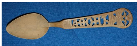
Фото 5. Ложка. XIX век. Д-291

Интересна ложка с резной надписью «АФОНЬ» (Фото 5). Она имеет неглубокий гладкий черпак яйцевидной формы с заостренным узким концом. Ручка резная на конце ее изображен герб Российской империи – двуглавый орел с царской короной. Посередине ручки вырезано слово «АФОНЬ», на буквах нанесены мелкие точки. Принадлежала ложка Чмутовой Елене Андреевне. По ее словам, она пешком ходила на Афон, откуда и принесла ложку.