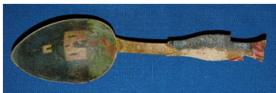
Фото 8. Ложка. Конец XIX века. Д-1021

стенке ложки надпись «На память от троицы». Ложка изготовлена в конце XIX века в Троице-Сергиевой лавре.