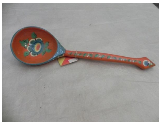
Фото 3. Ложка. 2001 год. Д-1406