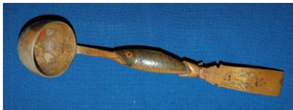
Фото 9. Ложка-черпак. Конец XIX – начало XX века. Д-23

Ложка-черпак (Фото 9) представляет собой большую ложку с длинной рукоятью. Черенок представляет собой человеческую руку с широким рукавом, украшенным росписью. В руке хвост рыбы, которая держит во рту черенок с черпаком. Черпак глубокий, круглой формы, внутри изображены букет цветов из красных, желтых и синих роз.