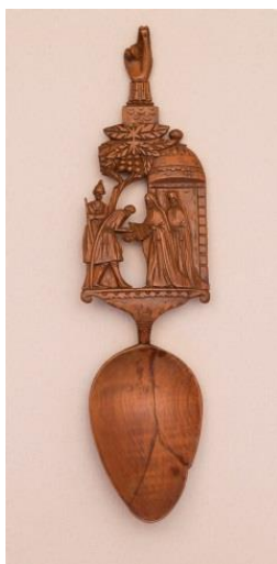
Фото 7. Ложка. XIX век. Д-290

Ложка XIX века «Благословение Сергием Радонежским Дмитрия Донского на битву с татарами» (фото 7). На черенке ложки вырезаны на фоне церкви две фигуры в монашеской одежде, под сенью виноградных лоз два воина. Ручка заканчивается сложенными для благословения перстами.