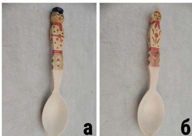
Фото 2. Сувенирные ложки. 1984 год. а – «Иван» Д-1002; б – «Марья» Д-1003

выражение «бить баклуши», которое первоначально означало: делать очень несложное дело, а позже приобрело иной смысл – бездельничать, празднично проводить время. Ложкарь делал собственно саму ложку. Сначала он выдалбливал (выбирал) теслом полость черпачка до определенной глубины, после скобелем подчищал изнутри (Фото 1в). На следующей стадии мастер ножом срезал лишнее, обрабатывал, "завивал" черенок (Фото 1г). Красильщик отделывал уже готовую ложку. Изделия получались гладкими и аккуратными (Фото 2).