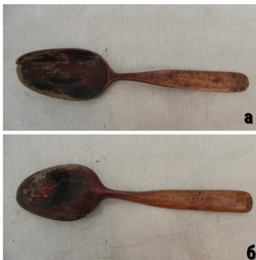
Фото 4. Ложка. Конец XIX века. Д-357

Ложка имеет округлый черпак, с длинным черенком с треугольным завершением. Роспись по всей поверхности ложки: на лицевой стороне черенка – стилизованный орнамент из листьев. Внутри черпака – четырех лепестковый цветок. На оборотной стороне два четырех лепестковых цветка желтые с синим по коричневому фону.