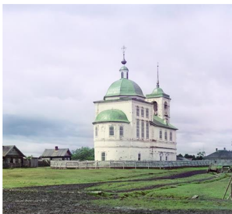
Фото 1. Церковь Вознесения Господня. 1909

Древний город Белозерск привлекает путешественников своей многовековой историей. Приезжающие видят величественное Белое озеро, купеческие дома на тихих