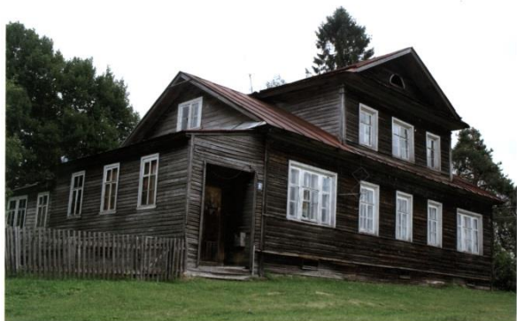
Фото 1. Дом Церковницких. 2013

В 2013 году Кирилло-Белозерский музей-заповедник получил в дар здание по улице Февральской, дом 6 (Фото 1). Более ста лет в этом доме проживали представители одной