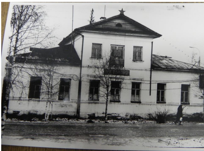
Фото 7. Районный узел связи, улица Пролетарская, дом 16. 1977

включила в себя и функции телевидения. С 1961 года редакция переименована в Комитет по радиовещанию и телевидению при Вологодском облисполкоме.