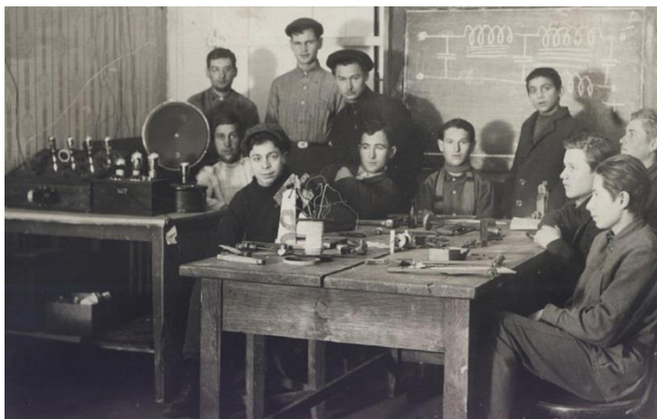
Фото 2. Кружок радиолюбителей. 1920-е