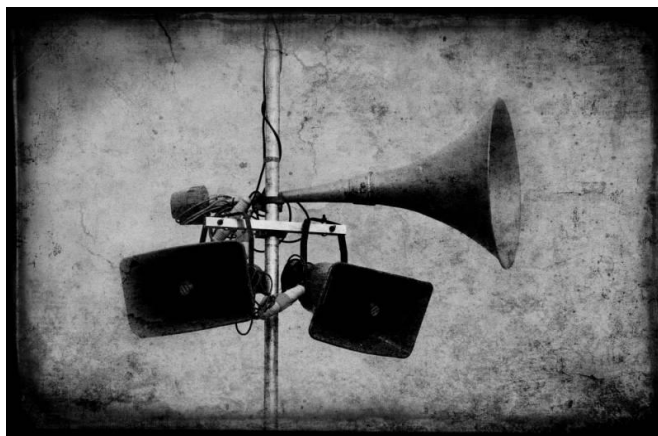
Фото 3. Уличные репродукторы начали устанавливать в 1920-е годы

В марте 1929 года, когда Череповец уже был окружным центром Ленинградской области, окружное отделение рабпросвета «начало развертывать работу по снабжению школьных работников деревни радиоприемниками по заявкам последних».