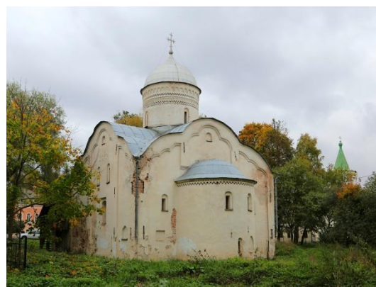
Иллюстрация 6. Церковь Климента в Новгороде Великом

памятников могут служить церковь Василия на Горке (1415) в Пскове (илл. 5) и церковь Климента (1520) в Новгороде Великом (илл. 6). Традиции украшения фасадов узорной кладкой возникли в этих местах еще в домонгольские времена, потому что местная плинфа в отличие от черниговского сланца не поддавалась никакой художественной обработке.