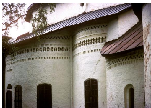
Иллюстрация 4. Фасад алтаря собора Успения Богородицы Кирилло-Белозерского монастыря

К ним можно отнести четырехстолпный тип храма, ступенчато повышенные арки под барабаном, яруса кокошников, придающие храму стройность и устремленность к небу. Московские традиции также можно видеть и в декоративных орнаментальных поясах, богато украшающих