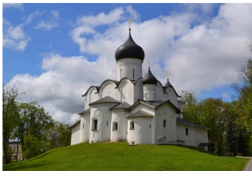
Иллюстрация 5. Церковь Василия на Горке в Пскове

Как известно, Прохор стоял во главе двадцати белокаменщиков, некоторые из них