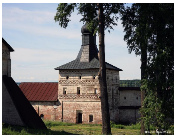
Иллюстрация 7. Глухая башня Кирилло-Белозерского монастыря

Перед строителями первой кирилловской крепости стояла непростая задача создания, с одной стороны, грозного фортификационного комплекса, способного выдержать штурмы и длительную осаду, с другой – изящной монастырской огады, органично вписанной в архитектурный храмовый ансамбль. Эта проблема была блестяще разрешена простым художественным приемом. Все плоскости крепостных стен и башен украшены узорной кирпичной кладкой,