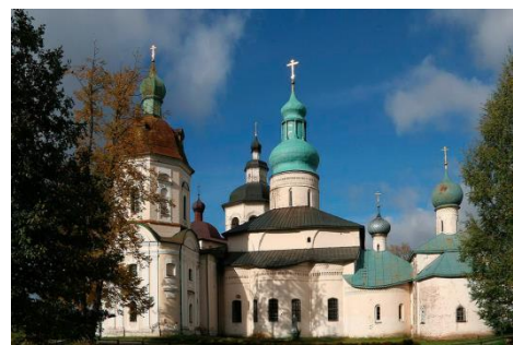
Иллюстрация 1. Собор Успения Богородицы Кирилло-Белозерского монастыря

Каменное ожерелье «Старого города», возведенное вокруг Кирилло-Белозерского монастыря в конце XVI века, стало по тому времени одной из крупнейших крепостей Русского Севера. Безжалостное время не сохранило имена мастеров, до нас дошли отрывочные сведения только об организаторе этого строительства, монастырском старце Леониде Ширшове. Однако внимательно приглядевшись к декору, украшающий фасады древних фортификационных сооружений, мы можем кое-что узнать о людях, поднимающих в высоту древние стены и башни.