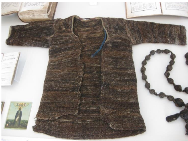
Ил. 6. Власяница Преподобного Нила Сорского

плоточную вязку спицами. Однако самый низ изделия связан другим типом вязки, похожим на классическое вязание иглой времен раннего и позднего средневековья. Наиболее приближенный тип вязания к этому фрагменту изделия – так называемое «Русское кольцевое плетение», описанное в книге Адольфа Фолькмана «Русское кольцевое плетение, или плетение одной нитью». Автор использует термин «кольцевое плетение» чтобы отличить эту