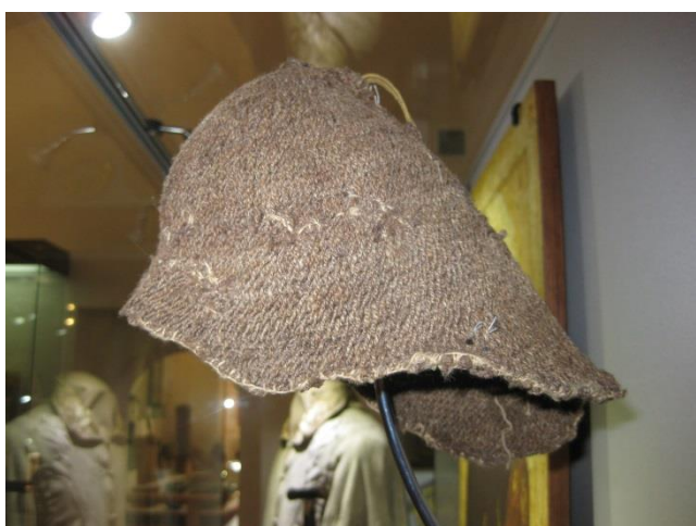
Ил. 3. Клобук преподобного Кирилла Белозерского

кругового текстиля является его высокая прочность. Обрыв нити в одном месте не приводит к общему разрыву всего изделия и позволяет продолжить его практическое применение; таким образом, изделие не распускается 4 . Несколькими петлями создается длина ряда, затем по спирали вывязываются последующие ряды, по необходимости с большим или меньшим количеством петель, аналогично вязанию крючком. Однако полотно, связанное при помощи крючка и спиц, не имеет столь высокой прочности и износостойкости. Это связано с тем, что ряды формируются другим способом, и при обрыве рабочей нити изделие может распуститься полностью. Петли в вязаном полотне клобука Кирилла и власянице Нила соединены таким образом, что изделие не может распуститься из-за обрыва рабочей нити. Эта особенность указывает на изготовление изделий при помощи техники вязания иглой.