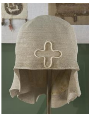
Ил. 4. Белый клобук Василия Калики. XIV век. Новгородский Государственный музей- заповедник. НГМ КП 3766

принадлежавшая католическому святому Симеону Трирскому, жившему в X–XI веках. По внешнему виду и форме реликвия из Кирилло-Белозерского музея близка к головному убору из Трира, но по стилю вязания схожа с клобуком из Новгородского музея: похожие вертикальные стежки, скрепляющие ряды изделия. Однако «белый клобук» Василия Калики был изготовлен в технике вязания тремя иглами. Эта техника описывается в статье кандидата искусствоведения М.М. Савенковой «Вязаный текстиль средневекового Новгорода» 7 . Часть этой работы была посвящена восстановлению способов выработки вязаного текстиля. С помощью различных методов исследования были созданы экспериментальные модели, подтвердившие технику переплетения нитей определенными способами в определенных изделиях, в данном случае была восстановлена техника вязания «белого клобука» с помощью трех игл. Полотно, связанное таким способом, не сильно отличается от вязания одной иглой: изделие имеет такую же прочность, переплетение нитей и соединение петель.