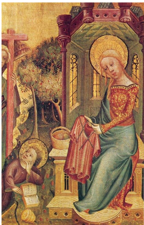
Ил. 1 Посещение ангелов. Роспись правого крыла алтаря из Букстехуде. Автор Бертрам из Миндена, конец XIV – начало XV века. Кунстхалле, Гамбург

Вязание иглой, называемое также наальбиндинг (от древнескандинавского Nålebinding «вязание иглой») – древнее ремесло; оно на столетия старше привычных для многих спиц и крючка. Доподлинно неизвестно, кто и когда сделал первый стежок. В нескольких странах Востока есть предполагаемые доказательства использования вязаных предметов одежды в древнейшие времена (около XIX века до нашей эры), в частности – изображения на стенах гробниц и дворцов. Древнейшие вязаные изделия, обнаруженные на территории Старого света, относятся к IV–V веку нашей эры 1 . Очень много вязаных вещей также было найдено в Египте и на территории бывшей Римской Империи. В этих древних государствах были распространены двупалые вязаные носки, приспособленные для специальной обуви – сандалий. Но самое широкое распространение вязание иглой получило в эпоху викингов (VIII–XI века). Именно этим временным периодом датируется