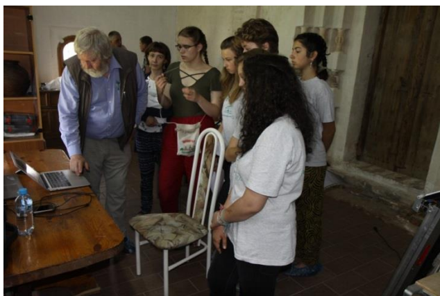
Фото 8. Сотрудник Курчатовского института показывает школьникам результаты работы по исследованию свитков в соборе

Две недели в июле провела в Ферапонтово группа учеников школы № 1514 города Москвы. Учителя этой школы уже много лет сотрудничают с нашим музеем. Многие школьники во второй или в третий раз приезжают летом в Ферапонтово. Некоторые уже стали студентами, поступив в престижные ВУЗы, решили провести летний отдых в живописных окрестностях древнего монастыря. Для школьников и преподавателей была проведена обзорная экскурсия и прочитаны четыре лекции по сюжетам стенописи Дионисия