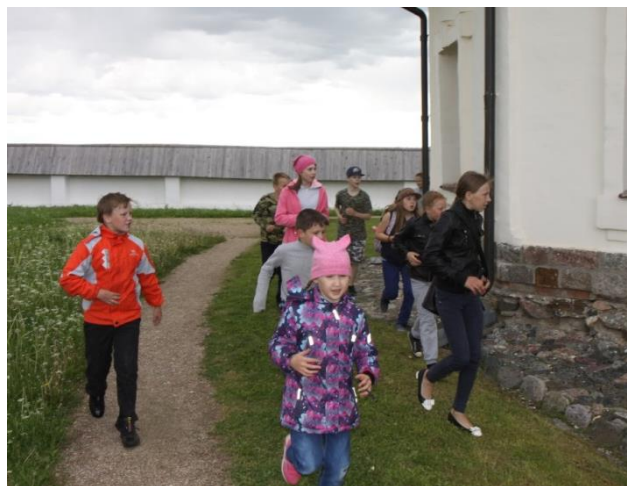
Фото 7. Николоторжские школьники в игре

После ферапонтовских школьников, наш музей принимал учащихся из села Никольский Торжок. Для них была проведена лекция об архитектуре Ферапонтова