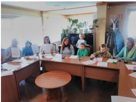
Фото 2. Мастер-класс «каллиграфия Дионисия»

В праздничные дни февраля, посвященные Дню Защитника Отечества, наш музей посетила частная группа в количестве двадцати одного человека – родителей и детей из города Москвы. Для группы были проведены две лекции и два мастер-класса (фото 2).