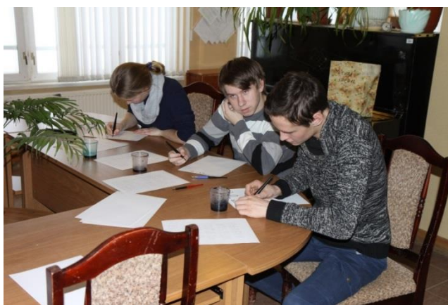
Фото 1. Студенты колледжа на мастер-классе по каллиграфии

Первые участники просветительского проекта в прошедшем году были студентами Вологодского областного колледжа культуры и туризма. Учащиеся этого заведения активно сотрудничают с нашим музеем: проводят мероприятия, принимают участие в конкурсах, проходят учебную практику. В музее они могут узнать многие тонкости того, что, возможно, станет их будущей профессией. Поэтому в это раз для трех студентов была проведена лекция о научной работе музея, а также два мастер-класса: по каллиграфии (фото 1) и технологии фресковой живописи.