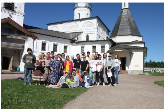
Фото 9. Школьники, преподаватели школ № 1514 и 1505 и сотрудники музея

проводили консультации для желающих на территории музея, в экспозициях и соборе. Все участники были награждены дипломами и подарками (фото 9).