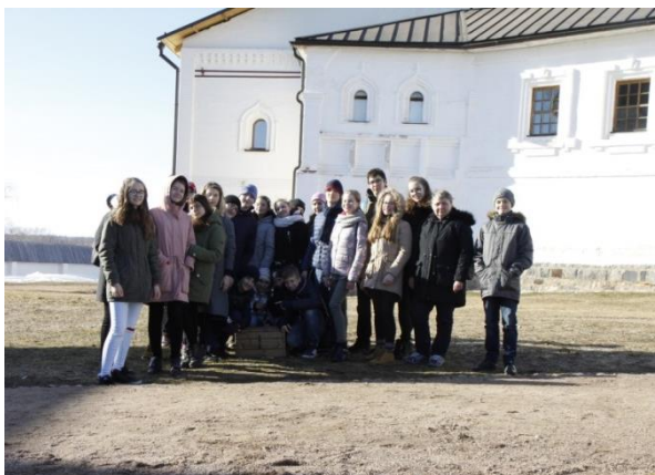
Фото 4. Московские школьники с «кладом»

В первые теплые апрельские дни «Школа Дионисия» проводила для группы столичных школьников экскурсию и подвижную игру «Монастырский клад». После обзорной экскурсии состоялась подвижная игра с вопросами на знание истории и архитектуры монастыря, а также на внимание к отдельным экспонатам музея. Иногда для того чтобы