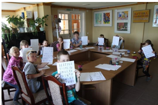
Фото 6. Ферапонтовские школьники на мастер-классе

кириллицы, овладели некоторыми приемами каллиграфического письма из стенописи и икон Дионисия.