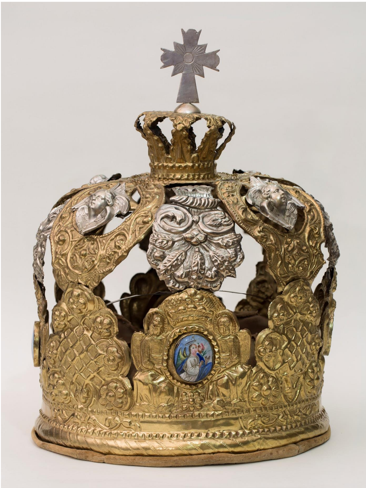
Фото 5. Венец брачный. XVIII век. М-505/2 (после реставрации)