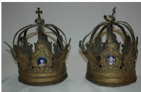
Фото 1. Венцы брачные. XVIII век. М-505/1-2 (до реставрации)

По форме венцы представляют собой царскую корону (один с образом Спасителя, другой – Божией Матери), которая возлагается на голову жениха и невесты при совершении таинства брака. Они напоминают о чистоте и царском достоинстве первосозданной человеческой чете – Адама и Евы, и знаменуют собою венцы, уготованные супругам в Царстве Небесном по окончании их земной жизни на пути к спасению.