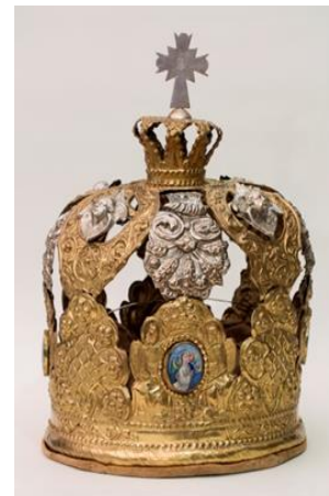
Фото 4. Венец брачный. XVIII век. М-505/2 (после реставрации)

с помощью мастики на основе сухих художественных пигментов и клея Параллоид В-72 в ацетоне. Подклейка разрыва на поврежденном корпусе из-под эмали проводилась на эпоксидный клей. На венце под номером М-505/2 сохранилась бархатная подкладка, сшитая из четырех клиньев (фото 3). Подкладка была сильно загрязнена, имелись незначительные утраты и сечения бархатной ткани, разрывы монтировочных швов. Реставрация была выполнена Масленниковой Юлией Сергеевной, реставратором ВФ ВХНРЦ. Были сделаны пробы на текучесть красителя бархатной и х/б ткани с помощью 3% водного раствора СМС «Аист-Кашемир». Ослабление пятен ржавчины проводились бензином, 3% водным раствором лимонной кислоты, мылом «Антипятин» и глицерином. Общая водная очистка ткани осуществлялась методом тампонирования греческой губкой 3% водным раствором СМС «Аист-Кашемир» с последующей просушкой на фильтровальной бумаге. Последним этапом реставрации был подбор и тонирование дублировочного материала и монтаж подкладки на венец (фото 4, 5 – в высоком разрешении). У венца М-505/1 подкладка не сохранилась.