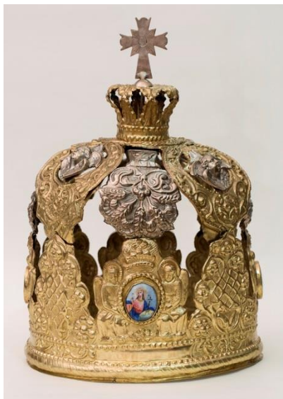
Фото 2. Венец брачный. XVIII век. М-505/1 (после реставрации)

клепочного соединения. В фонды музея-заповедника предметы поступили из Кирилло-Белозерского монастыря в 1938 году и находились в аварийном состоянии.