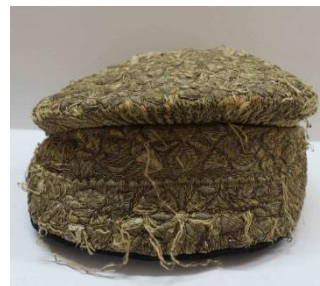
Фото 1. НТ-3332

Интересны предметы, переданные музеем-заповеднику жительницей Кириллова: сборник начала XX века (фото 1) и фрагмент подола к женской рубашке, датируемый первой половиной XX века. Сборник – это кокошник, широко бытовавший на Русском Севере. Название отражает особенности покроя: «сборник», «борушка», «моршень» – сморщенные, имеющие складки (боры). Очелье и донце головного убора украшено вышивкой из золотных или серебряных нитей.