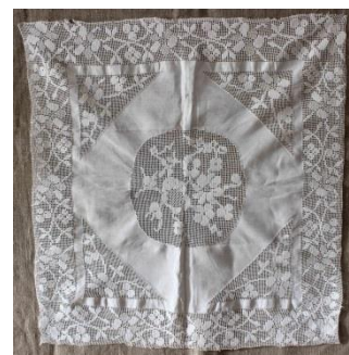
Фото 4. НТ-3305

От жительницы Калининграда Татьяны Анатольевны Потемкиной поступили предметы, принадлежавшие ее матери Вере Павловне Денисовой, которая жила в Кириллове: полотенца, простынь, заготовка для наволочки (фото 4), рубаха и воротник, выполненные из хлопчатобумажной ткани и нитей, украшенные вышивкой, вязаными элементами. Все предметы были изготовлены и бытовали в первой половине XX века.