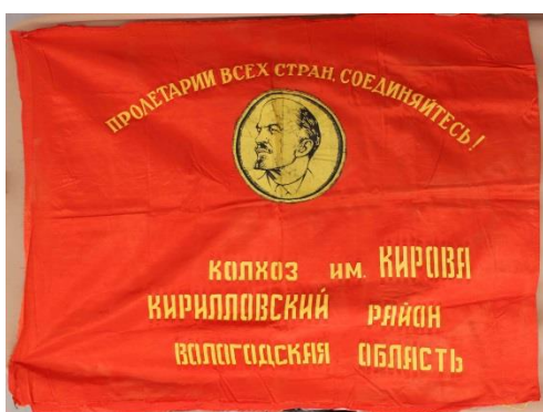
Фото 7. НТ-3328