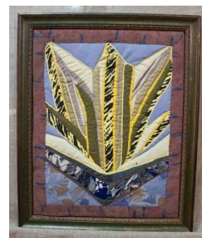
Фото 2. НТ-3545

По завещанию семьи Церковницких в коллекцию «Народные ткани» поступило более 100 предметов. В основном это личные вещи Татьяны Васильевны и Константина Сергеевича: одежда, обувь, предметы быта и предметы разнообразного назначения, находившиеся ранее в доме Церковницких (платья, кофты, рубашки, галстуки, брюки, полотенца, скатерти, подзоры, подвесы с кровати, занавески, фрагменты кружева, мерное кружево, газетница, сумки, кошельки, занавески, панно (фото 2), подстаканники, салфетки, сумки, чемоданы и прочие). Памятники разновременные, большая часть датируется 1930–1980-ми годами.