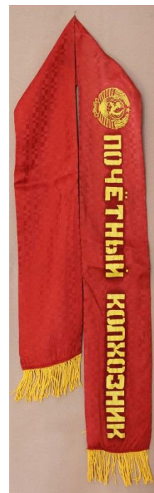
Фото 8. НТ-3322

Среди предметов, поступивших в конце 2017 года, обращает на себя внимание кружевное панно «Горицкий монастырь» (фото 10), созданное знаменитой вологодской художницей Галиной Никитичной Мамровской, проработавшей более двадцати лет в Вологодском кружевном объединении «Снежинка». Заслуженный художник России Г.Н. Мамровская занимает ведущее место среди художников кружевного промысла России. В настоящее время Галина Никитична создает новые высокохудожественные произведения. Ее работы всегда продуманы, глубоко патриотичны, отличаются духовной наполненностью образов, многие уже стали классикой. На панно изображены памятники Горицкого Воскресенского монастыря. Все в этом произведении символично: внизу завитки символизируют волны реки Шексны, сверху полосы полотнянки символизируют склоны горы Мауры, на которой растут ели, кусты, цветы. Церкви и их архитектурные детали орнаментированы различными видами плетешковых решеток с отвивными петельками и насновками. Панно дополнит уникальную коллекцию авторских кружевных произведений, посвященных памятникам архитектуры Вологодского края.