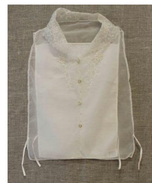
Фото 5. НТ-3366

Еще один интересный экспонат, поступивший в коллекцию «Народные ткани» – манишка с вышивкой по вороту и груди и завязками с боков (фото 5). Спинка у нее сшита из белой хлопчатобумажной ткани, а передняя часть и воротничок из капроновой ткани белого цвета. В советское время женские манишки использовались как элемент отделки, одновременно заменяя блузку или жилет. Надевались они под жакет, костюм, платье с глубоким вырезом.