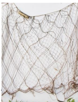
Фото 9. НТ-3623