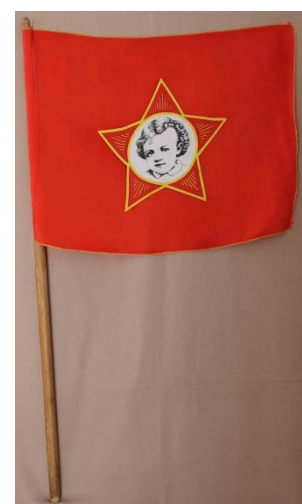
Фото 6. НТ-3310