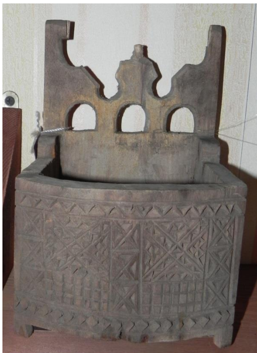
Фото 8. Солоница. Начало XX века. Д-1808

Солонки декорировали не только росписью, но и резьбой. Резьба – самый древний способ украшения изделий из древесины 10 Красиво смотрятся солоницы по форме в виде кресла, украшенные превосходной трехгранновыемчатой резьбой. (Фото 8). Геометрический мелкий узор покрывал все стенки солониц. Особенно нарядно резали спинку кресла, куда часто рядом с трехгранновыемчатой вводилась и сквозная резьба. Резьба солониц не только служила элементом украшения, но и заключала в себе глубокое содержание. Известно, что в узоры выемчатой резьбы основным являлось изображение круга, производимых от него розеток, сегментов