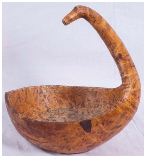
Фото 4. Солонка-лебедушка. Конец XIX века. Д-1749

В солонках XIX века проявились тенденции к упрощению и снижению образа. Вместо стройного лебедя иногда появляется смешная уточка, с короткой низкой шейкой, курносый большим клювом на толстой подпорке и с корпусом, утратившим благородство очертаний. Изображение птицы утрачивает скульптурную выразительность, теряется четкость границ между частями. Сходство с изображением птицы только отдаленное. Шея, голова и клюв вместе с подпоркой становятся почти одной толщины, напоминая изогнутый крендель. Изделие делается быстро, с маху, точным ударом топора (Фото 5) 8 .