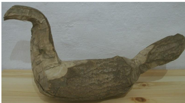
Фото 2. Заготовка для солоницы-утицы. Конец XIX – начало XX века. Д-1810

Затем с помощью тесла (топорика с лезвием в виде желоба) выбиралась глубина сосуда. Далее поверхность изделия выравнивалась скобелем (дугообразной железной пластиной), обрабатывалась резцом (специальной стамеской) и зачищалась терпугом (инструментом наподобие крупного напильника) 7 . Вырезая солонку-утицу, мастер оставлял между клювом и грудью перемычку, которая служила удобной ручкой. Спинку вместе с частью хвоста отпиливали и режущими инструментами выбирали в туловище углубление для соли. Затем выпиленную часть спины и хвоста