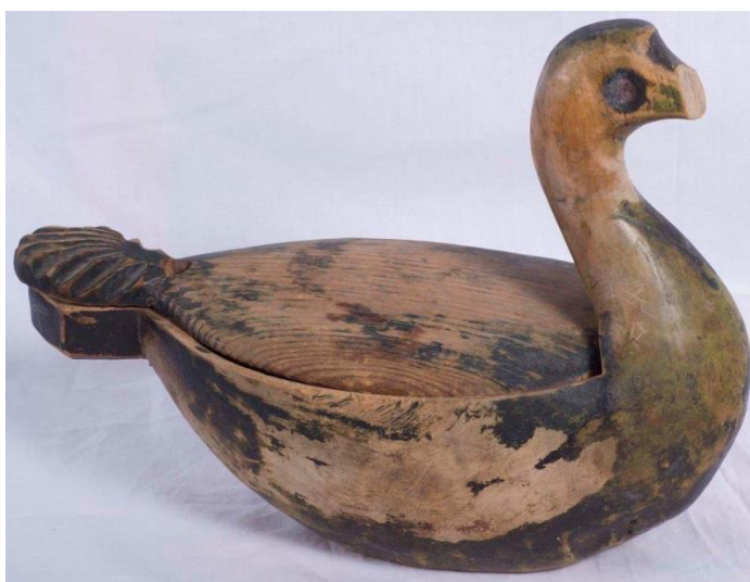
Фото 3. Солоница-утица. Конец XIX века. Д-1793

Затем с помощью тесла (топорика с лезвием в виде желоба) выбиралась глубина сосуда. Далее поверхность изделия выравнивалась скобелем (дугообразной железной пластиной), обрабатывалась резцом (специальной стамеской) и зачищалась терпугом (инструментом наподобие крупного напильника) 7 . Вырезая солонку-утицу, мастер оставлял между клювом и грудью перемычку, которая служила удобной ручкой. Спинку вместе с частью хвоста отпиливали и режущими инструментами выбирали в туловище углубление для соли. Затем выпиленную часть спины и хвоста