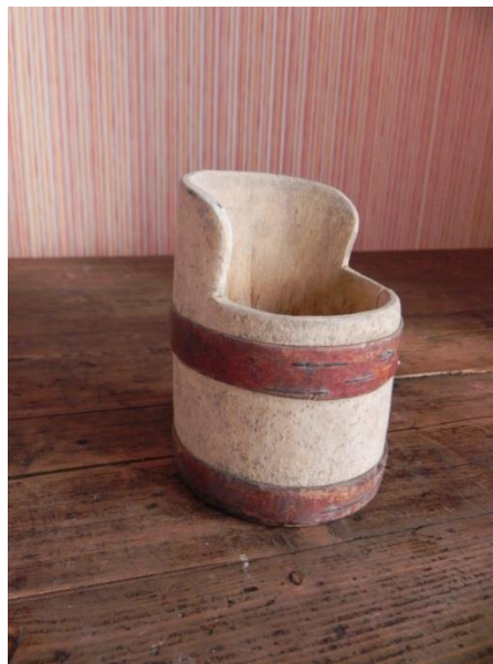
Фото 9. Солонка. Начало XX века. Д-1803

Ведь металлические детали от соли и влаги быстро ржавеют и разрушаются. По технике изготовления солонки-кресла можно разделить на три типа: долблёные, столярные и бондарные. Долблёные солонки вырезали из целого куска дерева (Фото 9).