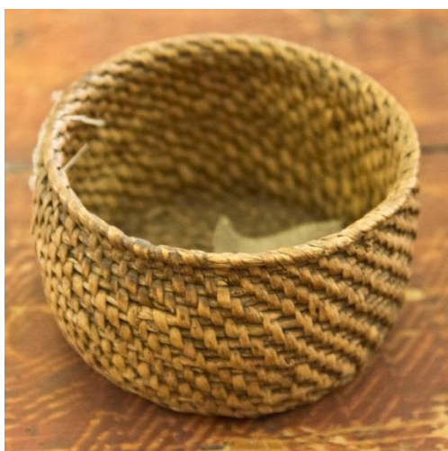
Фото 16. Солонка. Первая половина XX века. Д-621

Не меньше берестоплетения распространено было плетение из соснового корня. В коллекции музея находится 11 солониц, плетенных из корня сосны. Плетение изделий из корней известно с глубокой древности. Корни ели, сосны, кедра, пихты необыкновенно гибки. Свежий корень легко завязать узлом, не опасаясь сломать его. Высыхая, он становится упругим и прочным, а глянцевая поверхность очищенного корня необыкновенно красива. Различную утварь, плетенную из корня – солоницы, крупеницы, корзины – называли корневушками. При выделывании корневушек применяли особую технику плетения – спиральную. Укладывая спиральными витками более толстый корень (основу), последовательно обвивали виток за витком тонким корнем (оплеткой) 13 . Плели "по прямому" или косыми рядами, верх закрепляли березовыми или черемховыми ободами, украшали бахромой из бересты.