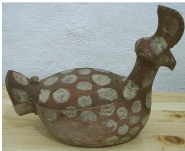
Фото 7. Солоница-петух. Конец XIX века. Д-1795

Солонки делались в виде чаши с крышкой – «кубышка», или чаши на невысокой точеной ножке и украшались росписью местного характера (Фото 6). Древесину могли также подкрашивать. Темный оттенок она приобретала после выдерживания в дубильном растворе из размельченной коры дуба, ольхи, ивы, березы. В качестве красителей использовали также сок ягод или кореньев. В XIX веке деревянную посуду начали расписывать масляными красками. Десять солониц в коллекции занимают предметы с росписью, выполненной самыми различными способами. Во второй половине XIX века северный крестьянский мир отдал предпочтение кистевой росписи без предварительного рисунка, со свободной раскладкой пятен «по чувству» как наиболее быстрому, эффектному и сравнительно недорогому способу декора. (Фото 7).