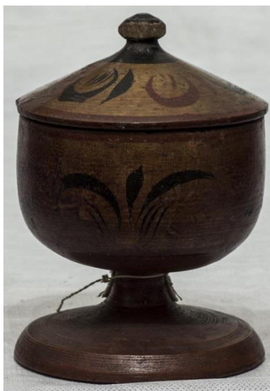
Фото 6. Солонка. Конец XX века. НВ-899

оконишники... и всякие мастеровые люди. Да за двором анбар 5-сажен, а держат в нем токари дерево вязовое и березовое, в которых суды делают» 9 .