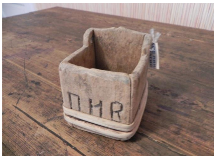
Фото 10. Солонка. Конец XIX – начало XX века. Д-1805

Столярные собирали из отдельных досочек, используя известные приёмы соединения деревянных деталей (например, в шип). Бондарные солонки тоже собирались из отдельных досочек, но скреплялись они друг с другом ивовым обручем, что придавало солонке большую прочность (Фото 10).