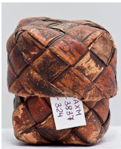
Фото 14. Солонка с крышкой. Начало XX века. Д-324

Настольные солоницы плели в виде коробочки с крышкой (Фото 14).