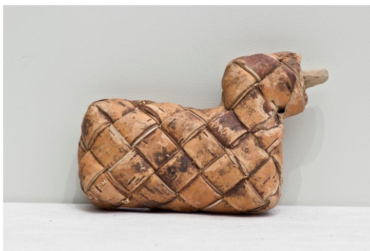
Фото 12. Солоник. Начало XX века. Д-713

герметичность сосудов, что было особенно важно в дороге (Фото 11). Часто изготавливались дорожные солоники в виде куба и г-образной формы, отдаленно напоминающие птицу-утицу (Фото 12). Чтобы соль не просыпалась и не волгла (не отсыревала), солонку плотно закрывали надежной пробкой.