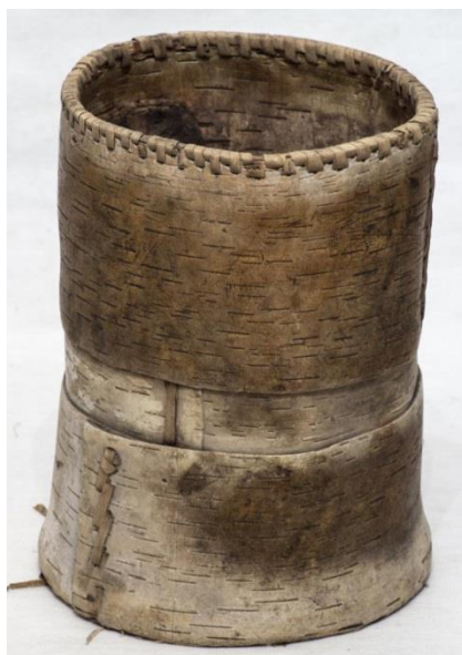
Фото 15. Лукошко для соли. НВ-696

Не меньше берестоплетения распространено было плетение из соснового корня. В коллекции музея находится 11 солониц, плетенных из корня сосны. Плетение изделий из корней известно с глубокой древности. Корни ели, сосны, кедра, пихты необыкновенно гибки. Свежий корень легко завязать узлом, не опасаясь сломать его. Высыхая, он становится упругим и прочным, а глянцевая поверхность очищенного корня необыкновенно красива. Различную утварь, плетенную из корня – солоницы, крупеницы, корзины – называли корневушками. При выделывании корневушек применяли особую технику плетения – спиральную. Укладывая спиральными витками более толстый корень (основу), последовательно обвивали виток за витком тонким корнем (оплеткой) 13 . Плели "по прямому" или косыми рядами, верх закрепляли березовыми или черемховыми ободами, украшали бахромой из бересты.