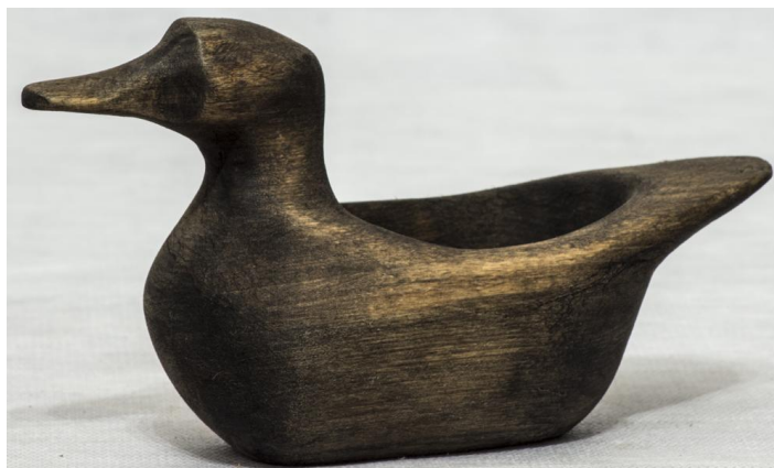
Фото 5. Солонка-уточка. Первая половина XX века. Д-1743

В солонках XIX века проявились тенденции к упрощению и снижению образа. Вместо стройного лебедя иногда появляется смешная уточка, с короткой низкой шейкой, курносый большим клювом на толстой подпорке и с корпусом, утратившим благородство очертаний. Изображение птицы утрачивает скульптурную выразительность, теряется четкость границ между частями. Сходство с изображением птицы только отдаленное. Шея, голова и клюв вместе с подпоркой становятся почти одной толщины, напоминая изогнутый крендель. Изделие делается быстро, с маху, точным ударом топора (Фото 5) 8 .