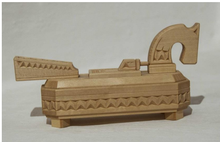
Фото 17. Солоница-конек. 2006–2007 годы. Д-2736