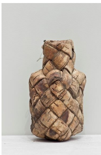
Фото 11. Солоник. Начало XX века. Д-299

Шестьдесят девять солонниц в собрании музея выполнены в технике косого плетения. При плотном многослойном плетении достигалась почти полная