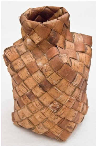
Фото 13. Бутыль для хранения соли. Начало XX века. Д-1177

Для хранения соли плели большие, до полуметра высотой, бутылеобразные сосуды с высокой узкой горловиной, закрывавшейся берестяным стаканом или массивной деревянной пробкой. (Фото 13).